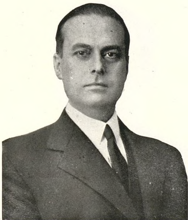
Excmo. Sr. D. Blas Pérez González MINISTRO DE LA GOBERNACION