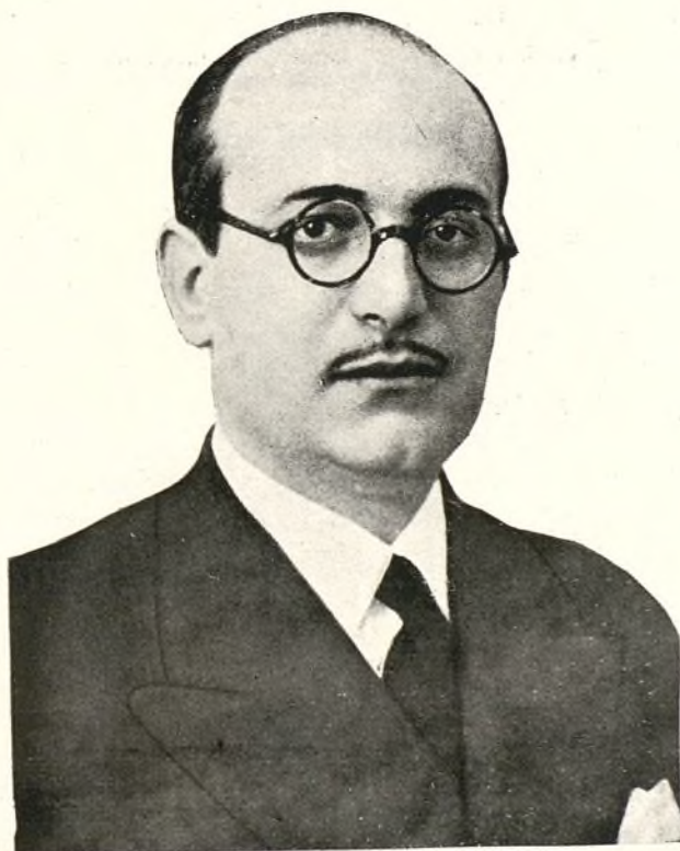
Excmo. Sr. D. José Ibáñez Martín MINISTRO DE EDUCACION NACIONAL