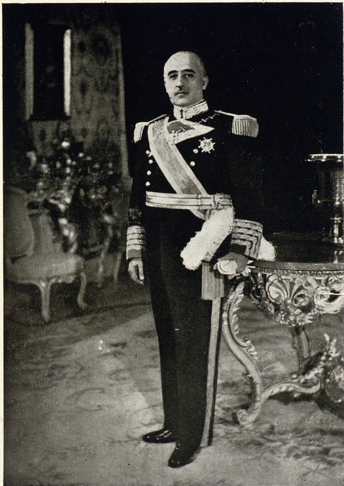
S. E. el Jefe del Estado, Generalísimo de los Ejércitos de Tierra, Mar y Aire, y Caudillo de España, Excmo. Sr. D. Francisco Franco Bahamonde