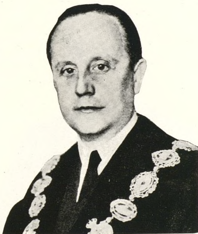
Excmo. Sr. D. Raimundo Fernández Cuesta MINISTRO DE JUSTICIA