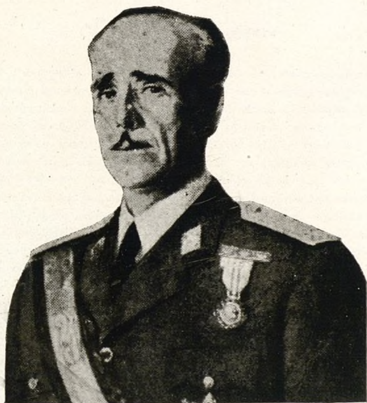
Excmo. Sr. Teniente General D. Carlos Asensio Cabanillas EX MINISTRO DEL EJERCITO Y ACTUALMENTE CAPITAN GENERAL DE BALEARES