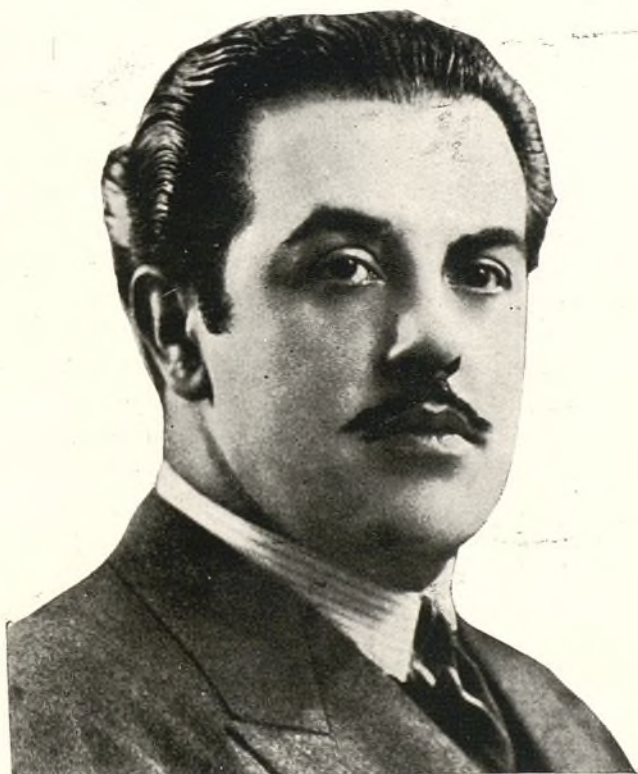
Excmo. Sr. D. José Antonio Girón de Velasco MINISTRO DE TRABAJO