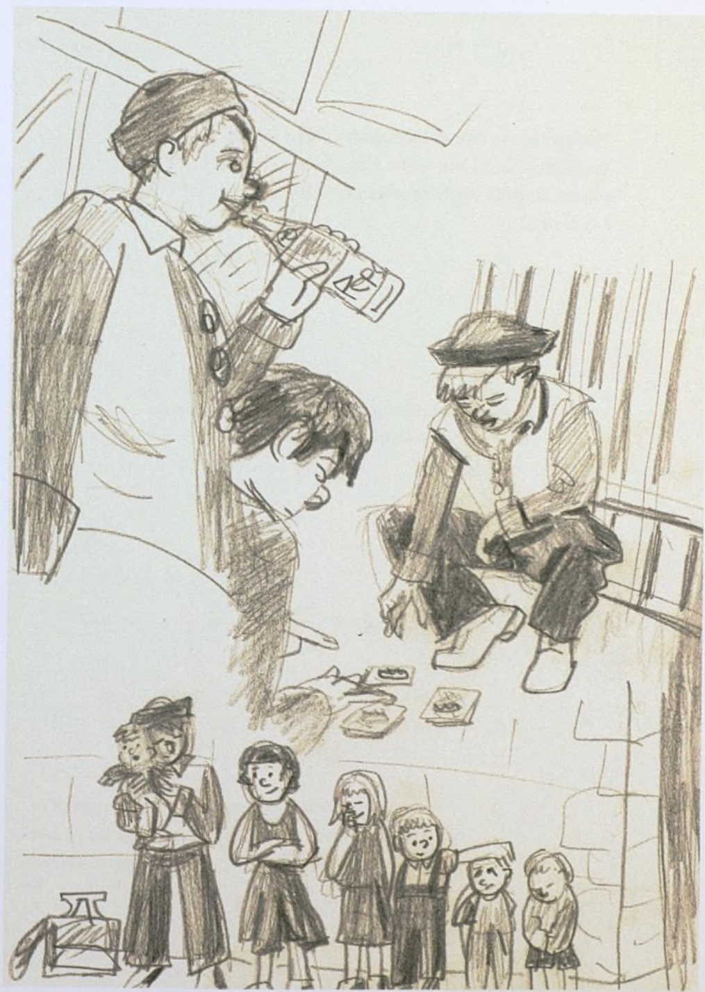
Ayuntamiento de Madrid