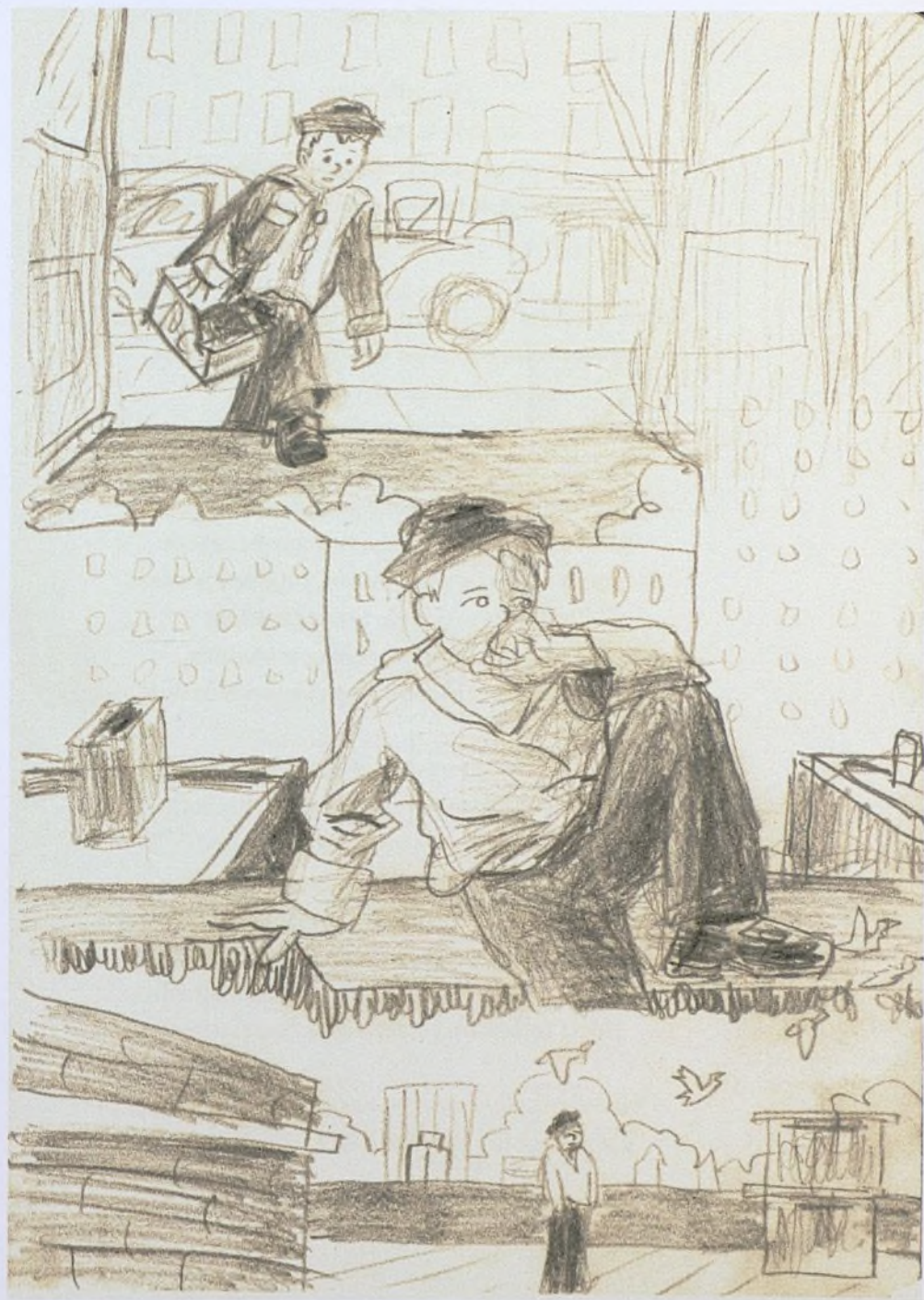
Ayuntamiento de Madrid