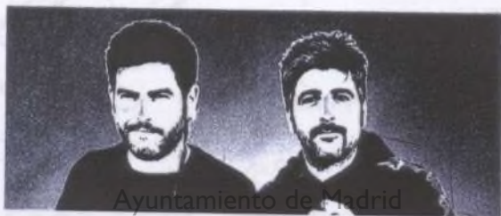
Ayuntamiento de Madrid