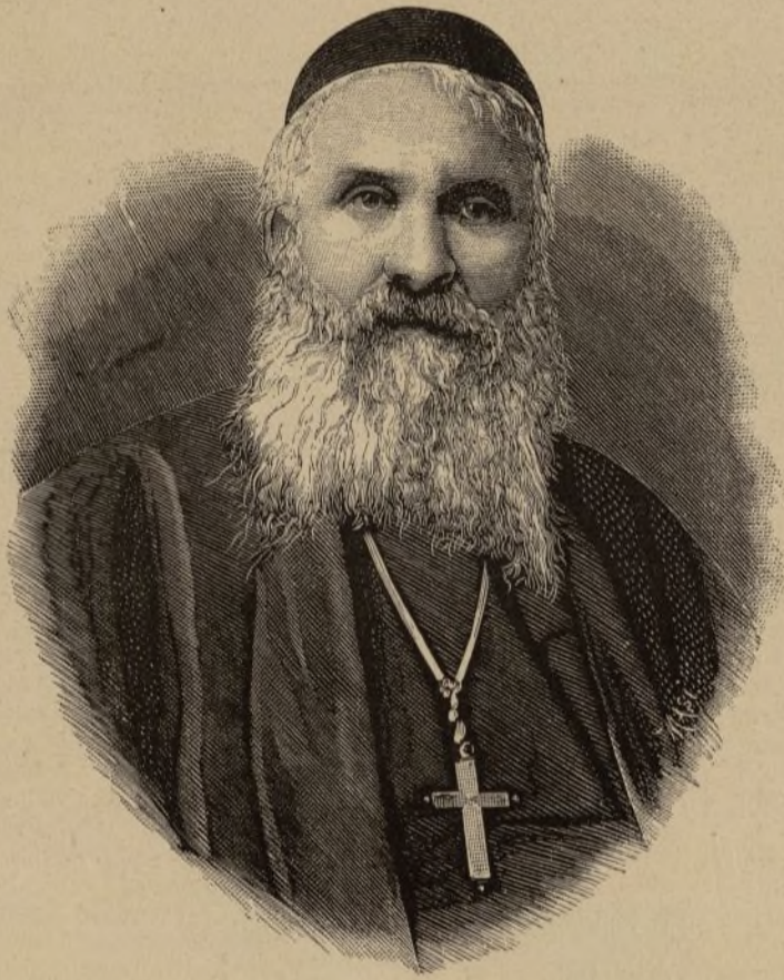
EMMO, CARDENAL ANTONIO HASSOUN † en Roma el día 2 de este mes

En nadie menos que en los Reyes puede censurarse el uso y posesión de las joyas, y, sin embargo, aquellas hermosísimas preces con que lucían sus gracias y hermosura en Versalles las princesas de la Corte francesa en los reinados de Luis XIV, Luis XV y Luis XVI van á pasar á manos de comerciantes, y su producto al bolsillo de los demagogos, que lo utilizaron en proseguir su