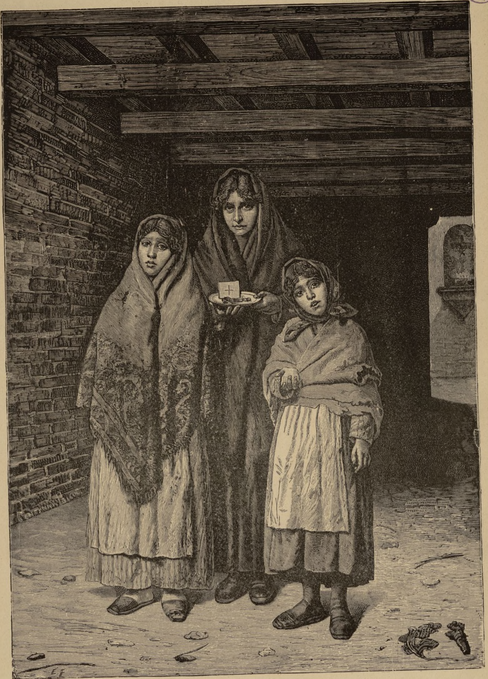
LA COLECTA PARA LAS FUNCIONES DE SEMANA SANTA EN LA ALDEA