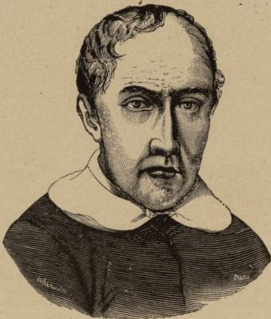
EL ARQUITECTO PACCIOOTTO

Se toma la leche de buena calidad, se disuelve en azúcar blanca en la proporción de 75 á 80 gramos por litro, y se concentra al vapor en calderas de fondo plano y muy poca profundidad, en las que al espesor de la capa líquida no pase de 1 á 2 centímetros; ésta se agita continuamente con paletas de madera para impedir la formación de una película que tiende á formarse en la superficie.