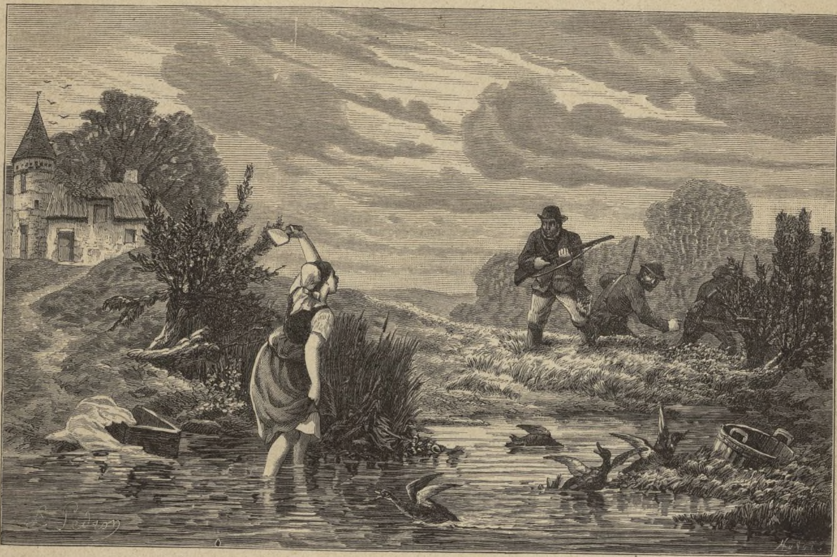
CAZA EN VEDADO.

«Cuando los que están obcecados por las tinieblas de los errores trabajan con empeño por des-