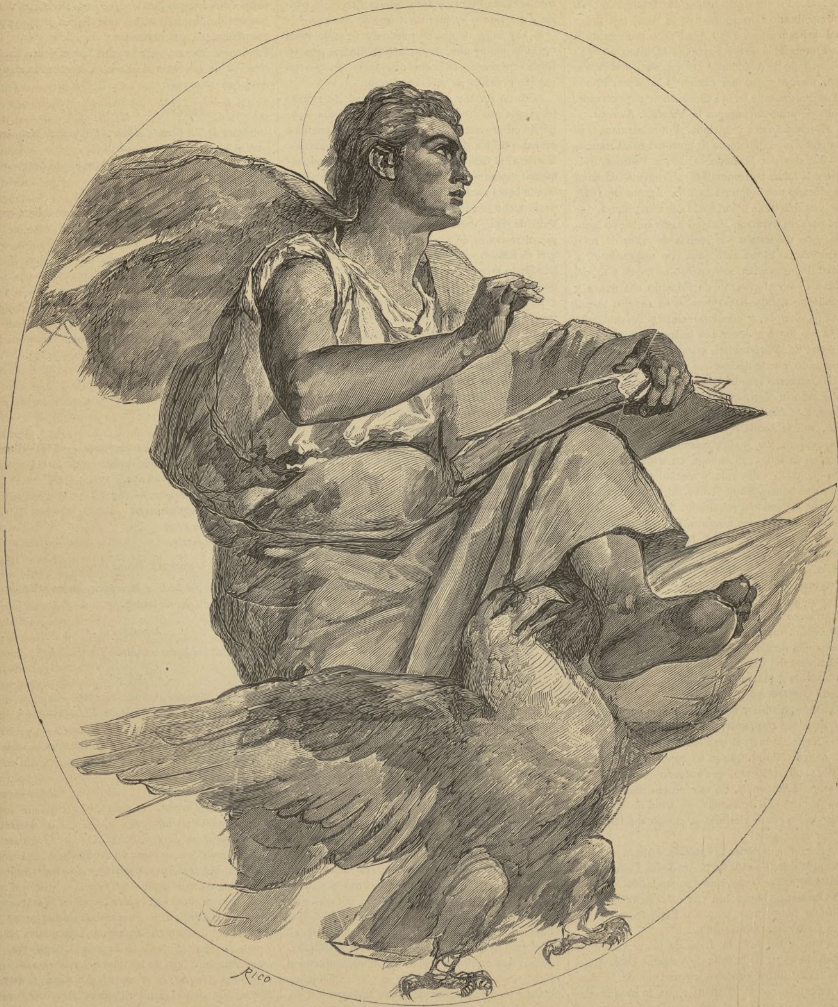
EL EVANGELISTA SAN JUAN, ÚLTIMA OBRA DE ROSALES.