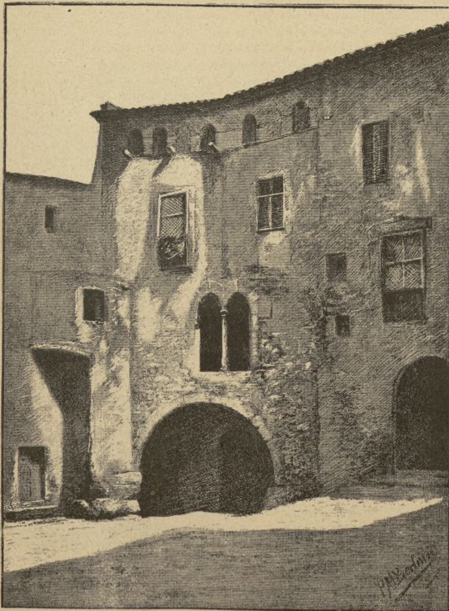
TARRAGONA, CASA ÁRABE, POR P. M. BERTRÁN.

T ORDESILLAS está en Barcelona y desde la condal ciudad saluda á sus lectores decenales, transmitiéndoles á vuela pluma sus impresiones, difíciles de