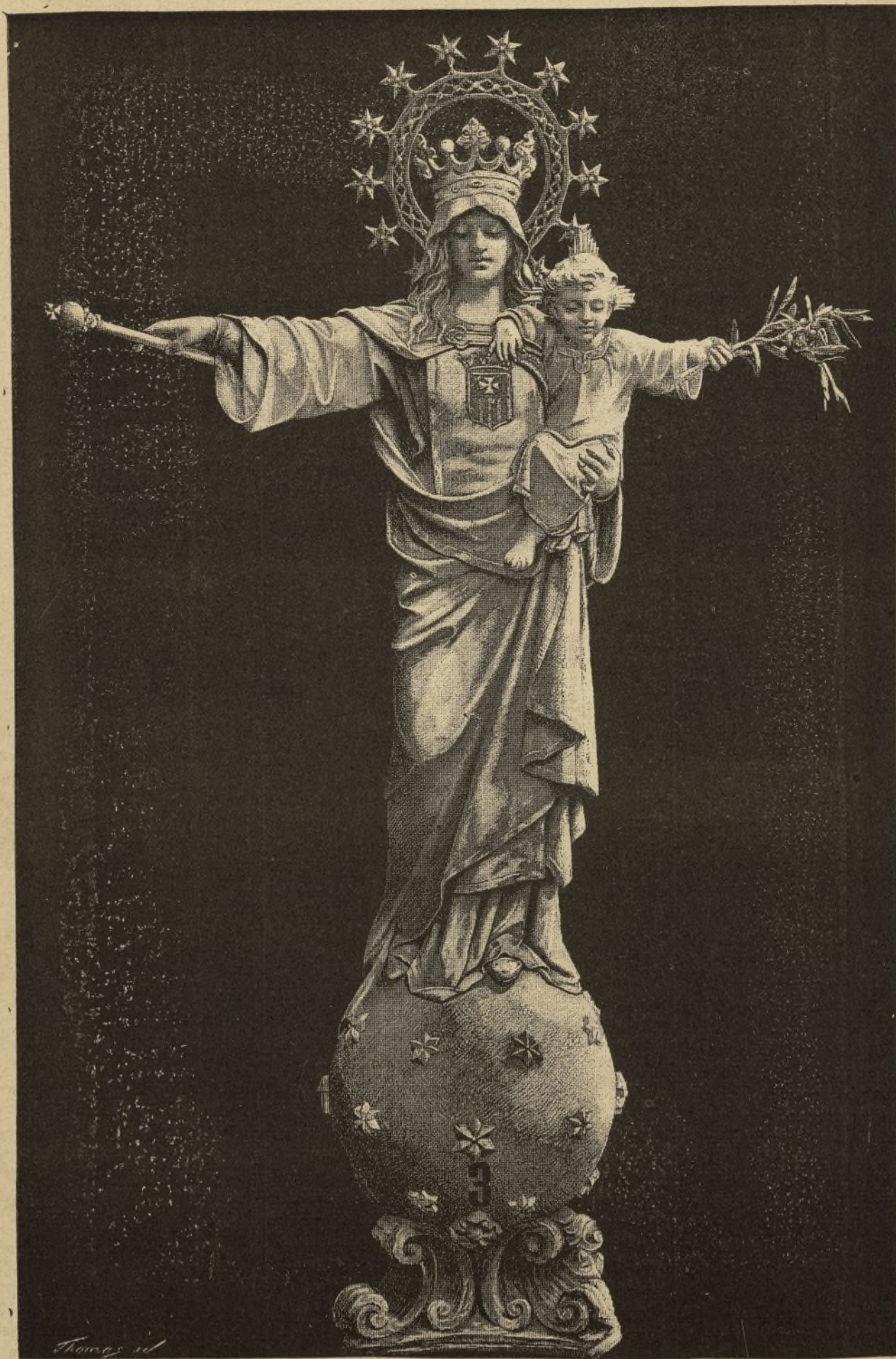
LA VIRGEN DE LAS MERCEDES. — ESTATUA DE SALA, DIBUJO DE P. ROSS.