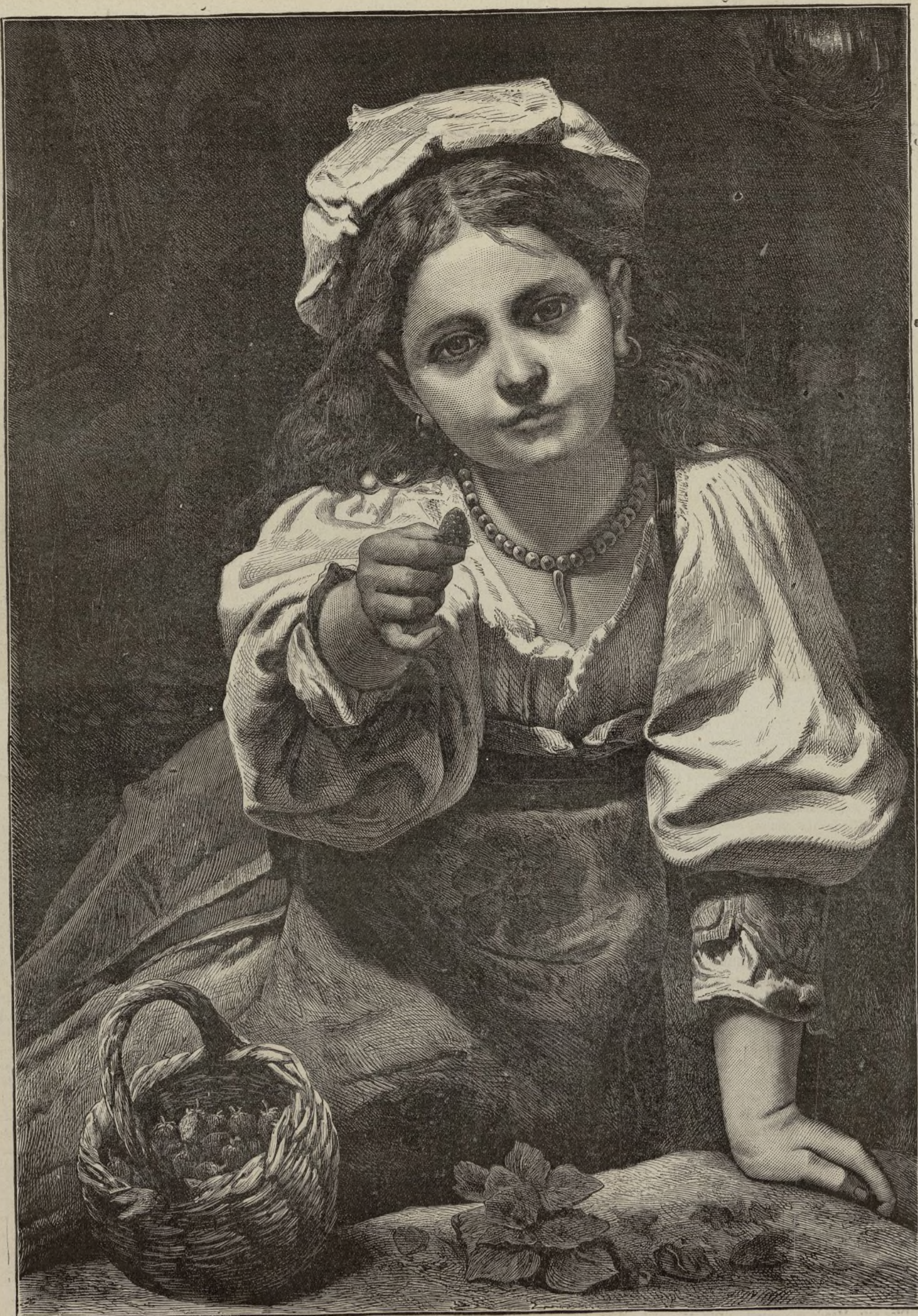
LA MADROÑERA NAPOLITANA.