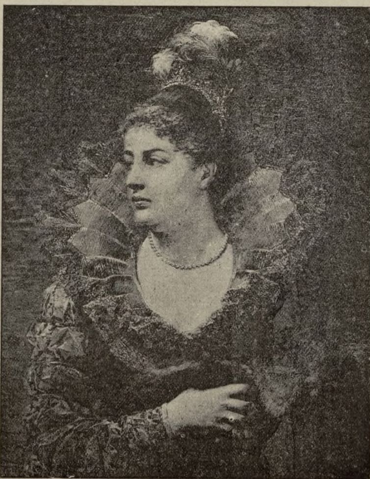
DAMA DEL SIGLO XV, CUADRO DE FRANCISCO MASRIERA.

Fontanet (GIL), pintor de vidrieras. Entre otras, construyó y pintó á fines del siglo xv en la Catedral de Barcelona las de la capilla de la pila bautis-