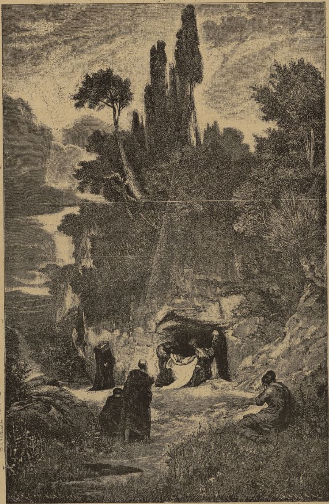
EL SEPULCRO DE CRISTO