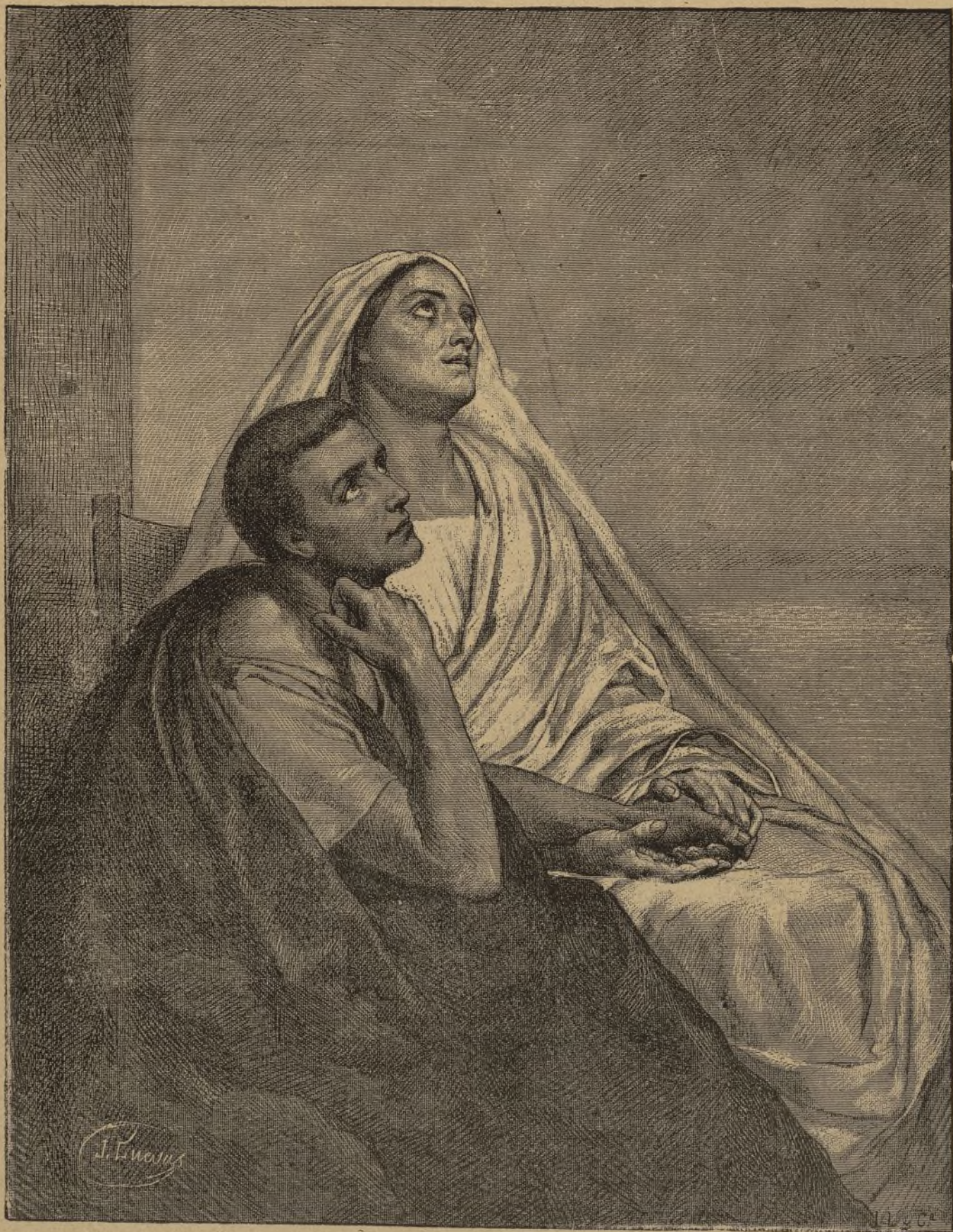
SAN AGUSTÍN Y SU MADRE SANTA MÓNICA

Tolosa lo llevó á la Escuela superior de Teología , nombrándole profesor de Apologética y elocuencia sagrada, y dándole una canonjía en premio de sus dilatados servicios en la enseñanza.