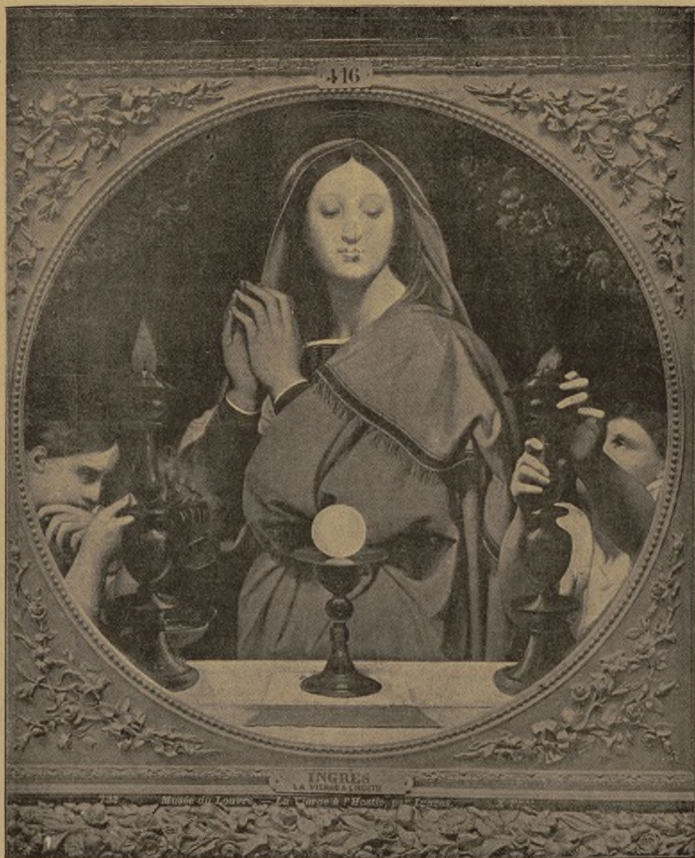
LA VIRGEN DE LA HOSTIA