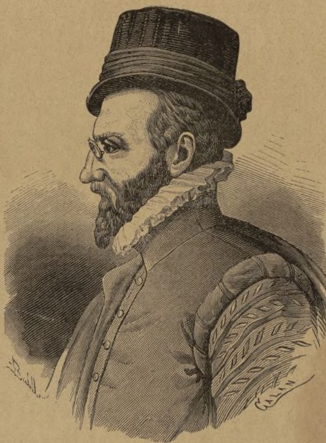
JUAN DE ARFE VILLAFAÑE