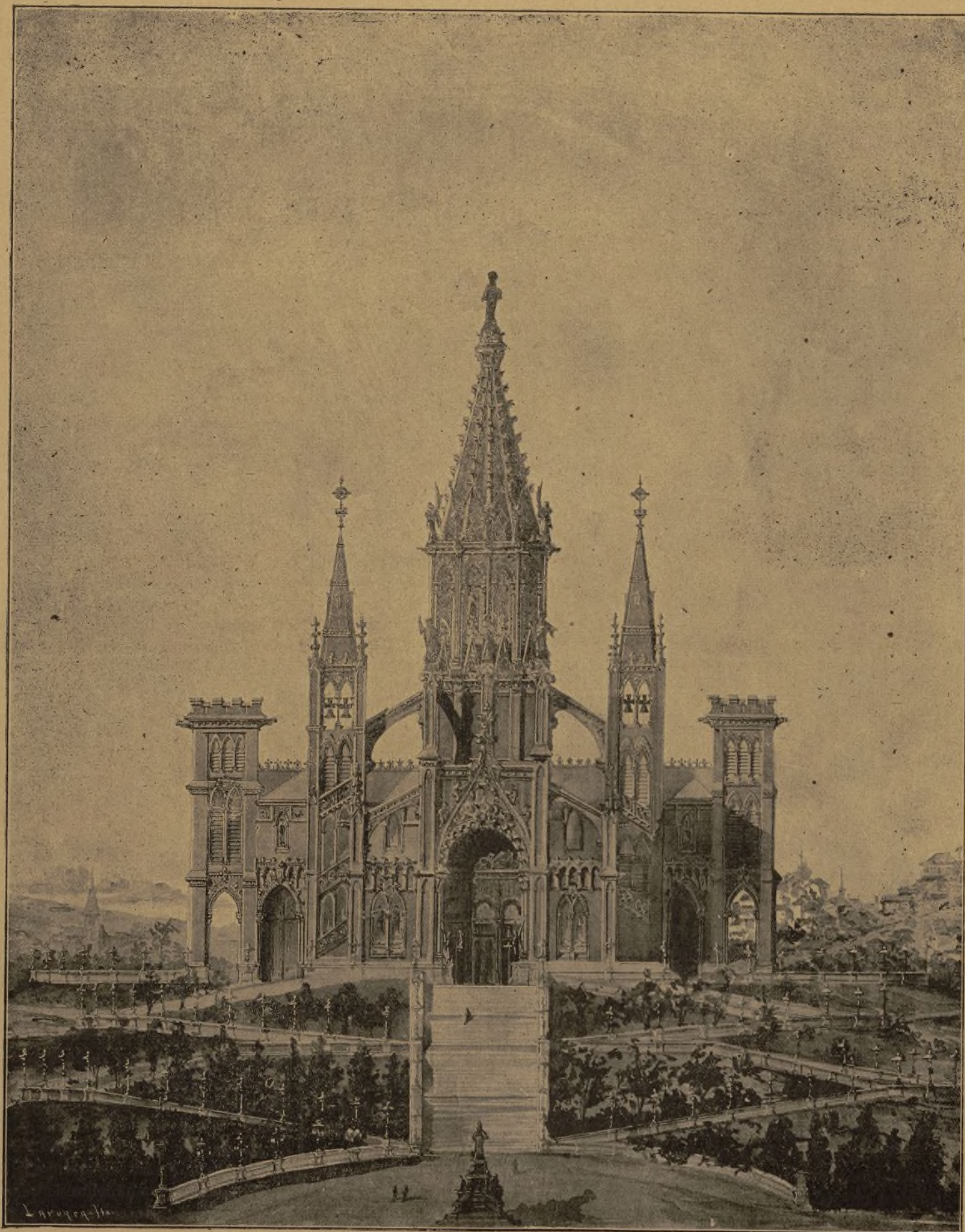
PROYECTO DEL SR. REPULLÉS,