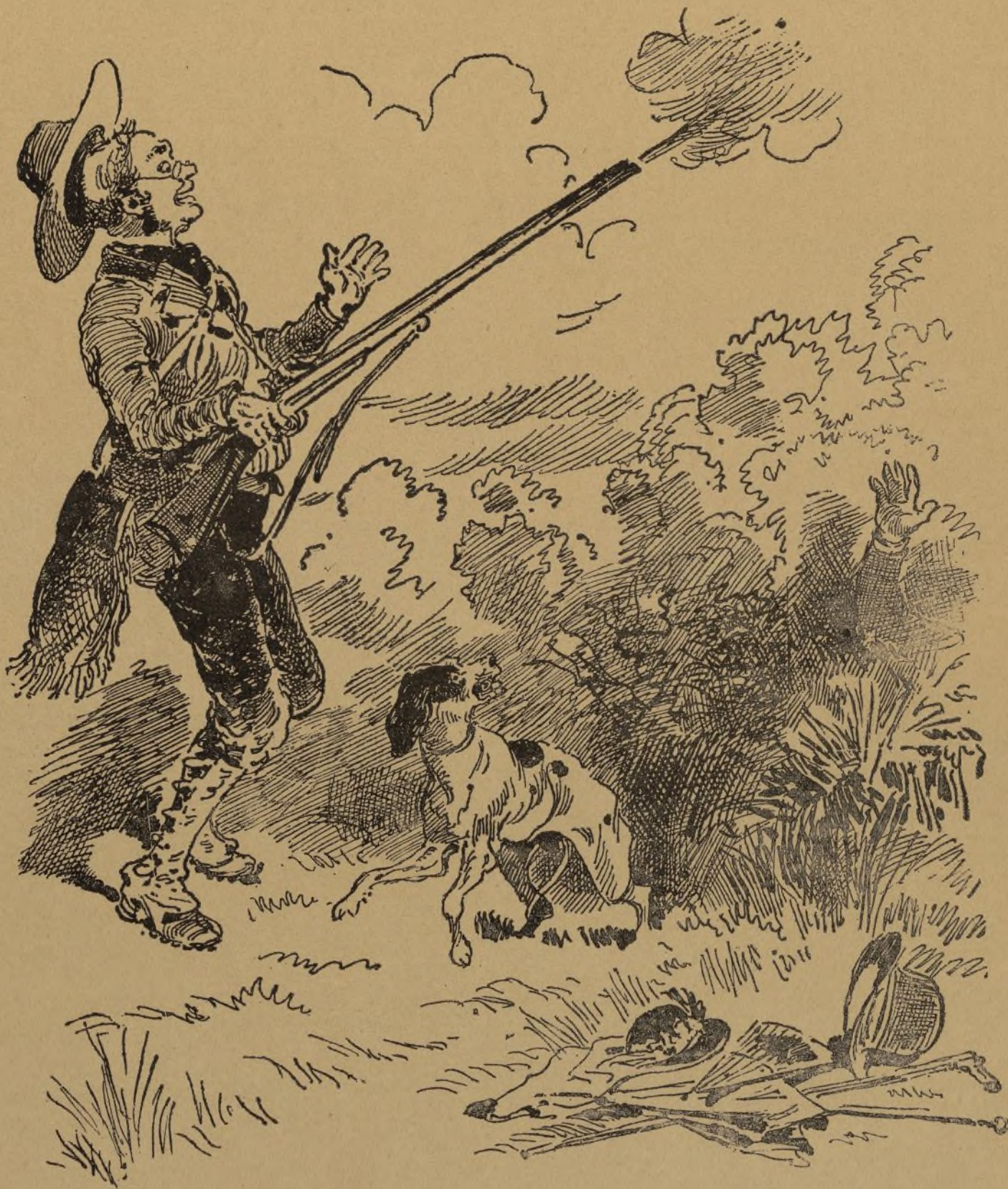
ESCENA DE CAZA