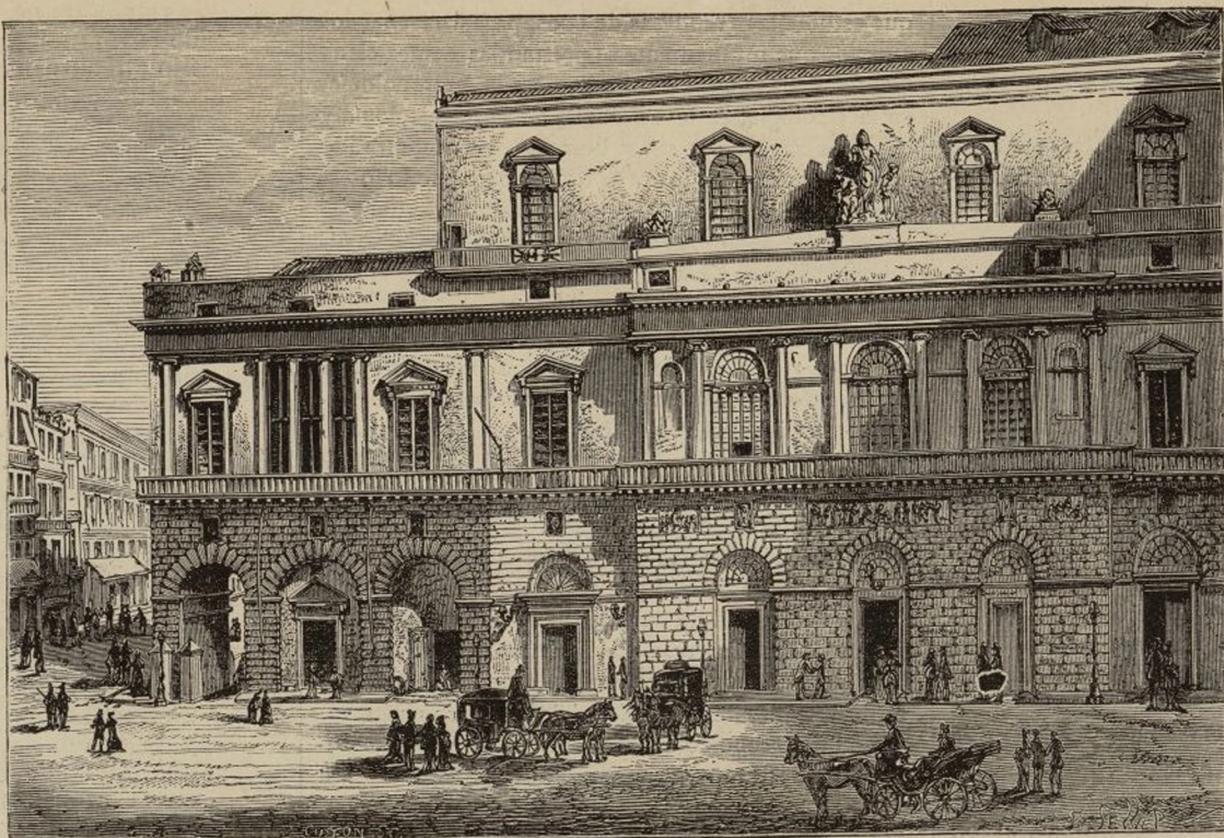
EL TEATRO DE SAN CARLOS.