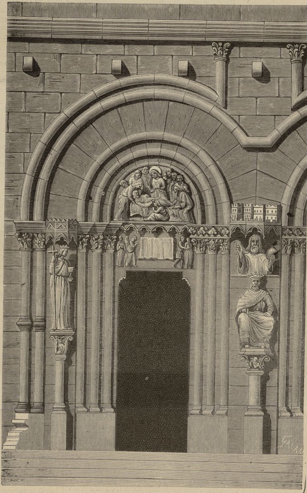
PORTADA MERIDIONAL DE LA CATEDRAL DE STRASBURGO.

Trataba entónces la Compañía de establecer en Roma un colegio que sirviese de modelo á los demás que hubiese de fundar, y de plantel de buenos maestros para que de este modo la enseñanza fuese tan vasta como uniforme. Entre los varios jóvenes españoles que fueron llamados con este objeto, uno de ellos fué Mariana, de edad de unos veinticuatro años, sin que sirviese esto de obstáculo para ponerle al frente de una cátedra de artes, y en seguida de otra