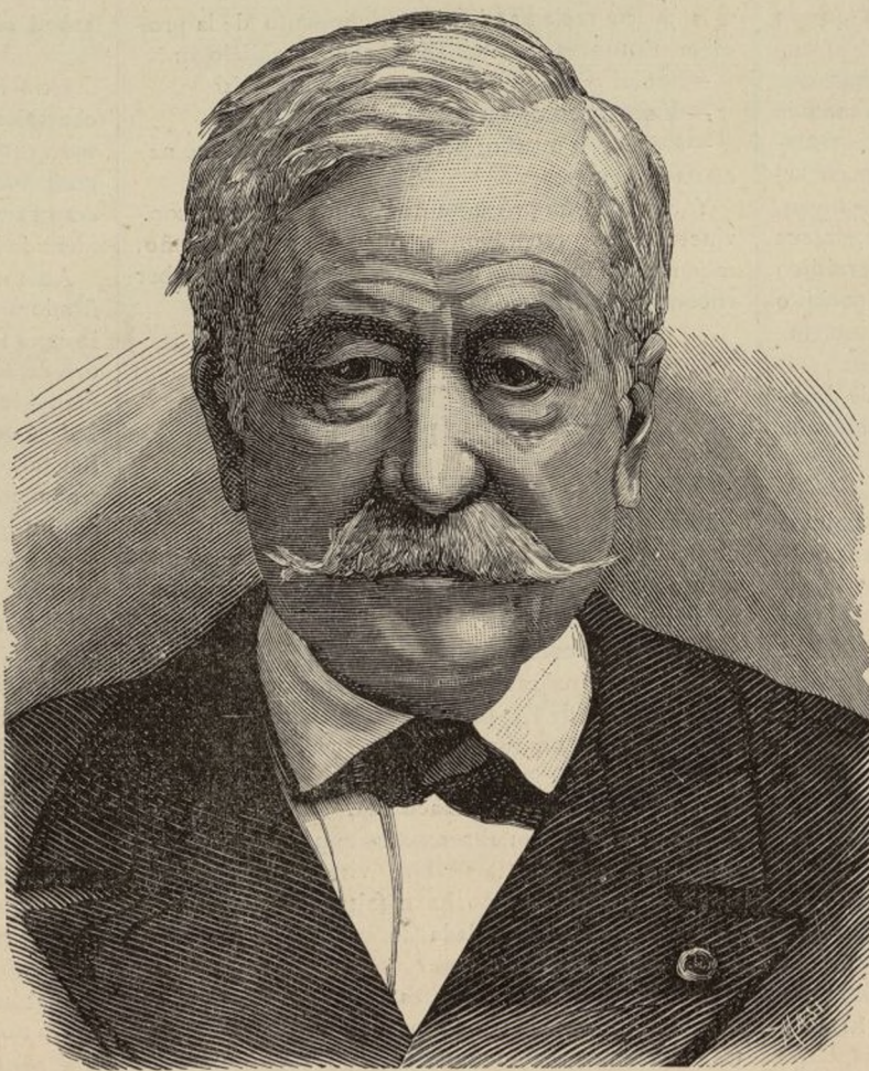
MR. FERNANDO DE LESSEPS, INICIADOR Y DIRECTOR DE LOS CANALES DE SUEZ Y DE PANAMÁ.

Iglesia tan amenazada como ahora, en que las olas la envuelven como montañas altísimas próximas á derrumbarse sobre ella, y el piloto está encadenado y preso para que no pueda dirigir la maniobra de salvamento. Sabemos que no sucumbirá; pero muchos de los tripulantes podrán perecer en la borrasca, y es deber de todos los que en la nave vamos echar mano á los remos y á las jarcias para resistir el puje de la tempestad desencadenada. Todos debemos tambien unir nuestras oraciones para pedir al cielo el frís de bonanza, que derrame sobre la sociedad los resplandores de la paz y de la justicia.