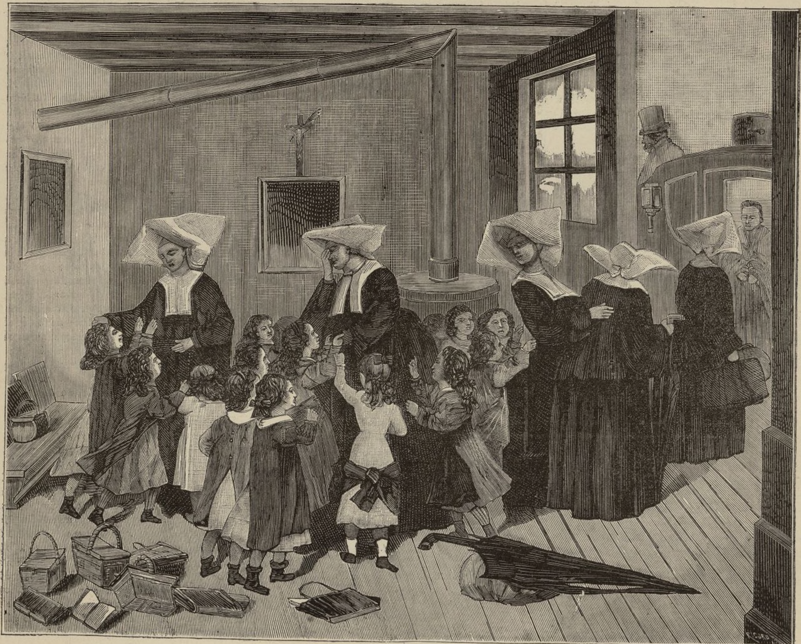
EXPULSION DE LAS RELIGIOSAS DE LAS ESCUELAS MUNICIPALES DE PARÍS.

pañola, y emparentado con la emperatriz Eugenia, tiene grandes simpatías por nuestra patria, en la cual ha residido algun tiempo. Aparte de otras cualidades poco comunes, Mr. Lesseps es notable por su constancia y su actividad incansables. Baste decir que en los diez años que ha durado la perforacion del istmo de Suez, contando ya con más de sesenta años, hizo treinta viajes desde Egipto á Paris y Londres, viajando sin equipaje, y manteniéndose largas temporadas con pan y frutas.