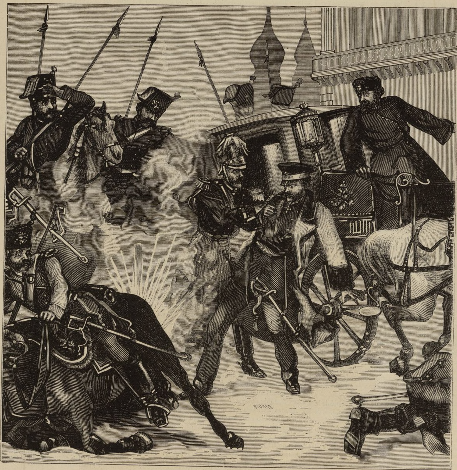
ASESINATO DEL CZAR ALEJANDRO II, EN SAN PETERSBURGO.

Estimamos, pues, que de Nuestra parte merece recomendarse con peculiar alabanza el cuidado que os proponeis tener, así de informar en la verdad y en la virtud á la adolescencia, tan acosada en torno por las