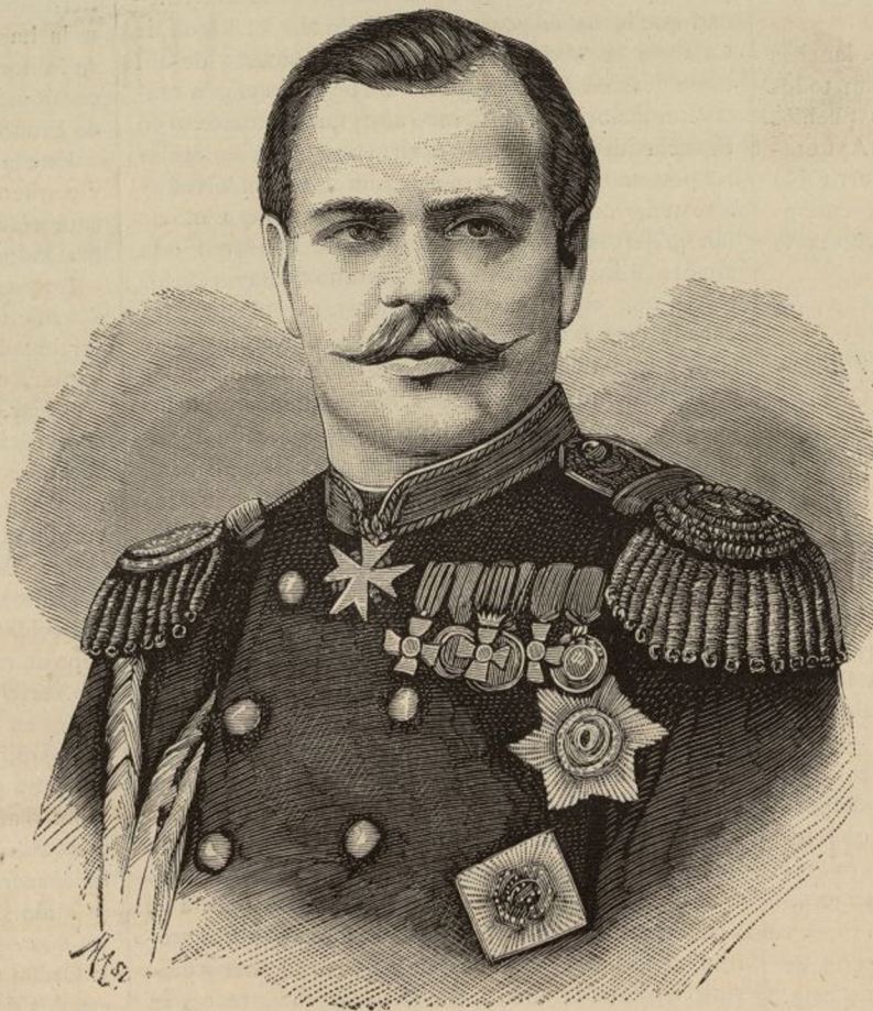
ALEJANDRO III, EMPERADOR DE RUSIA.

El terrible azote de las inundaciones parece querer enseñarse con nosotros, según la frecuencia y rigor con que en diversas provincias se repiten.