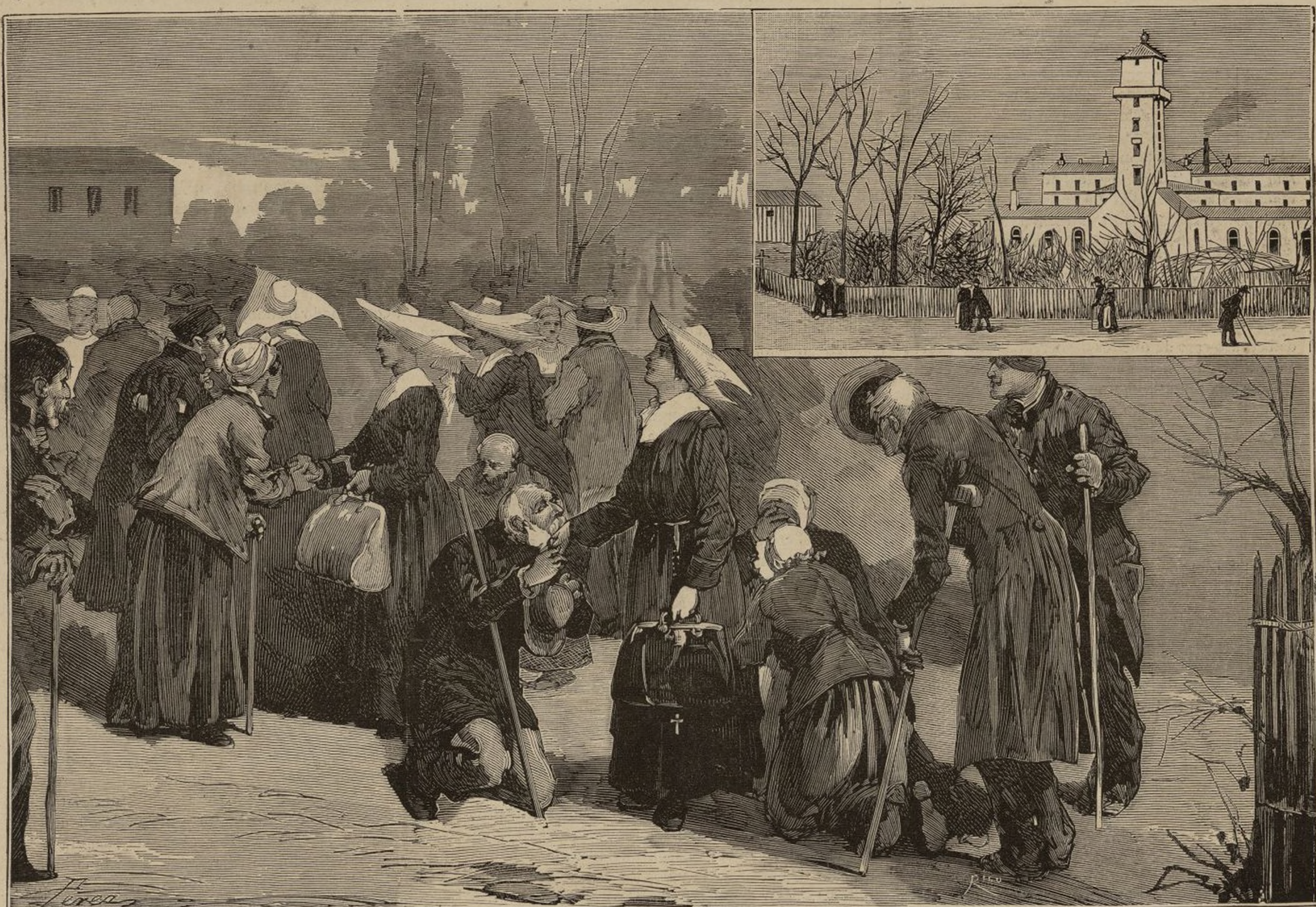
EXTERIOR DEL HOSPICIO «DES PETITS-MÉNAGES» EN PARÍS, Y EXPULSION DE LAS HERMANAS DE LA CARIDAD QUE EN ÉL PRESTABAN SUS SERVICIOS, DECRETADA RECIENTEMENTE POR LAS AUTORIDADES REPUBLICANAS.

De este interesantísimo monumento hablará dentro de poco, con su acostumbrada erudicion, el