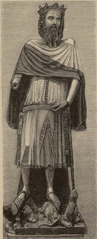
ESTATUA MARMÓREA DE SAN CARLOMAGNO, venerada desde el siglo XIV en el altar de los Cuatro Santos Mártires de la catedral de Gerona.

Cuando salga este número se habrá inaugurado en el Paraninfo de la Universidad Central un Congreso