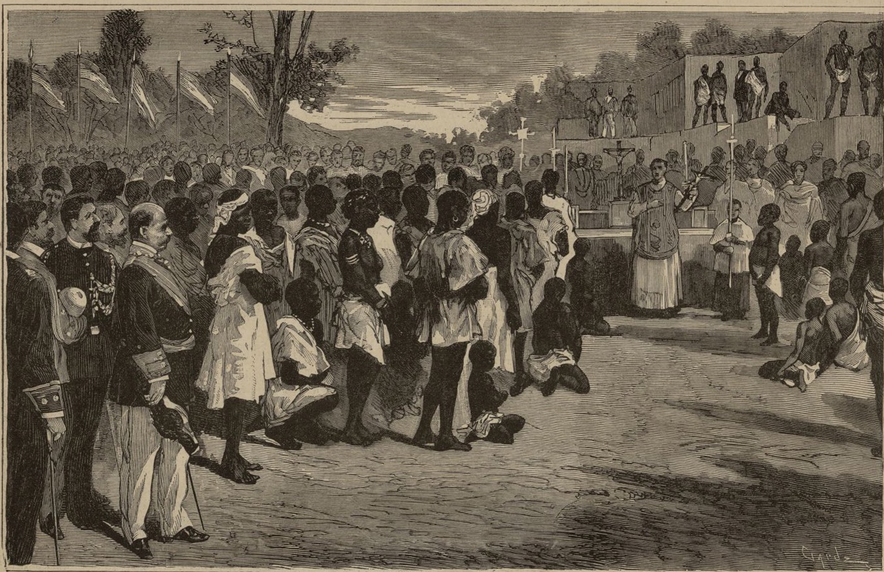
MISA CELEBRADA EN BUCAY ANTE LAS TRIBUS ÚLTIMAMENTE REDUCIDAS, VECINAS DE LOS «IGORROTES».

¡Cuántas veces abrazamos El error por la verdad! ¡Y cuántas veces hallamos La desgracia..... do soñamos Hallar la felicidad!