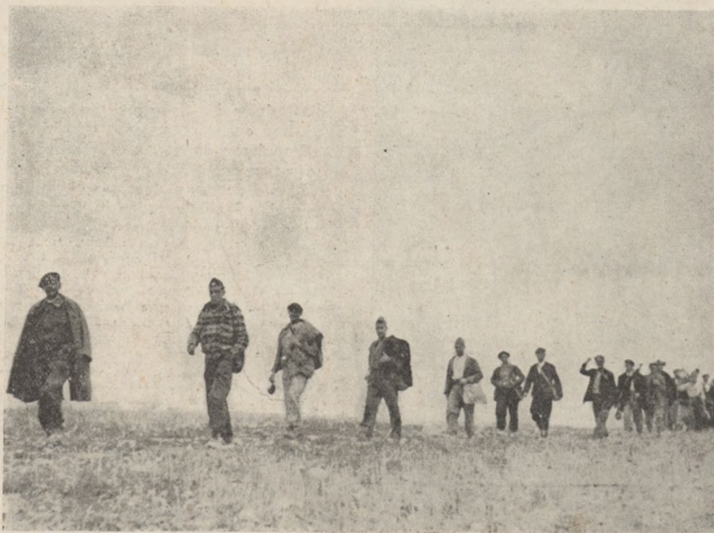
Los de fortificaciones van camino de su trabajo. Que con su esfuerzo y heroicidad, también ayudan a ganar la guerra.