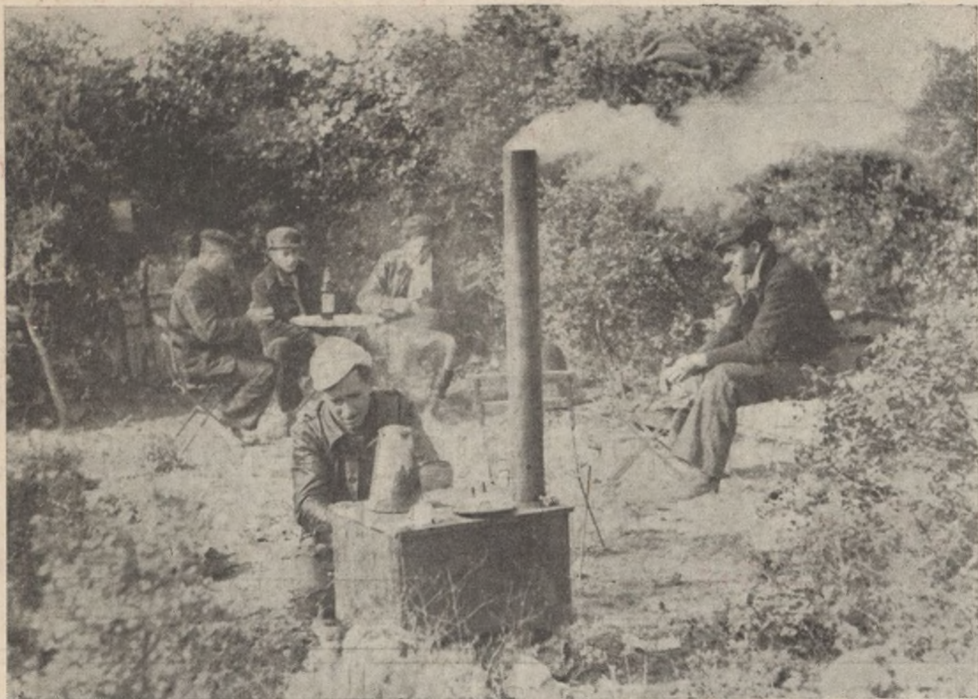
Vean una «magnífica» cocina en pleno campo. ¿Y las cocineras, qué tal?

pues nos metemos en juerga, y a coro todos cantamos, las canciones de guerra.