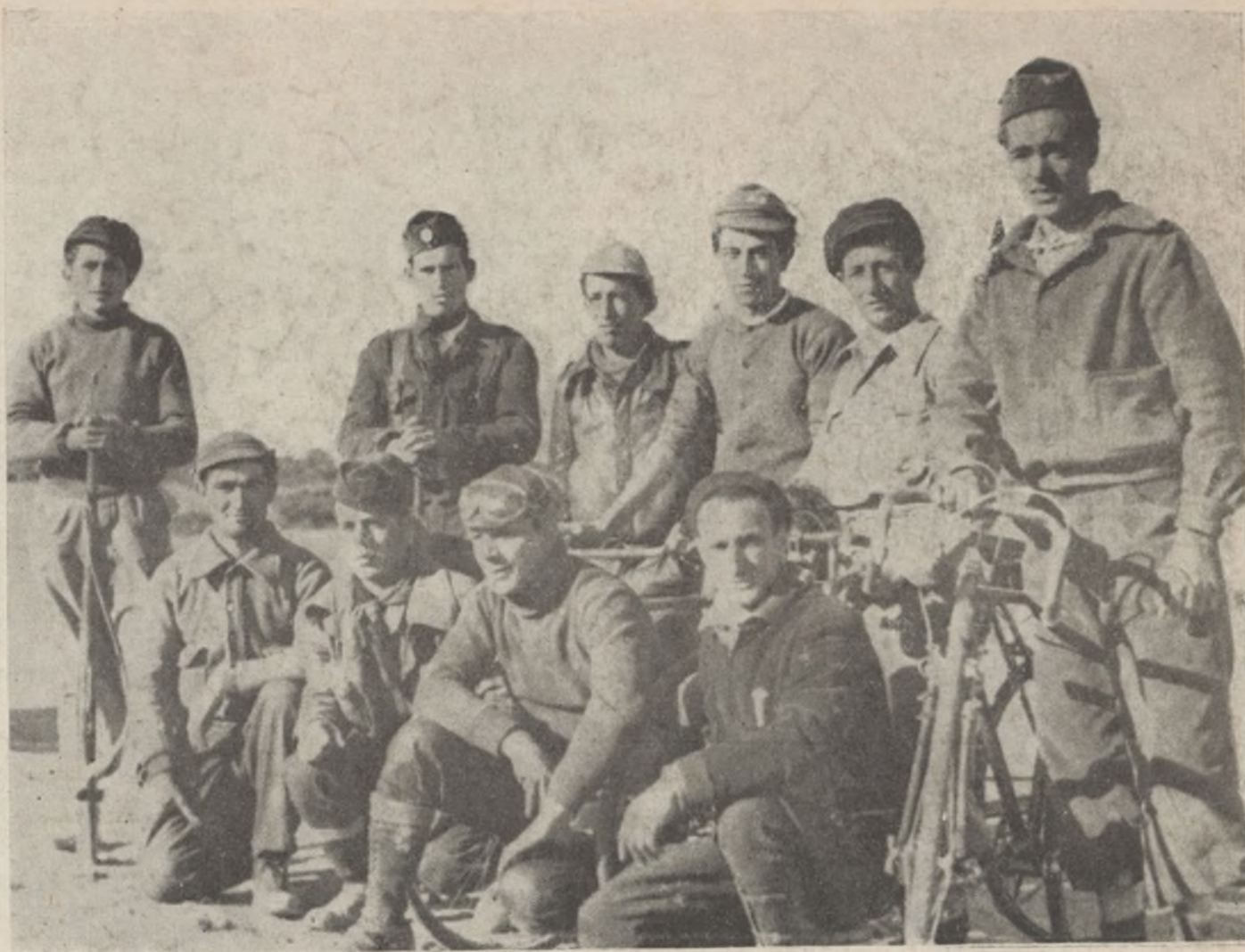
Enlaces y motoristas, posan para el periódico