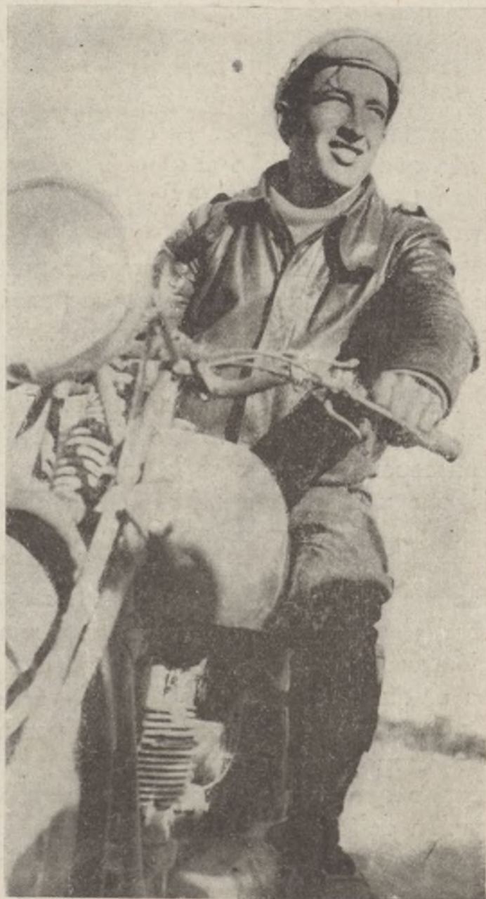
Enlace motorista de la Brigada, que entró el primero en Brihuega llevando un parte de operaciones, por cuyo caso fué premiado por el Jefe de la División, comandante Mera.

Se dan muchos casos en el fragor de la guerra que sostenemos frente al fascismo internacional, de los resabios del fenecido y añejo militarismo. El oficial endiosado. El gesto trae al recuerdo de los trabajadores el gesto tirano de sus eternos enemigos y la imposición de una disciplina para comodidades personales. De esto también se ha dado cuenta el autor del artículo que inspiró mis cuartillas. ¿Se puede hacer un oficial como se hace un traje? No, aunque esté en una academia dos o tres meses. Aunque venga de este o el otro sector antifascista o tenga carrera o tenga el grado de bachiller.