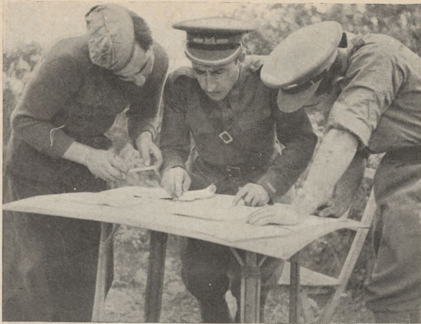
El Comandante despacha y consulta en pleno campo con sus ayudantes

labra, la unión de todos los antifascistas contra el enemigo común, representado por el fascismo.