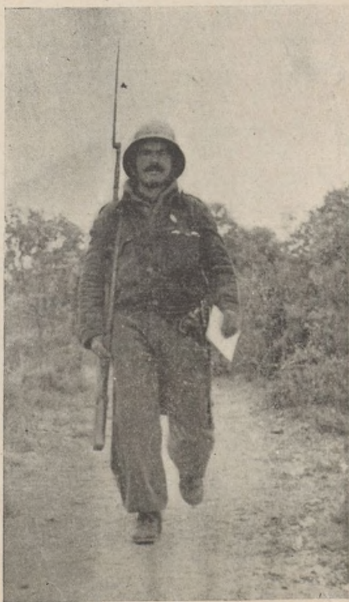
Un enlace en su reparto diario de órdenes