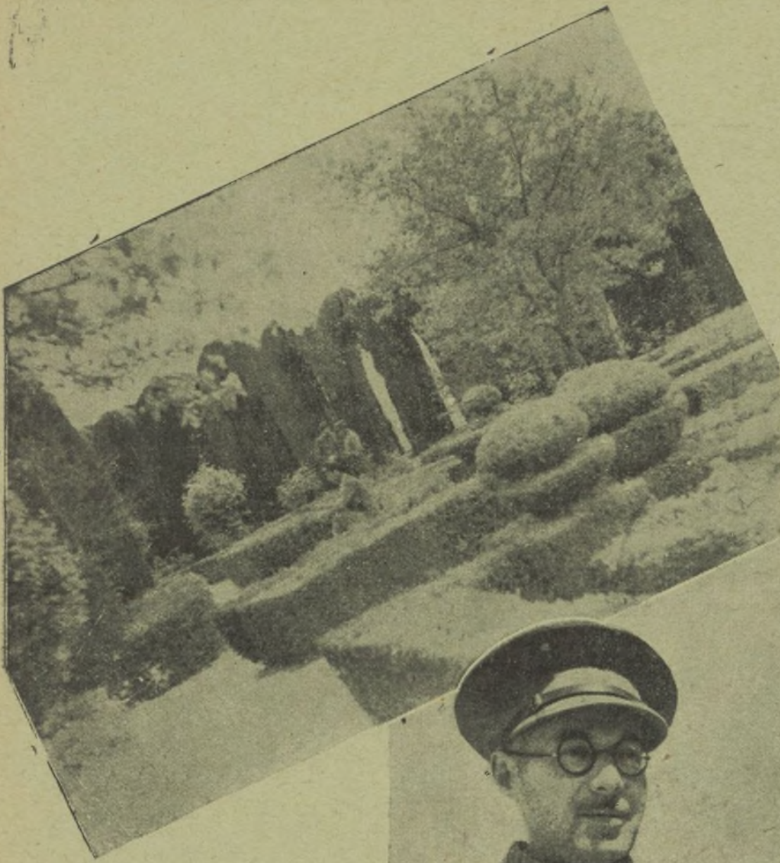
De nuestro Hogar del soldado se aprecia en esta foto uno de sus rincones.