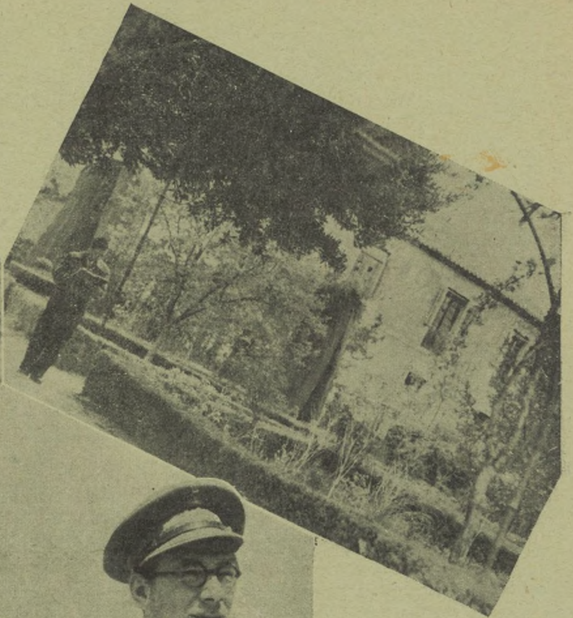
La verdad, que leer en este jardín es cosa que seduce; al menos así nos da a entender la aplicación del compañero lector. Ni al fotógrafo ve.