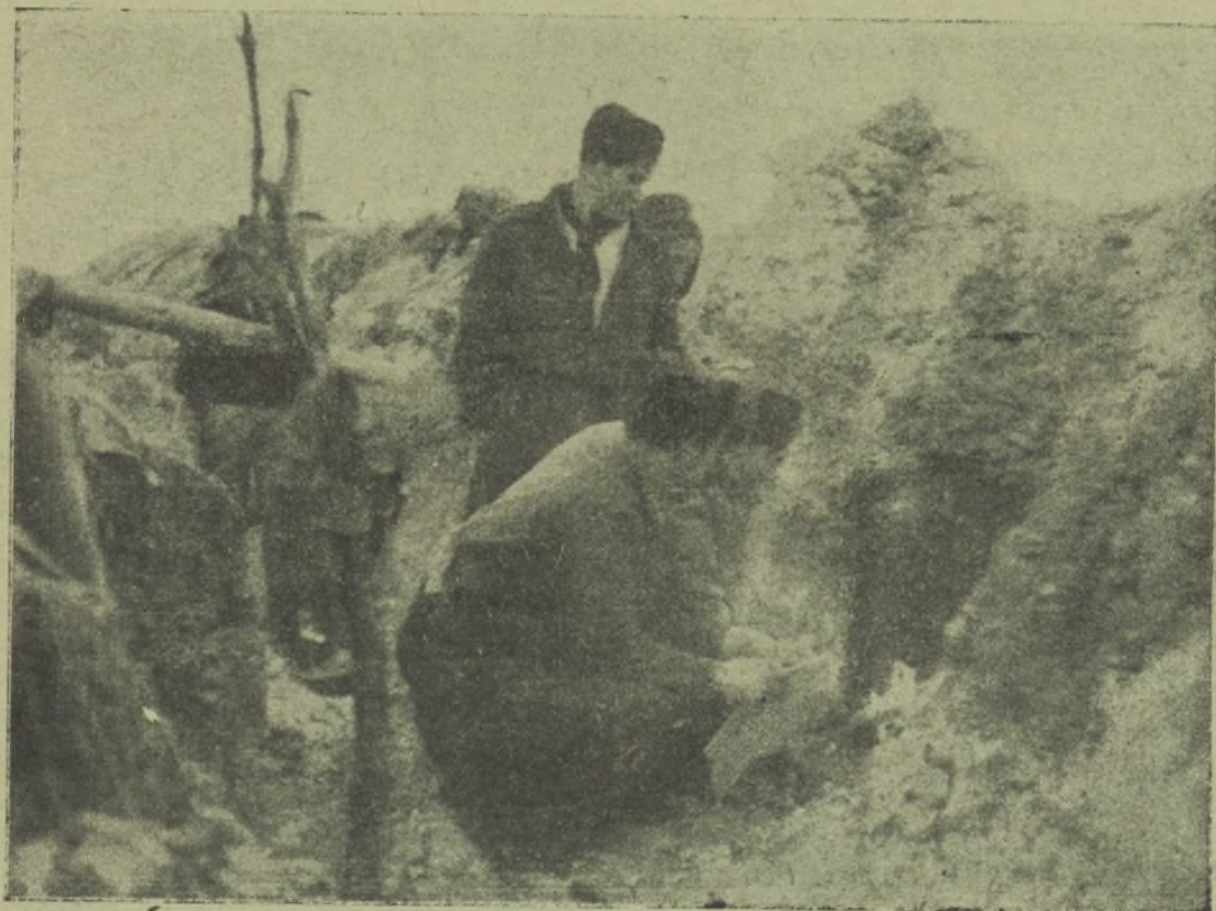
La guerra crea estas estampas retrospectivas y hace así la vida de indumentaria, como en esta foto se ve.