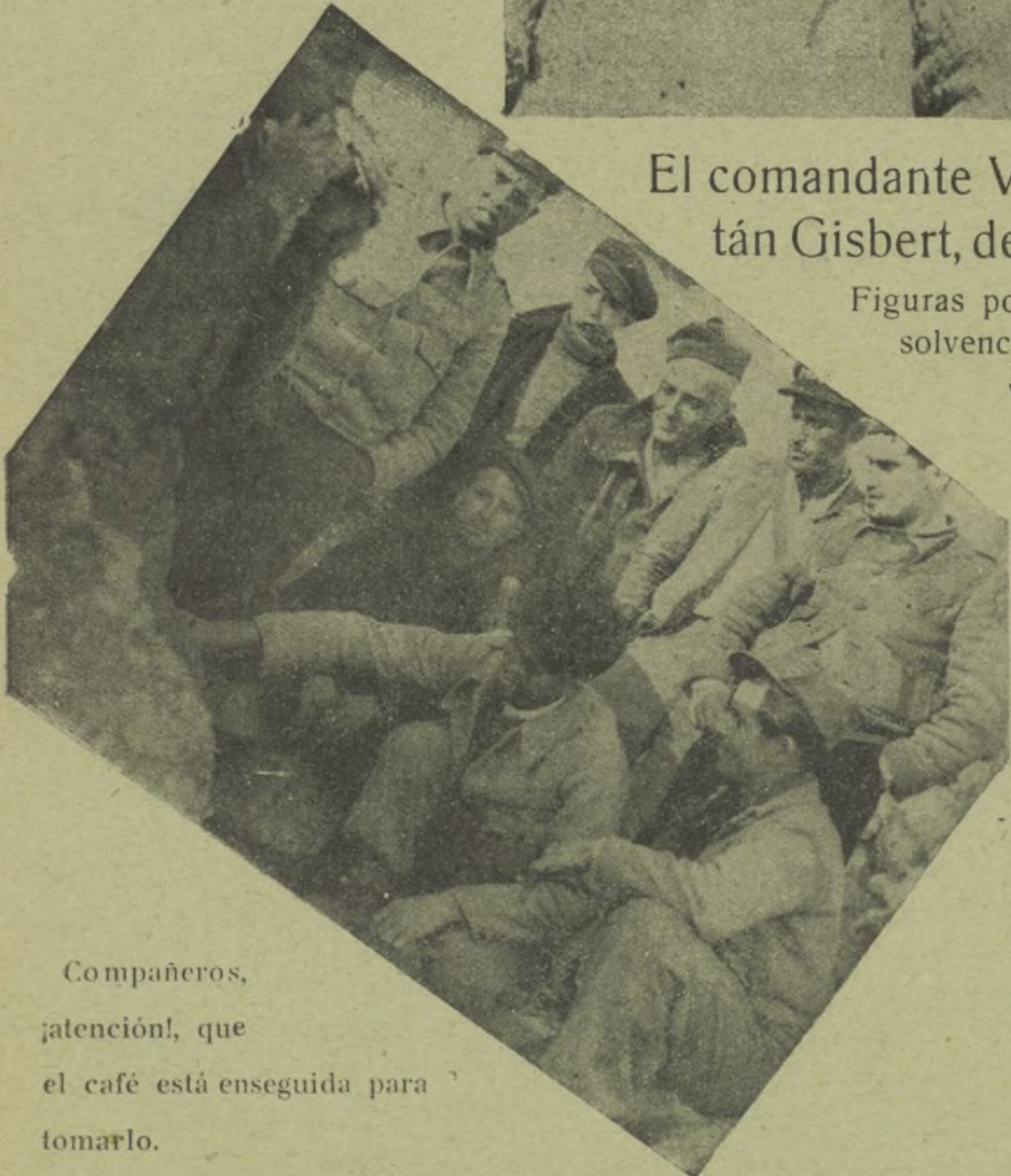
Compañeros, ¡atención!, que el café está enseguida para tomarlo.

Figuras populares y de solvencia militar.