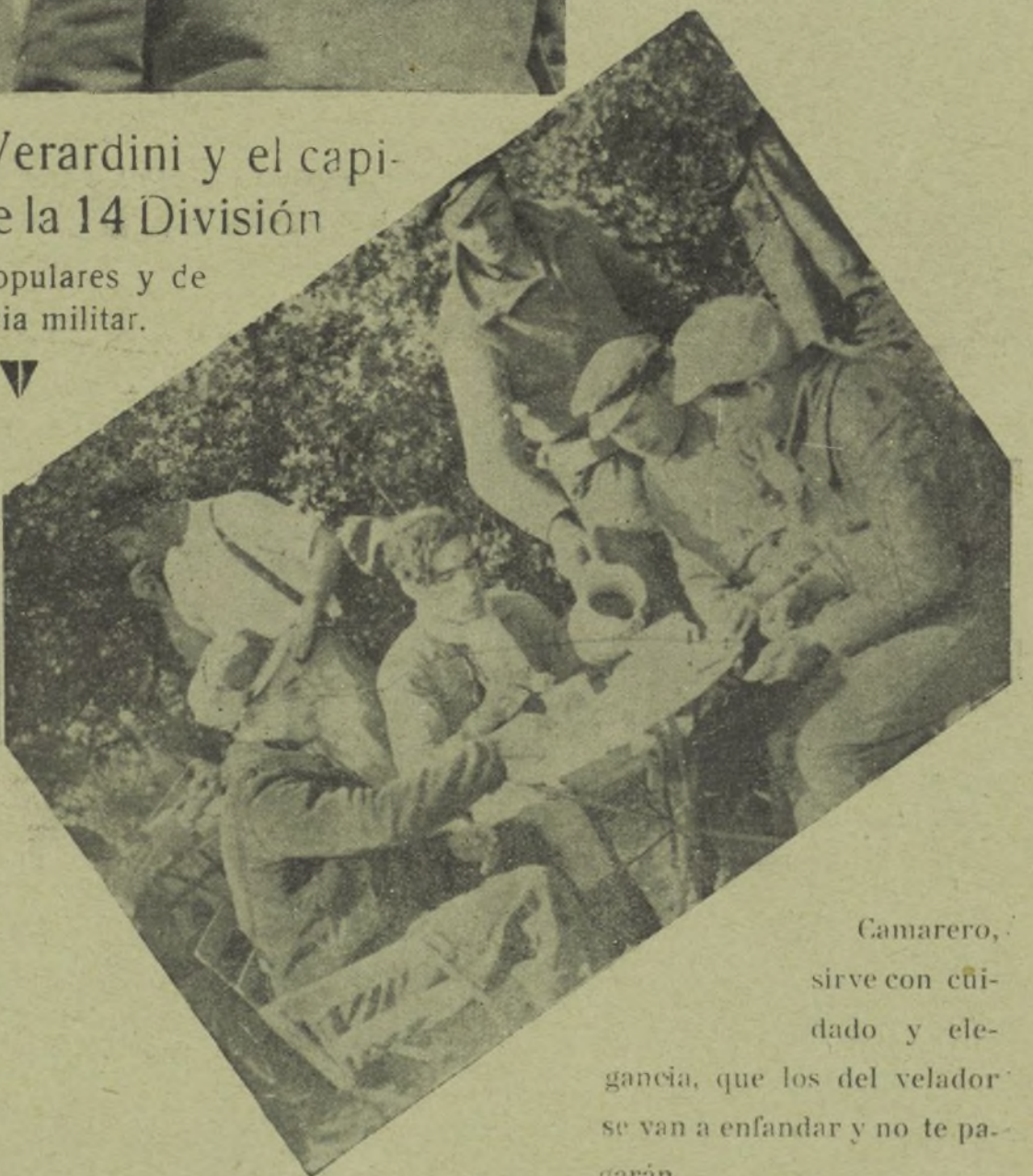
Camarero, sirve con cuidado y elegancia, que los del velador se van a enfandar y no te pagarán.