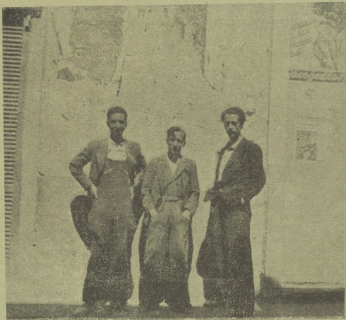
Artistas de retaguardia en los frentes de combate.