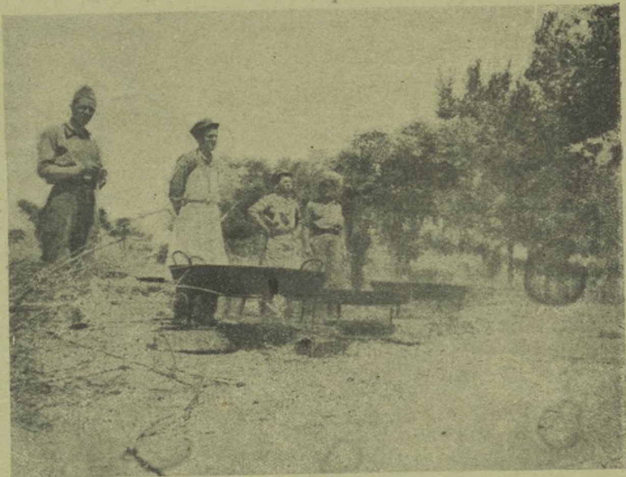
Los compañeros cocineros, vigilan el guiso para que resulte sabroso.