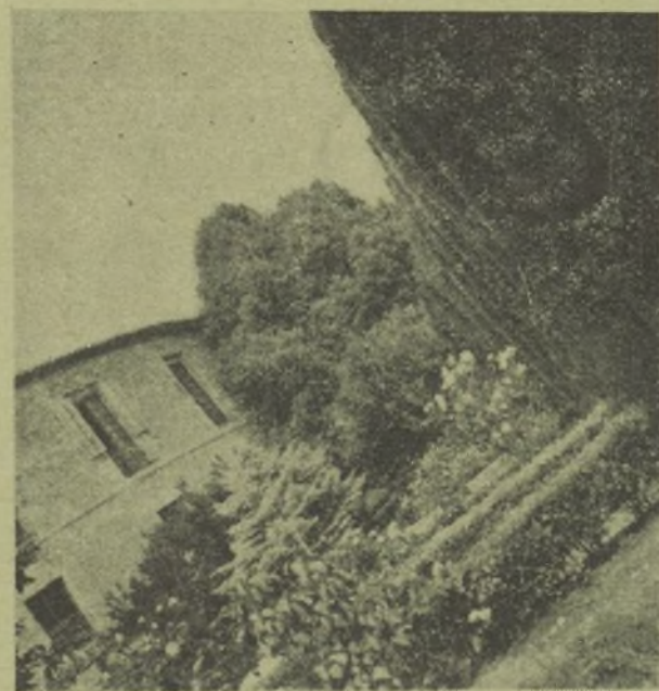
Otra vista de la sufrida población de Brihuega

Es gana de perder el tiempo en descifrar anticipadamente los problemas que no han de existir. Porque moral y materialmente, quienes han de señalar el camino a seguir por todo buen español, son los hombres del frente, ¿no son ellos quienes están dando la vida en holocausto de la LIBERTAD? Pues bien; si ellos son, nadie más que ellos por medio de individuos representantes y en acuerdo de sus respectivos Sindicatos, son los llamados a señalar el camino que se ha empezado con la presente guerra. Y nadie con más derecho que ellos. Desde luego incluyendo en mi opinión a los demás compañeros que en retaguardia, cada uno en puestos de-