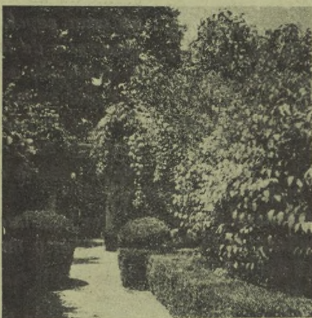
He aquí un magnífico paseo de los famosos jardines de Brihuega, hoy convertido en un agradable Hogar del Soldado.