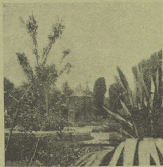
Una vista de los jardines de Brihuega.

turas que se le ofrecen al tener por enemigo a gobiernos vacilantes.