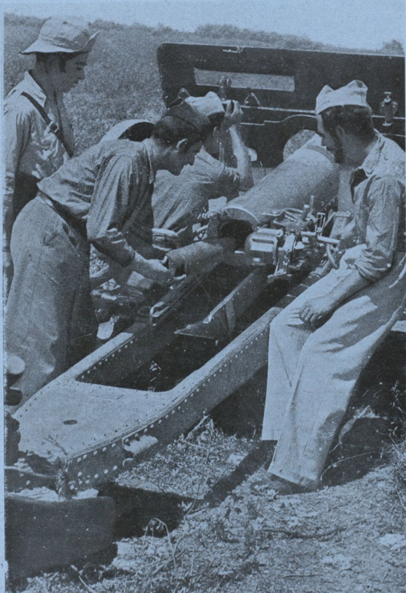
Nuestros artilleros durante el avance de nuestras tropas, la protegen con sus fuegos

En la defensa de España colaboran varias fuerzas antifascistas. Si estas fuerzas participaran en la responsabilidad del Gobierno, nuestra situación mejoraría considerablemente. El desplazar a cualquiera de ellas, significa debilitar el edificio en construcción de nuestra nueva España y llevar la desconfianza a muchos