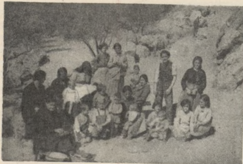
La aviación negra ha destruido sus hogares y ahora viven en cuevas en el campo.

en darte fiero se afanan. Tú, guitarra, en un rincón, no suelta la pedrería de sus notas de [cristal