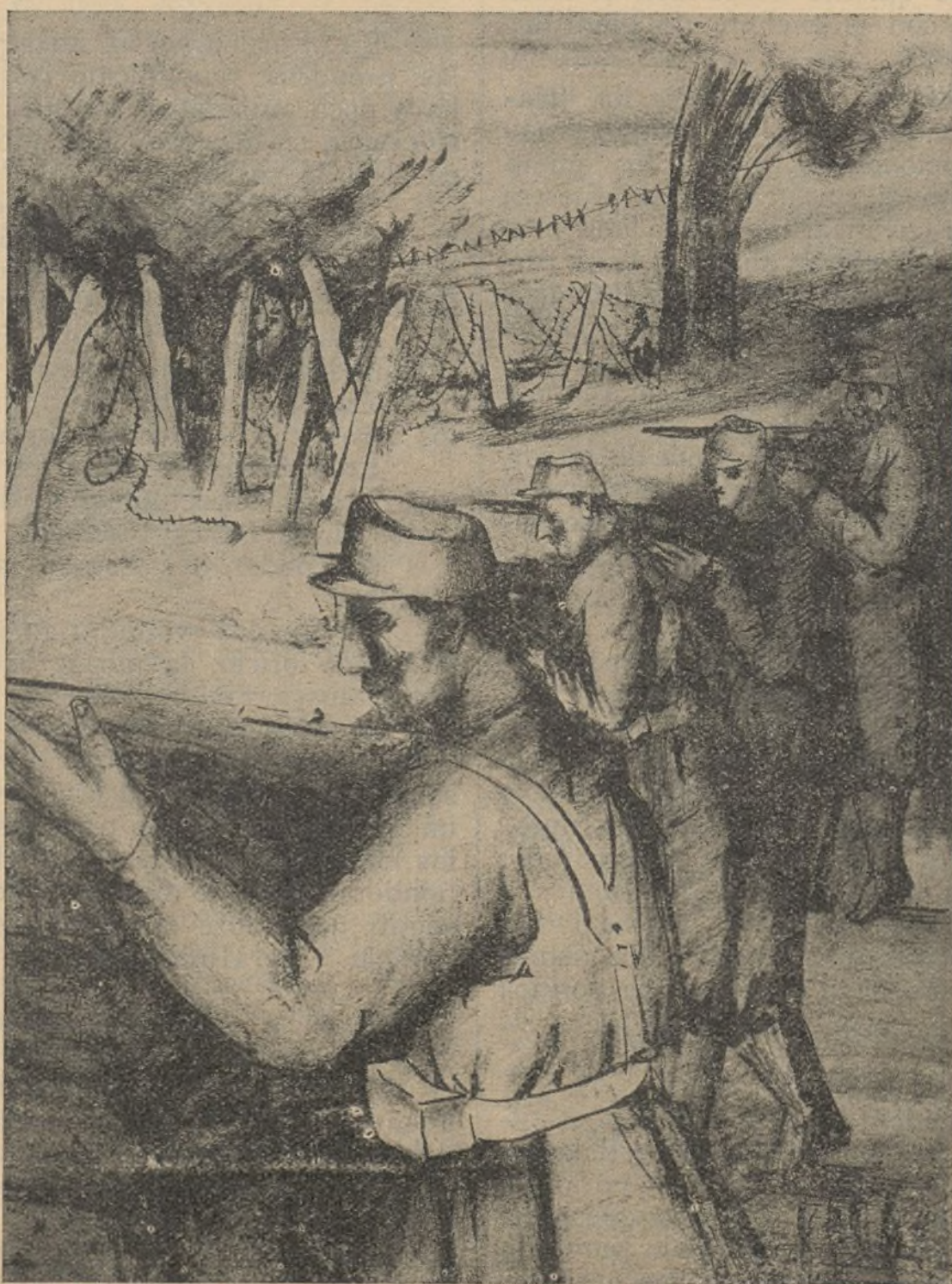
Como en Usera, en Rosales, en la Ciudad Universitaria, los milicianos de la Democracia, ojo avizor, escuchan y escudriñan el momento del ataque definitivo y de la definitiva victoria.