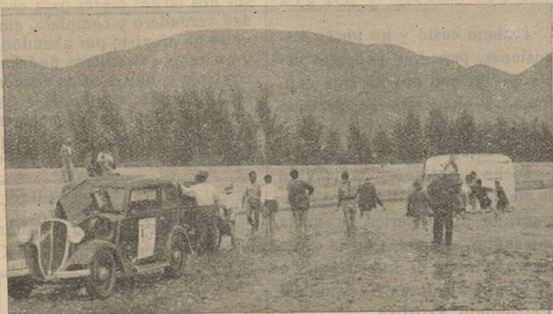
... tienen que vadear ríos...

—Se cuenta con un camión dotado de radio, micrófono y gramófono que se amplía con potentes altavoces. Lleva también este camión proyector de cine y una multicopista. Se han hecho viajes por los sectores de Toledo, Aranjuez, Somosierra, Guadarrama, Sigüenza..., etcétera. En los viajes de propaganda el equipo recorre las posiciones y parapetos dando charlas a los combatientes, repar-