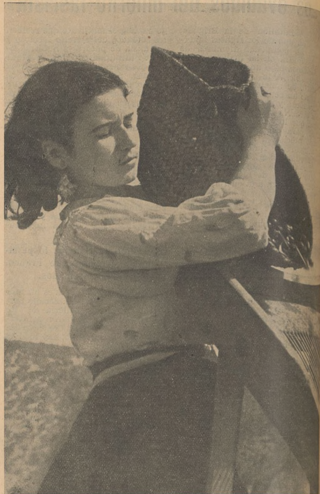
Limpiando aceituna al lado de la línea de fuego

(Del cuaderno de historietas de Oselito que próximamente será editado para las trincheras, por Altavoz del Frente Sur)