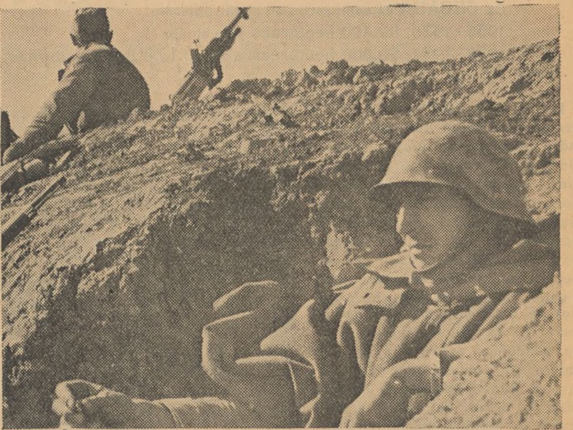
FRENTE DE ARAGON.—Un puesto de observación en uno de los sectores de dicho frente.