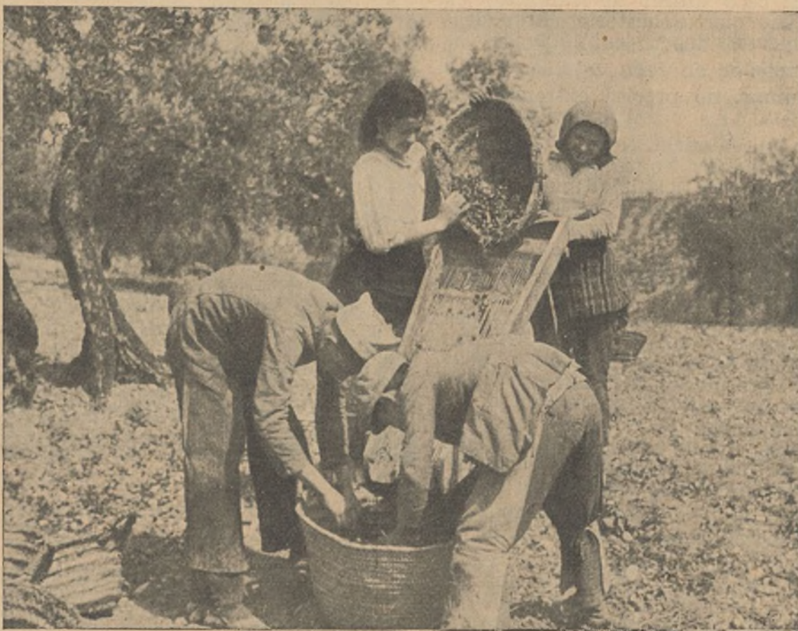
Todos trabajando por la victoria. Los pequeños en el campo mientras el padre y los mayores están en el frente

El campesino sabe que esta guerra fué provocada por sus peores enemigos, por los generales, los terratenientes y los banqueros, ayuda a ganar la guerra, pero es preciso que ayude aun más. Sembrando en las cunetas, como dice el Director de Agricultura, luchando en el frente porque lo que salga de esa siembra no nos lo roben los duques y marqueses que vivían del sudor y del hambre del campesino andaluz.