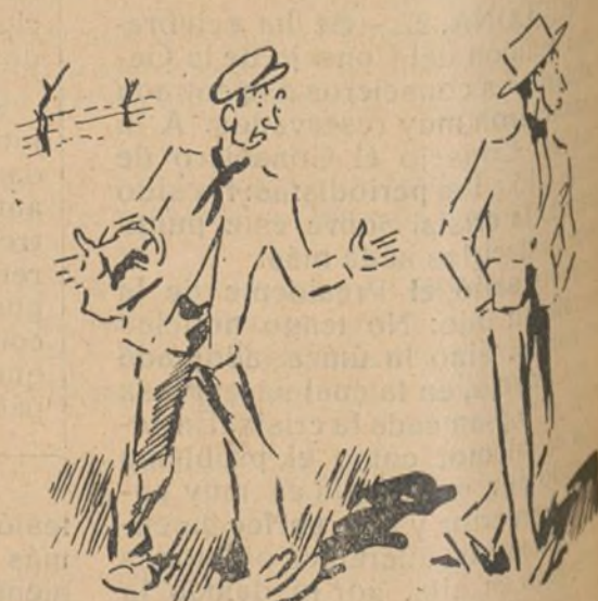
—¡Claro que si tropiesa con uno de la reforma agraria, no te quea más sarvasión que a las pata la máxima velocidad! Eso son los esabórios malajosos...