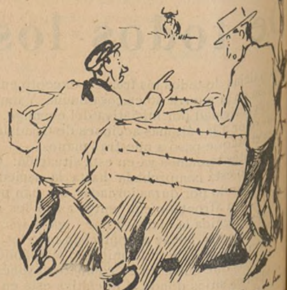
¡Te coja er Gallo en una mala tarde dijo Oselito. ¡Que bicho más malage! ¡Y no le llamai de la reforma agraria! ¿No te ha fijao, Osé de mi alma? ¡En nos ha visto a empesao a escarbá y a repa tierra!

(Del cuaderno de historietas de Oselito que próximamente será editado para las trincheras, por Altavoz del Frente Sur)