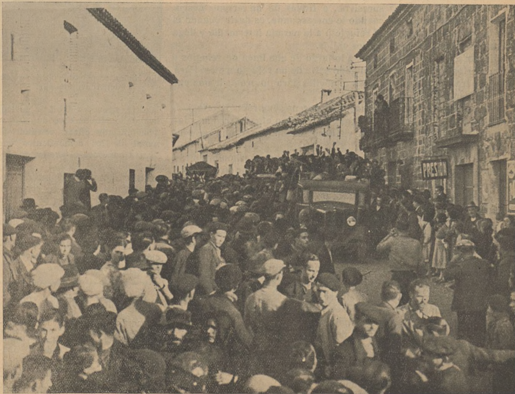
Los pueblos despiden entusiásticamente a los nuevos reclutas que marchan a unirse a millares de sus hermanos que desde hace tanto tiempo luchan por la independencia de España y el bienestar de todos

El Estado Mayor italo-alemán, da a las acciones en el Sur toda la importancia que tienen; de aquí su insistencia sobre el frente de Pozoblanco. Sin embargo, como hemos indicado en otra ocasión, no tendría nada de extraño que para compensar sus reveses en distintos frentes pensara en Andalucía y no precisamente por Pozoblanco. Atención en todos los frentes del Sur. En ellos nuestro ejército progresa por días; con una atenta vigilancia podemos malograr cualquier intento que, para compensar sus fracasos, iniciara el enemigo por alguno de nuestros frentes. La guerra en Andalucía puede entrar en una fase mucho más aguda que ha tenido hasta aquí.