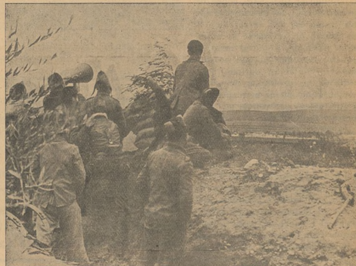
FRENTE DE CORDOBA.—Haciendo propaganda dedicada a los soldados del Ejército enemigo.