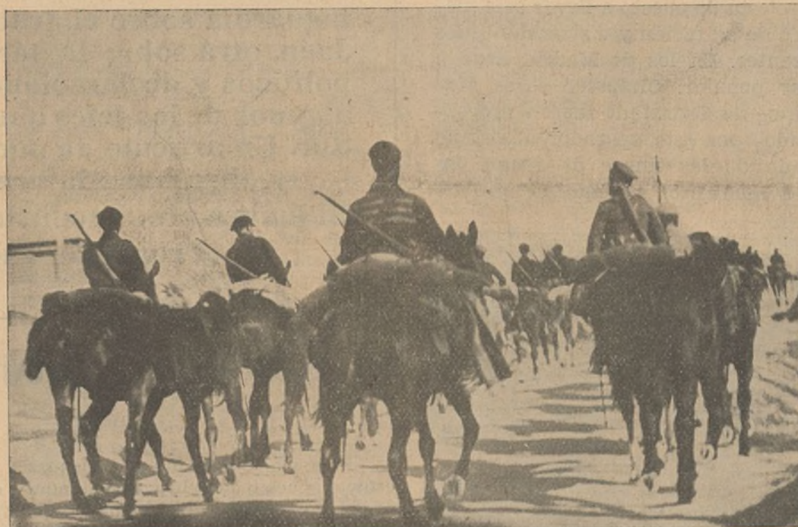
La caballería del Ejército Popular, marchando hacia el frente

Hasta este momento, nuestra situación ha ido mejorando en la medida que nuestra unidad ha sido más firme. Ante los próximos acontecimientos es preciso reforzar esta unidad. Agruparnos todos alrededor del gobierno de nuestro gobierno, dando de lado cuanto sea motivo de discrepancia, fortaleciendo la colaboración entre las organizaciones y partidos antifascistas con la única preocupación de hacer que los próximos ataques del enemigo se fustren ante la ofensiva arrolladora de nuestro ejército; procurando conseguir cada uno un primer puesto en el frente de lucha o en el de la producción.