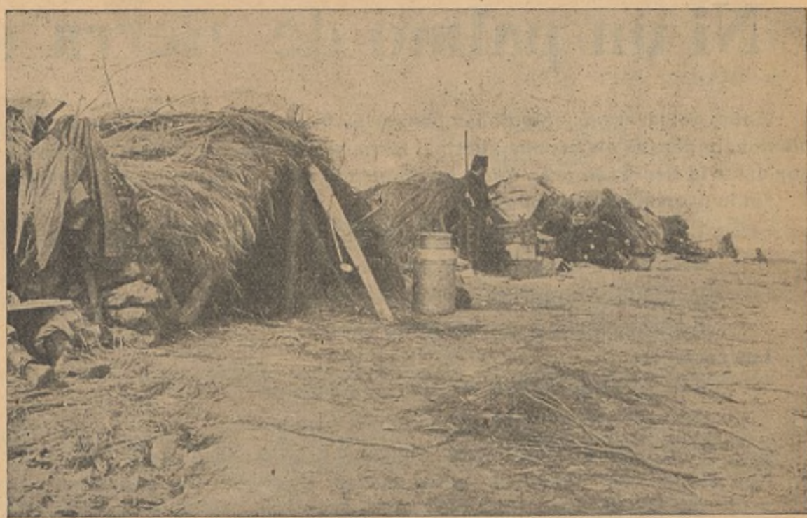
FRENTE DE GUADALAJARA.—Refugios de nuestros soldados.