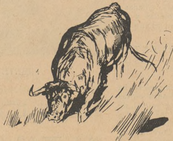
Efectivamente. A corta distancia de nuestros héroes, un hermoso toro negro bufaba inquieto arando la tierra con sus pezuñas.