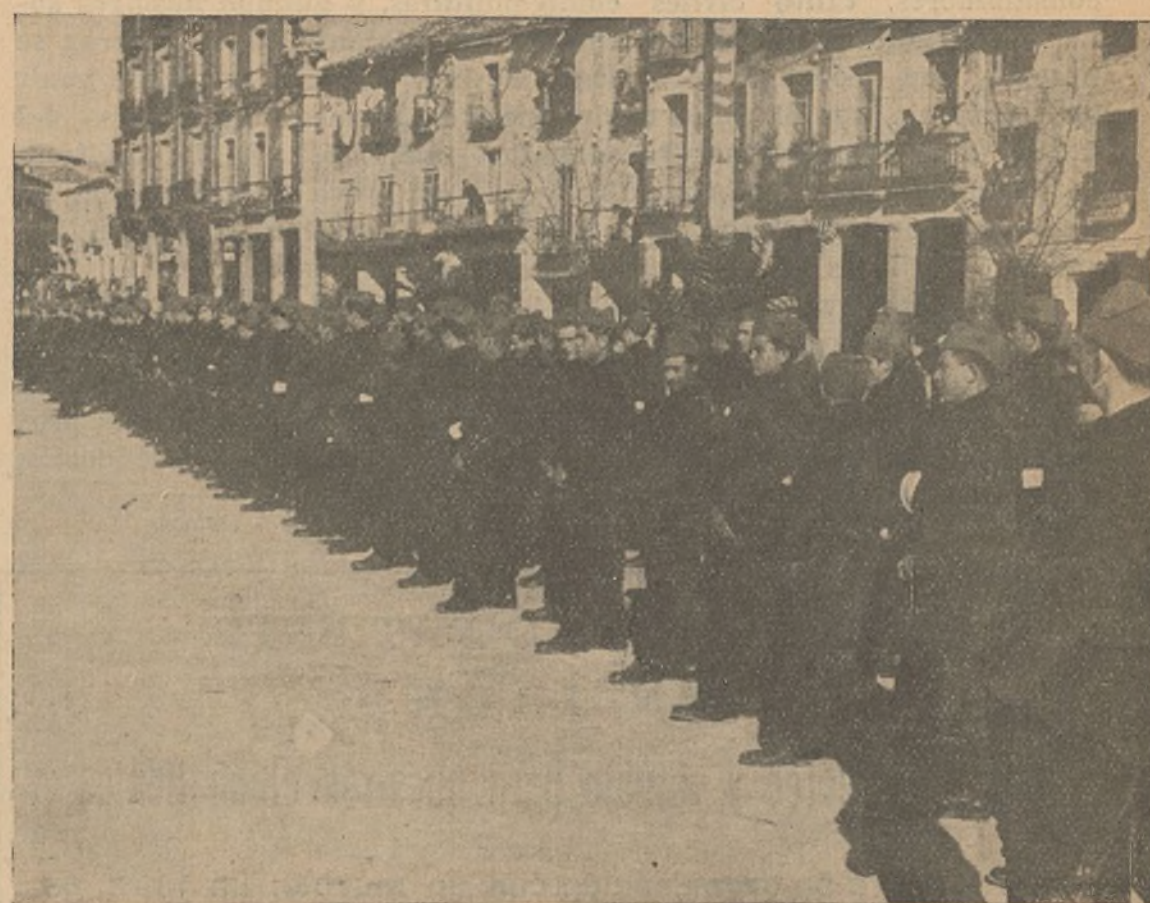
Los nuevos reclutas aprenden una instrucción militar completa

Emplear todas nuestras energías, todos nuestros ímpetus en conseguir la victoria es hacer posible la revolución. Todo el mundo sabe lo que se juega en esta lucha y ninguna acción de la retaguardia, por sugestiva que sea, es más elocuente para estimular a la lucha que la experiencia que, a través de los evadidos, nos ha llegado de lo que es el régimen fascista en las poblaciones que están bajo su poder. En tanto exista el peligro enorme de los ejércitos invasores, todo lo que no sea luchar para destruirlos es edificar sobre arena movediza.