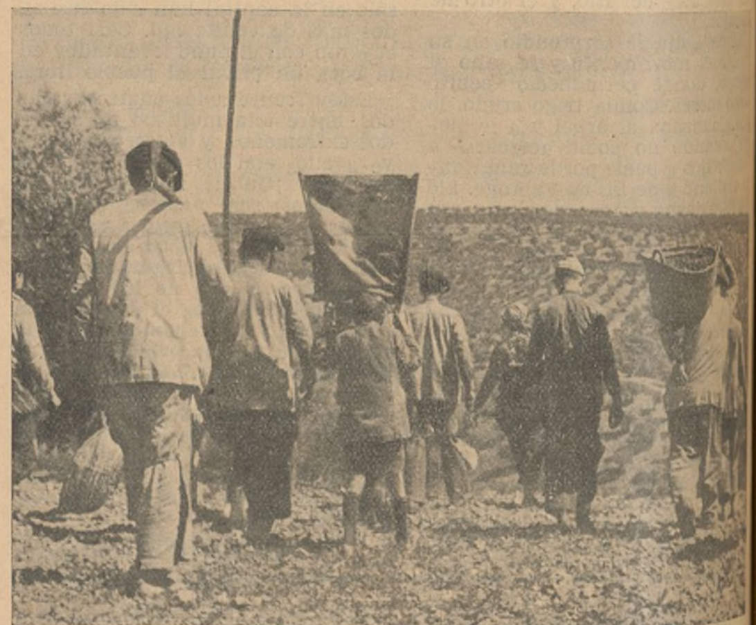
Equipos de aceituneros