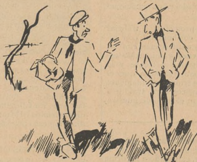
—Los toro, en er campo, no hasen ná. Pasa tranquilo por su láo y nó te miran.