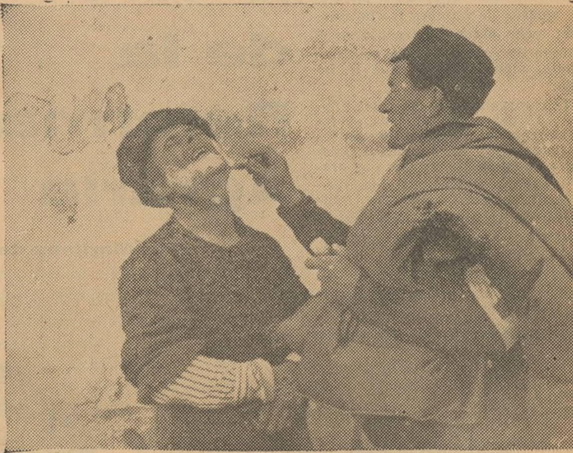
FRENTE DEL SUR.—Una barbería improvisada.