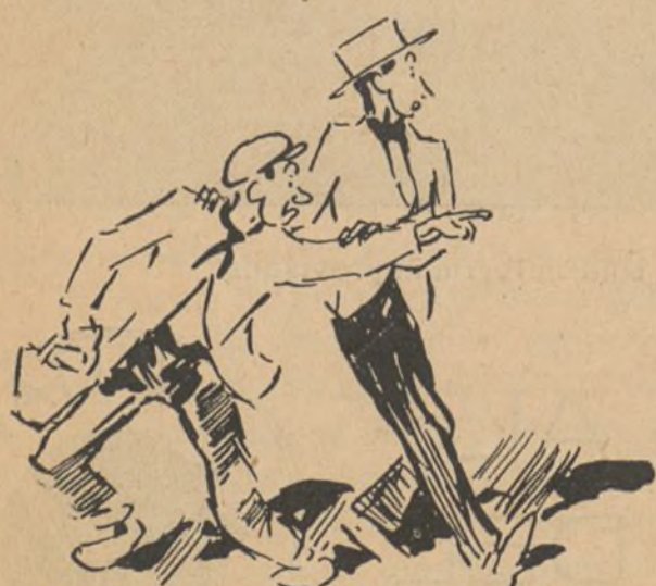
—¡Allí hay uno! ¡Corre Osé de mi alma!