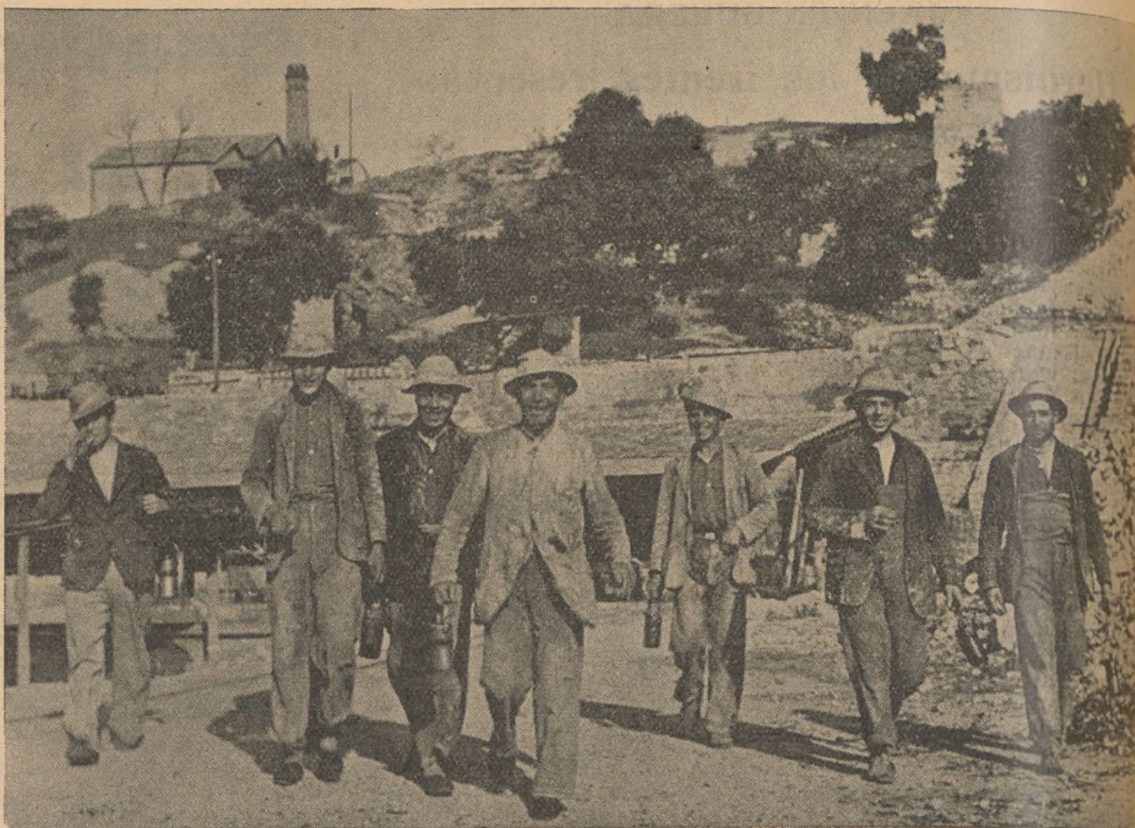
Los mineros se dirigen alegres al trabajo. Ya no existe la «empresa».