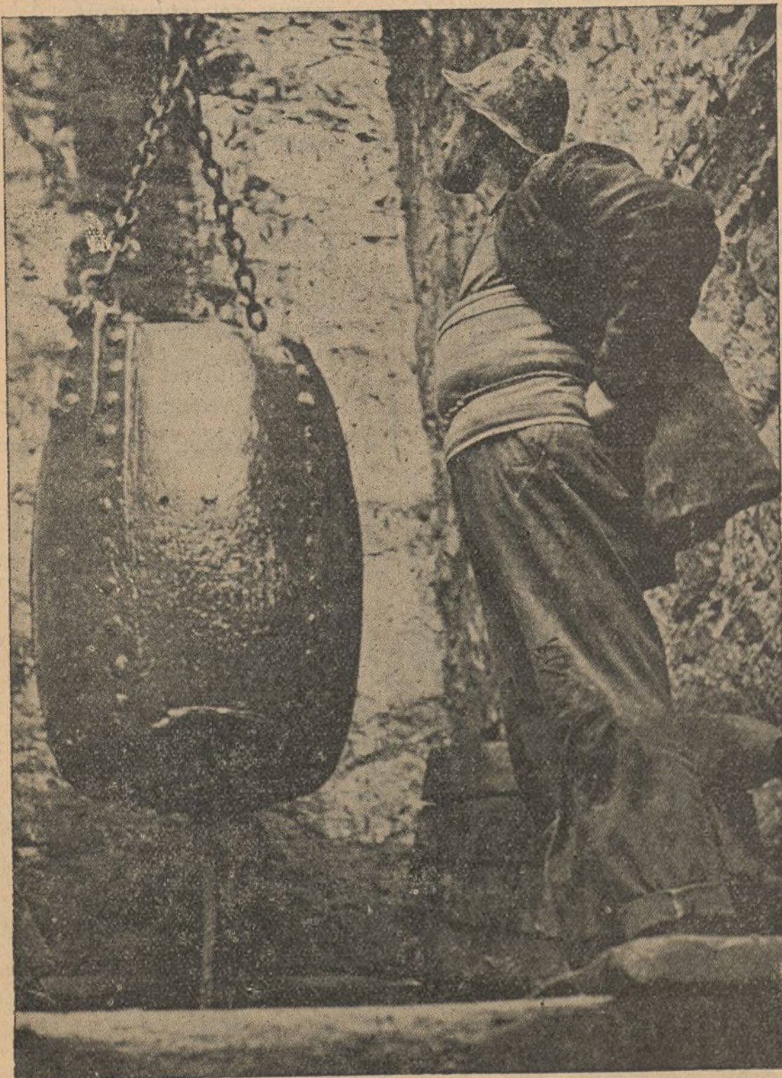
Ganada la guerra, minero de Linares, tu hijo no será, como tú, un condenado a la terrible enfermedad.