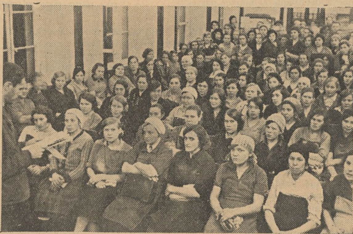
Reunión de obreras de una fábrica de la U. R. S. S. para acordar su ayuda a las madres españolas.

Al acto de la ejecución se le dió un gran aparato espectacular, sin duda para que sirviera de escarmiento; pero lo que se ha conseguido con esto es aumentar el descontento y la indignación, pues en todos los pechos vive la protesta sorda, que late a pesar del miedo al régimen de terror que los facciosos imponen y quizá no esté lejano el día en que aquella protesta y el murmurar en voz baja se trueque en actos que difícilmente podrán ser reprimidos.