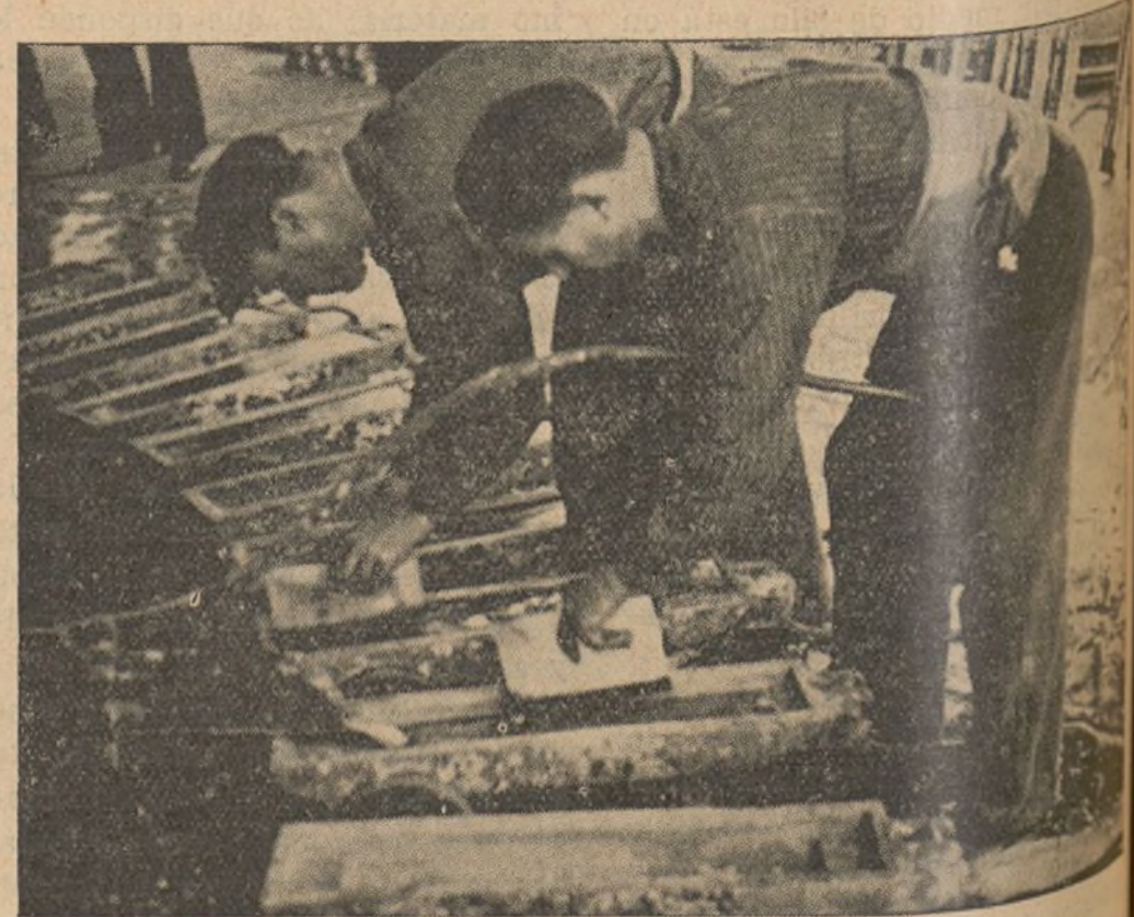
El metal dispuesto a ser enviado a la fábrica o para la exportación.