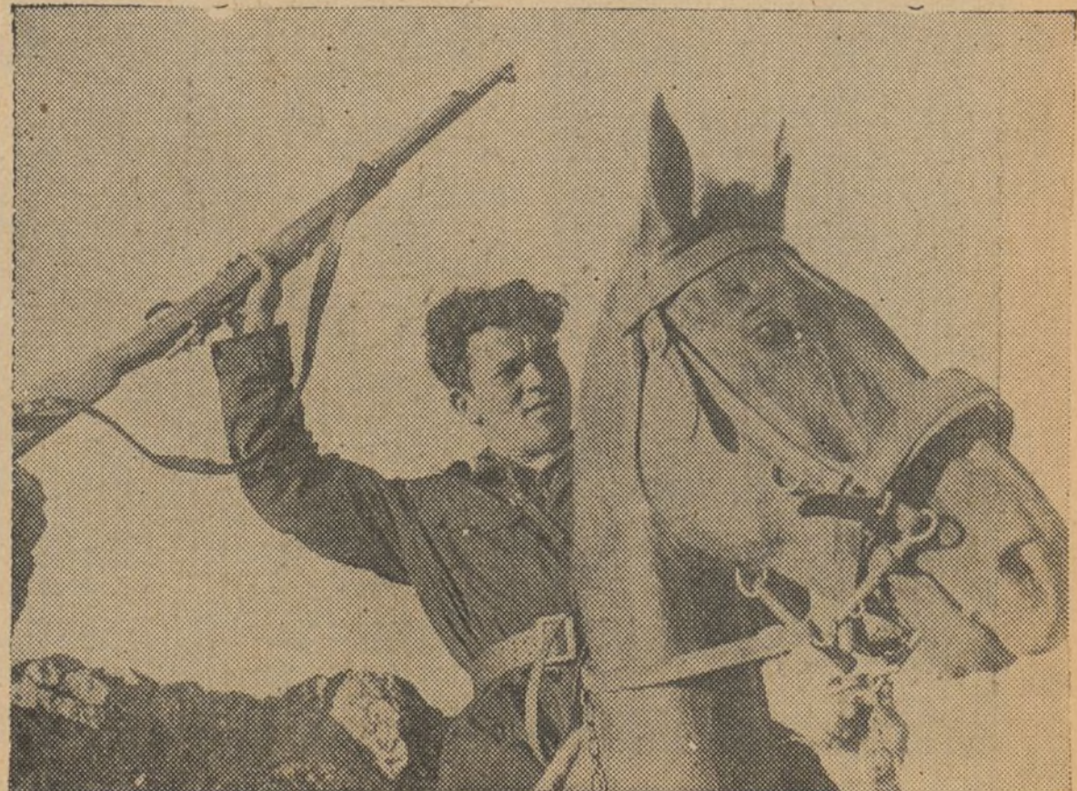
FRENTE DE EXTREMADURA — Un guerrillero

Roma, 31.- Se desmiente oficialmente la noticia según la cual Mussolini, en su viaje de ida a Libia, había dirigido desde el barco un telegrama a los voluntarios italianos que combaten en España animándoles a conseguir la victoria a toda costa. Todo el mundo sabe la veracidad que se puede conceder a las manifestaciones de Mussolini y la importancia que puede tener una rectificación de Berlín o Roma. En efecto, nadie ha hablado de un telegrama del duce a los voluntarios italianos que luchan en España, sencillamente porque no hay tales voluntarios. El telegrama de Mussolini ha sido dirigido a los soldados del ejército regular italiano que han invadido España, y a quienes la dictadura fascista bautizó con el nombre de legionarios, nombre que de ahora en adelante quiere significar voluntario contra su voluntad.