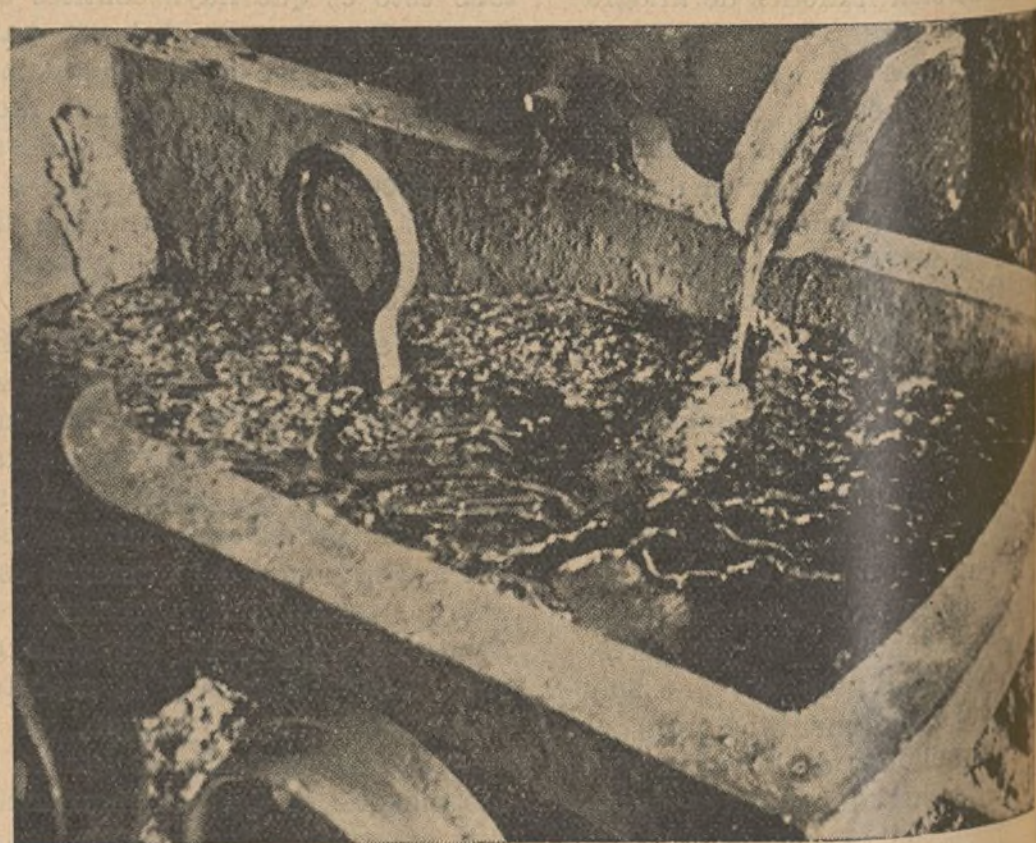
El plomo fundido, que vale millones al Gobierno de la República.