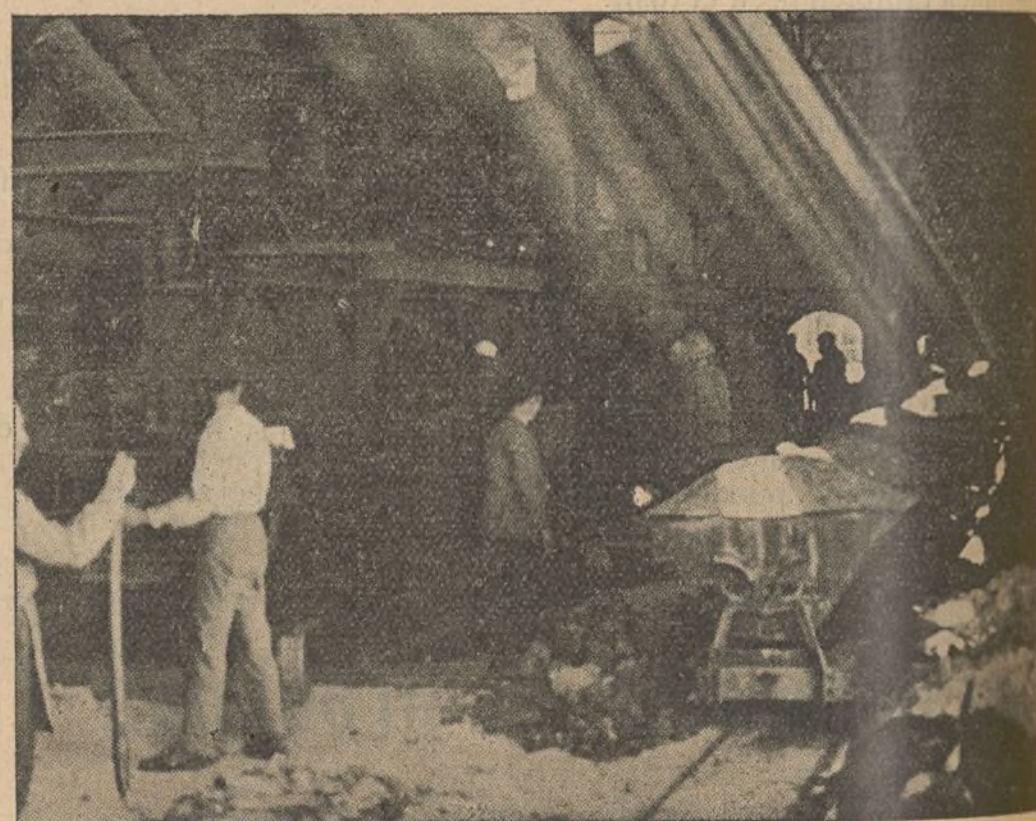
En las entrañas de la tierra sacan el plomo para las balas que emplea el Ejército del pueblo.

París, 31.—Los periódicos de hoy dan noticias recibidas de Gibraltar según las cuales han llegado a Tanger numerosos viajeros dando detalles sobre el descubrimiento del complot en Tetuán. Afirman que han sido fusilados cien individuos entre oficiales y soldados pertenecientes en su mayoría al Cuerpo de Aviación. Créese que un cocinero árabe ha sido quien denunció la conspiración a las autoridades. El periódico "Loeuvre" dice que el delator fué un aviador italiano del servicio de información. La causa del complot obedece a que las fuerzas de Franco llevan bastante tiempo sin cobrar sus haberes.