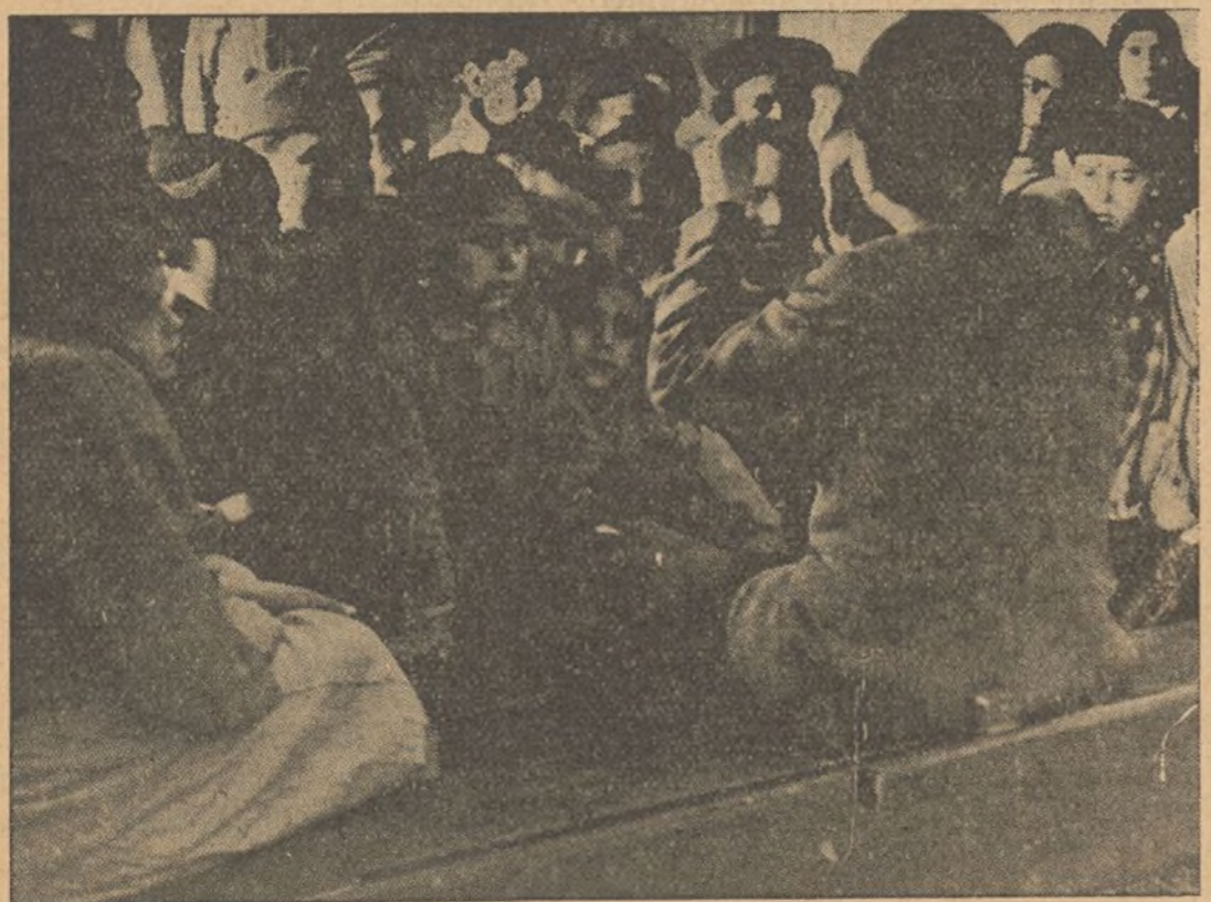
En la retaguardia, mientras la guerra se desarrolla, reciben con alborozo las noticias de los triunfos de sus padres