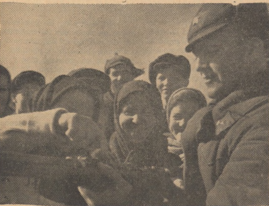
Un soldado del Ejército Rojo, enseña el manejo del fusil a unas campesinas de un pueblo de la U. R. S. S.

Grita la madre al niño: —¡Niño, vente a la casa! El niño corre y corre con su risita clara.