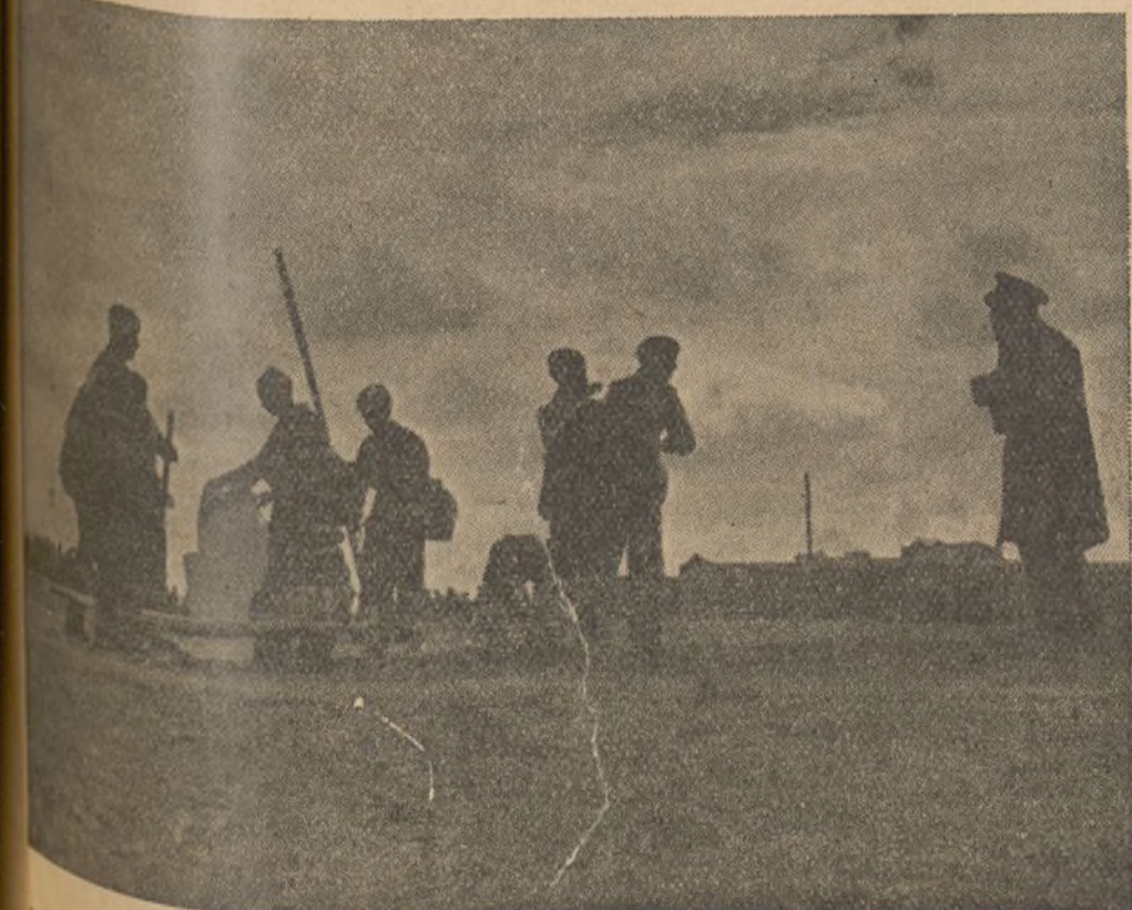
Los heroicos camilleros del Ejército Popular que con arrojo y heroísmo cumplen su trabajo en los puestos de más peligro de todos los frentes

Hay, pues, que desarrollar intensamente esta corriente de evadidos a nuestras filas, que cada día aumenta. Facilitarles por medio de propaganda oral y escrita los ánimos para ello y en ocasiones los medios de que se pueden valer. Altavoz del Frente Sur, respondiendo a esta necesidad, y para facilitar este trabajo, está intensificando la preparación de medios para ella. Preguntá por los grandes altavoces transportables, que son de gran utilidad para distancias más cortas, cohetes para lanzarlas, etc.