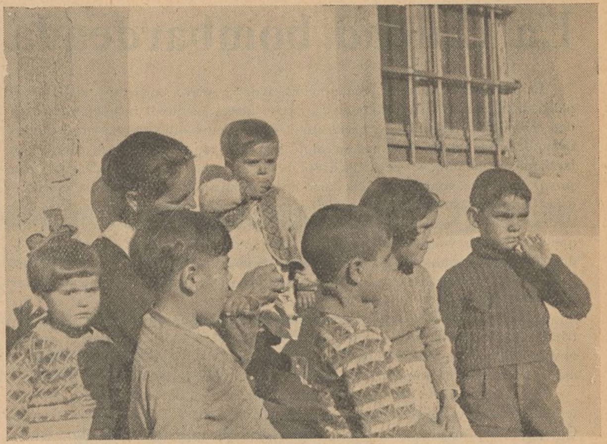
Los niños y mujeres de los pueblos conquistados por la República, reflejan en sus caras la satisfacción de la convivencia con nuestras tropas