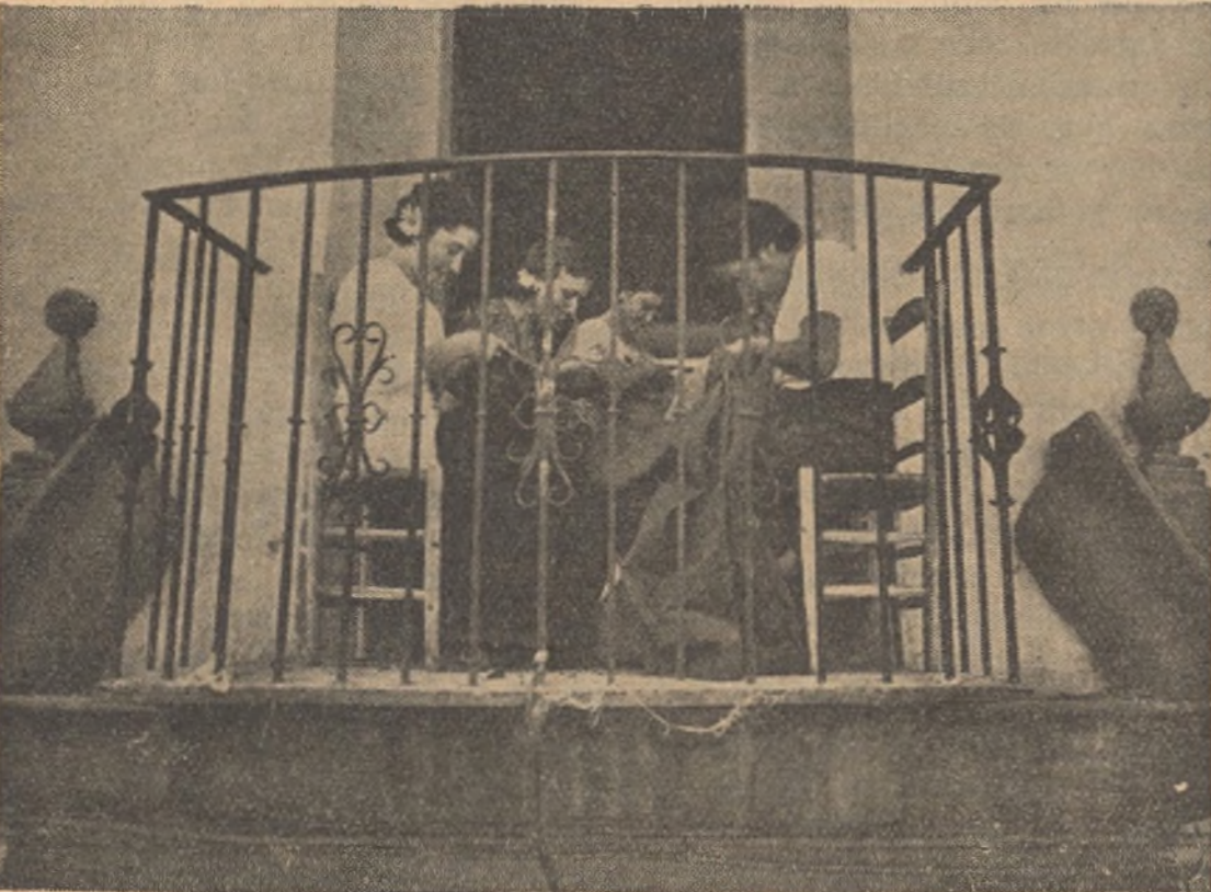
En un pueblo andaluz estas muchachas antifascistas trabajan también para la guerra. Cosen para los soldados que con las armas defienden las libertades del pueblo.