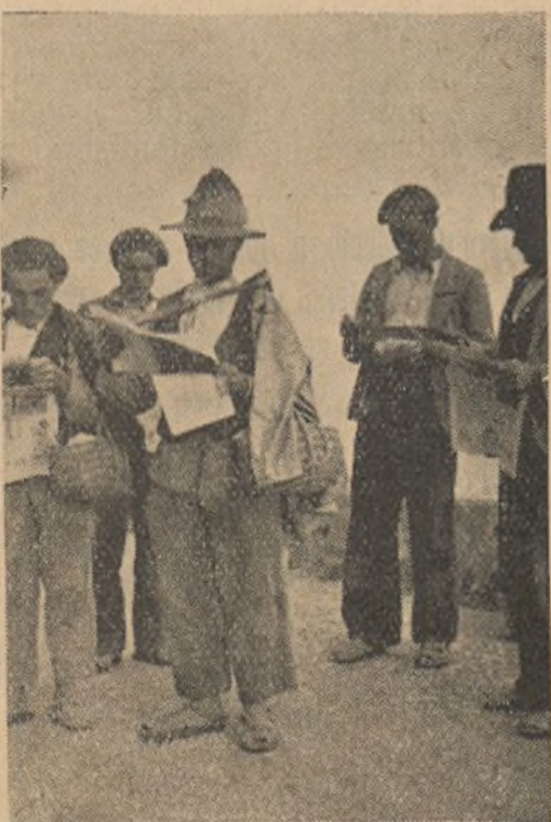
Campesinos de la Costa de Almería llevan FRENTE SUR