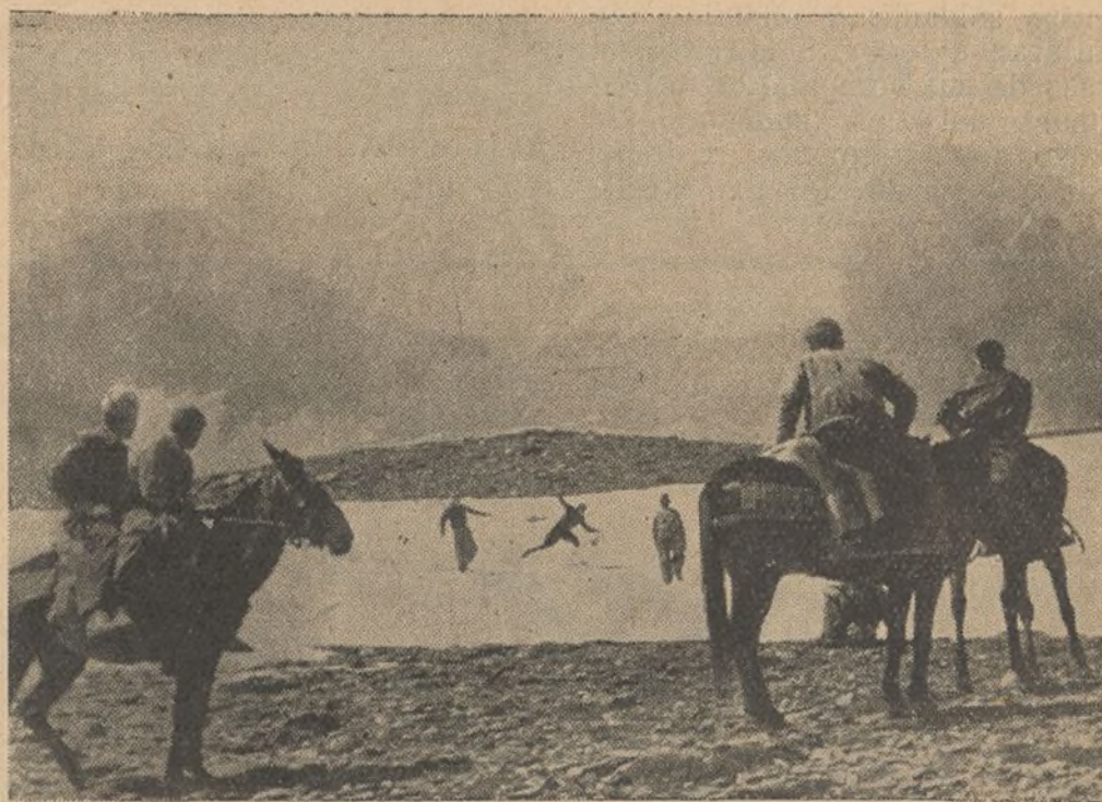
FRENTE DE GRANADA.—En los ratos libres la nieve es un buen medio para divertirse