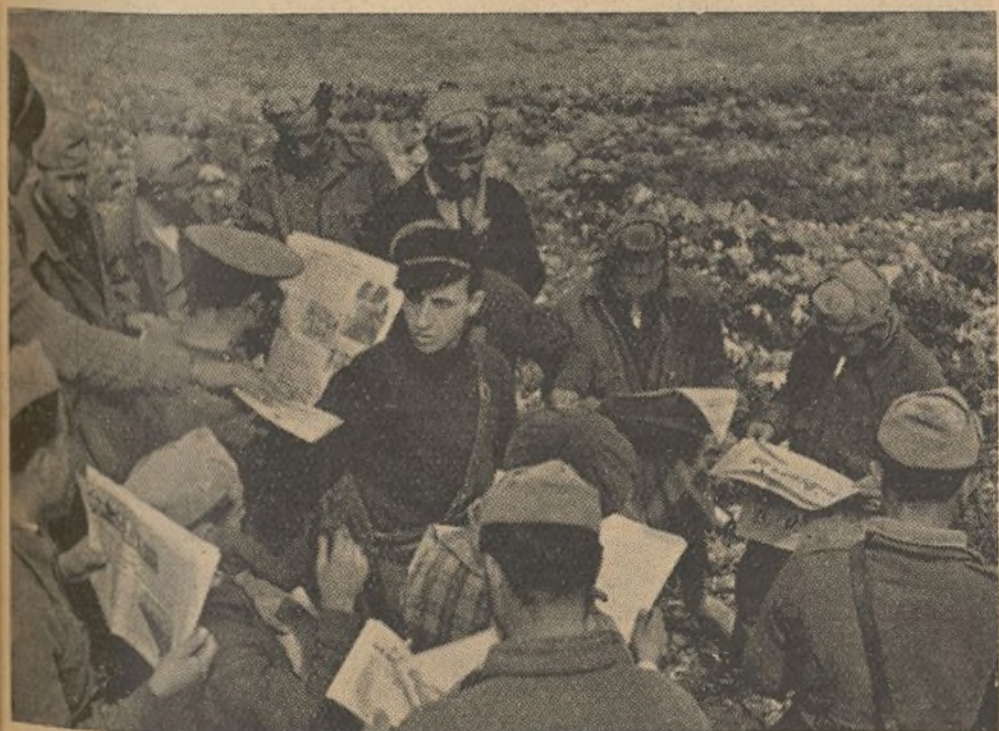
En las mismas posiciones, el Comisario reparte prensa y folletos. Después aclara y explica a los soldados lo que necesitan