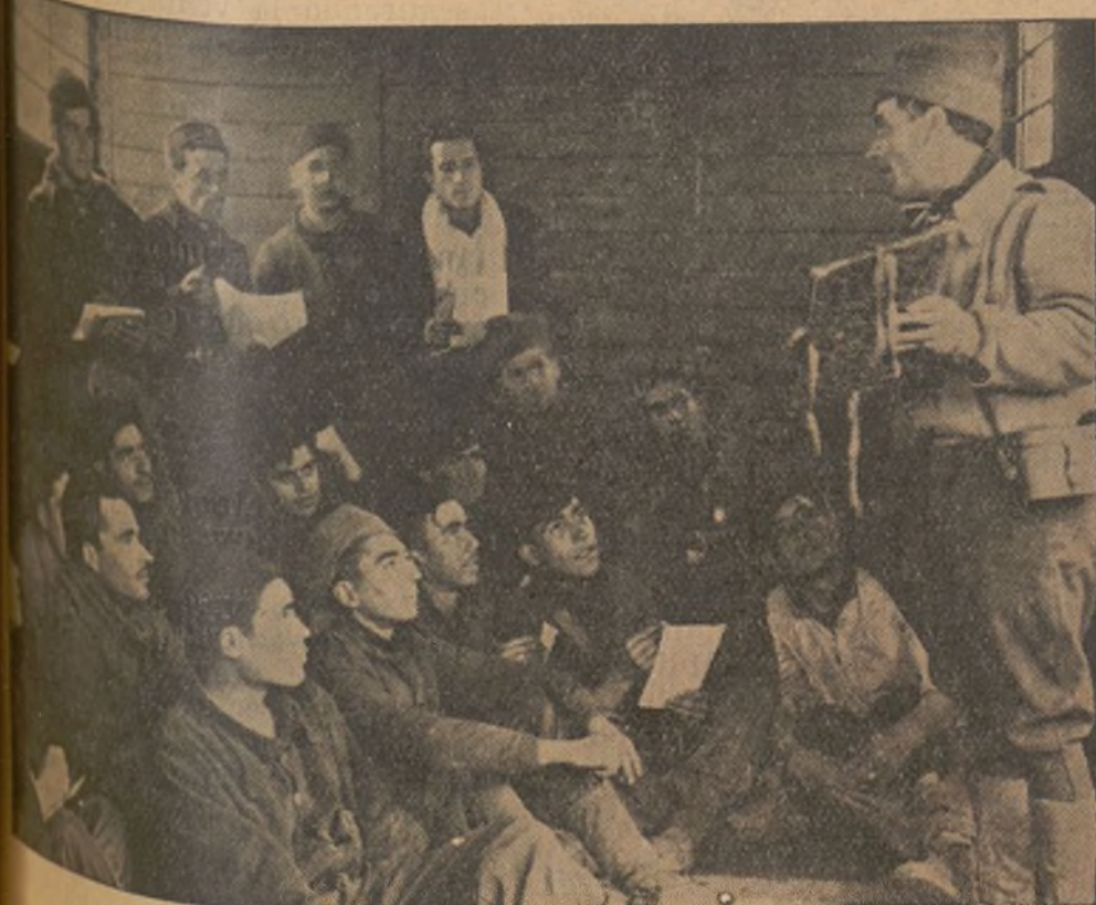
En los frentes y utilizando hasta vagones de ferrocarril, los Comisarios organizan clases para los soldados