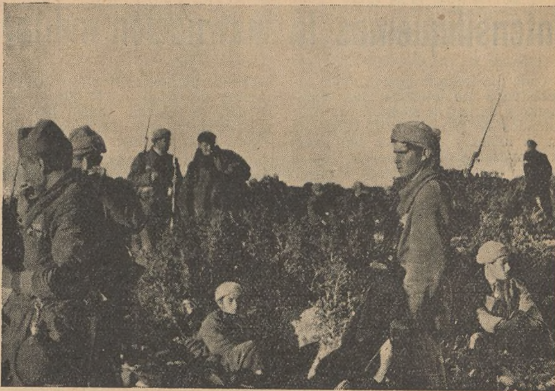
FRENTE DEL CENTRO.—Una posición en la Sierra.