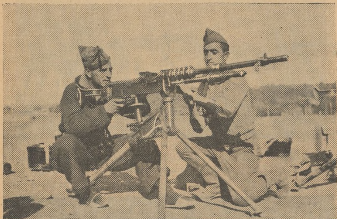
En los ratos que los combates les dejan libres, los soldados se perfeccionan en el manejo de toda clase de armas

INSTRUCCION MILITAR EN EL FRENTE Y LA RETAGUARDIA. TODOS A PREPARARNOS MILITARMENTE.