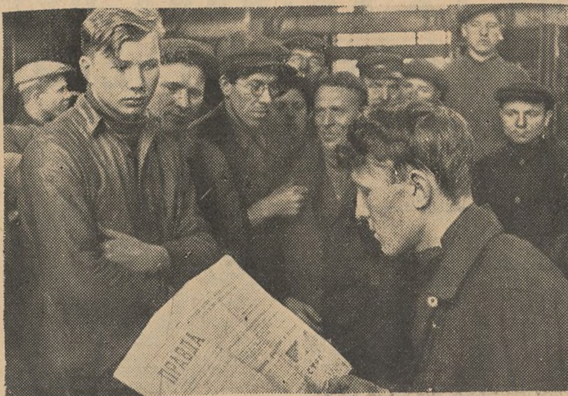
Obreros de una fábrica en la Unión Soviética, leen y comentan la marcha de nuestra guerra

Tampoco nuestra minería de combustibles ha alcanzado hasta ahora toda la amplitud que exige una ordenada investigación para llegar al conocimiento perfecto de todas las zonas de riqueza y de sus condiciones de explotación, y sin embargo, la extensión de terreno carbonífero es de 10.674 kilómetros cuadrados. La producción es de más de 4.000.000 de toneladas de las que 3.600.000 aproximadamente son de hulla; 200.000 de lignito y el resto de antracita.