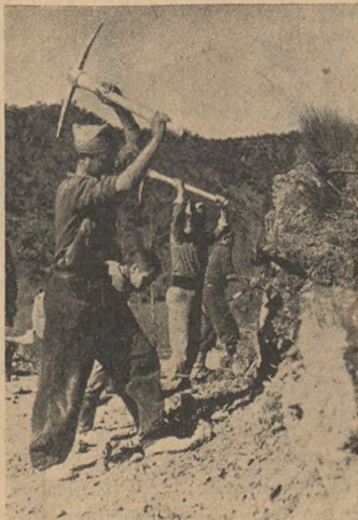
SECTOR DE GRANADA. Haciendo caminos de acceso a posiciones recientemente conquistadas

¡Los toros! ¡Los toros! Todo el pueblo entendió ¡los moros! y el pueblo volvió a quedar vacío.