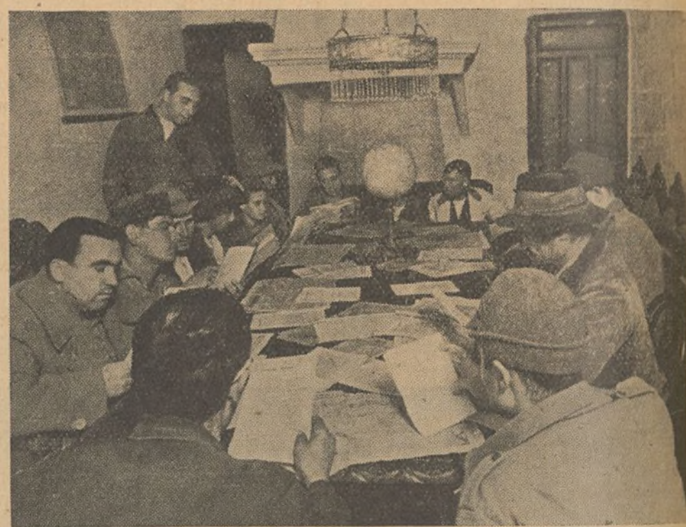
En los pueblos de las sierras de Granada, próximos a la línea de fuego y por iniciativa del Comisario, se han creado casas del combatiente adonde acuden los soldados y los campesinos

—Todos debemos ayudar con entusiasmo a esta labor de crear y perfeccionar las Casas del Combatiente, tarea a la que presta un especial cuidado AL TAVOZ DEL FRENTE SUR.