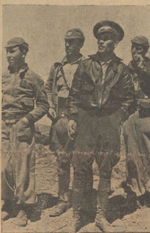
El Jefe militar y el Comisario, juntos en el transcurso de las operaciones, son garantía de eficacia y disciplina

En el triunfo definitivo, que cada día vemos aproximarse más por la acción de nuestro gran Ejército Popular, un puesto preeminente y de honor tendrán los Comisarios, que seguirán siendo, y cada día más, alma y razón de nuestro ejército del pueblo.