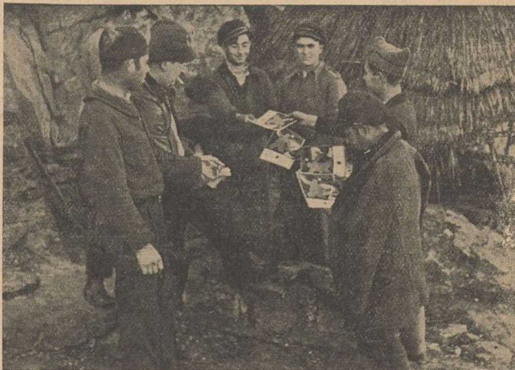
FRENTE DE EXTREMADURA.—En el frente de Medellín (Badajoz), nuestros soldados reciben folletos de Altavoz del Frente.