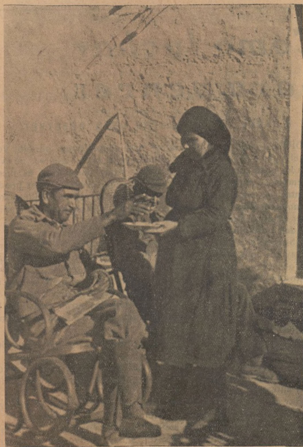
El Comisario atento a todas las necesidades de sus fuerzas, crea casas de reposo en los pueblos cercanos a las posiciones más avanzadas. Atendidos por las propias muchachas de los pueblos, reponen las fuerzas que gastaron en la lucha

En el Sur el enemigo atacó algunas de nuestras posiciones del sector de Pozoblanco, siendo rechazado, habiéndoseles cogido prisioneros. En Fuenteovejuna han sido tomadas al enemigo las importantes posiciones de Chimorra y Santa Bárbara.