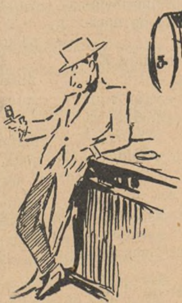
—¿Que te gusta er vino, Osé! ¡Mardita sea los moro...! ¡Si no lo cobraran!