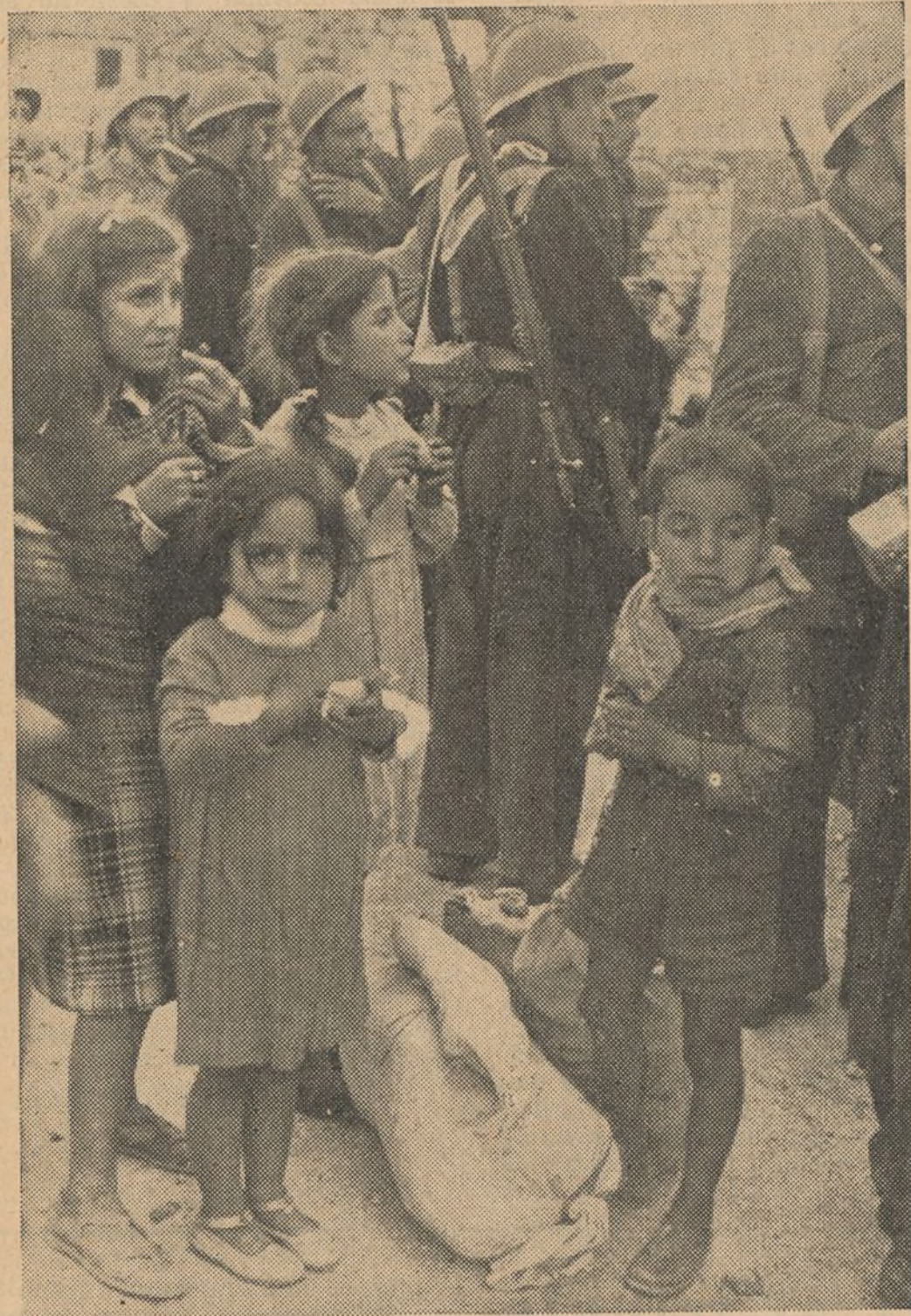
Los niños cautivos en el Santuario de la Cabeza, fueron atendidos desde los primeros momentos, por los soldados del Ejército Popular

Bastante antes de haber sido conquistado por las tropas leales a la República el Santuario de la Virgen de la Cabeza, en la prensa de Berlín apareció la noticia de que los "rojos" habían pasado a cuchillo y cometido toda clase de atrocidades con los que allí se encontraban sin haber dejado ni a las mujeres ni a los niños. Después de haberse conquistado—y no es que se hayan entregado voluntariamente, ni mucho menos, sino que nos han causado muchas bajas en la fuerte defensa que hicieron—también ahora sigue explotándose por los facciosos, ya que no pueden hacer otra cosa, la mentira de que nos hemos ensañado con los que ocupaban el Santuario. Esto prueba el carácter de bulo y de cosa preparada de tal campaña, contra la cual podemos nosotros presentar al mundo prue-