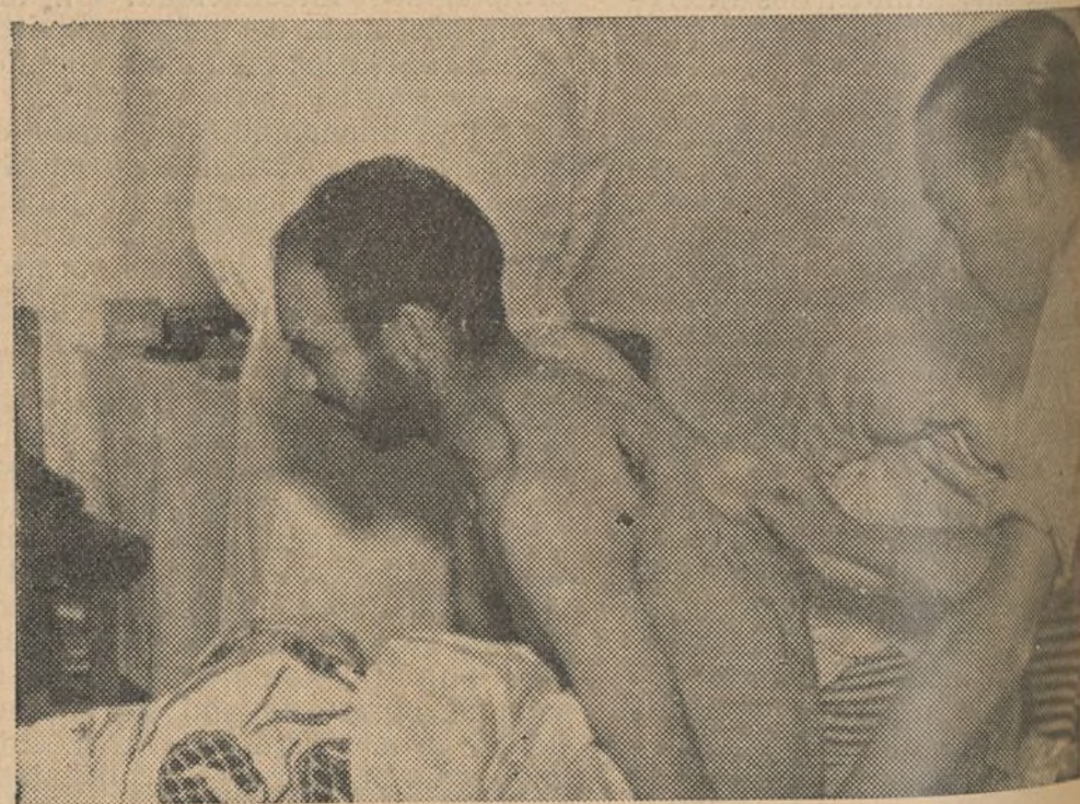
En el hospital de Andújar se cura a los prisioneros heridos, poco después de haber sido tomado el Santuario de la Cabeza

¡No desmayéis! No está lejano el día en que Sevilla se unirá a Madrid y Barcelona a La Coruña. Será el día de la Victoria definitiva, de la unión de todos los españoles. Será el día cuando los generales traidores pagarán con su vida el crimen contra la patria, y los extranjeros huirán ante la indignación de España.