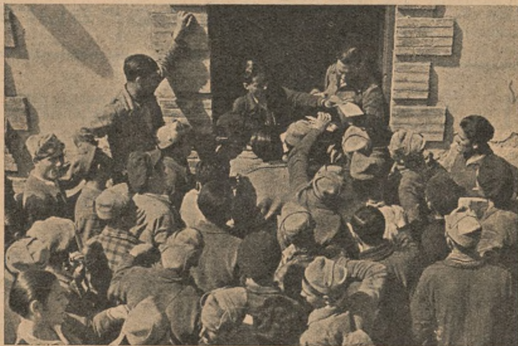
La hora del correo. Todos esperan con emoción que se vocee su nombre