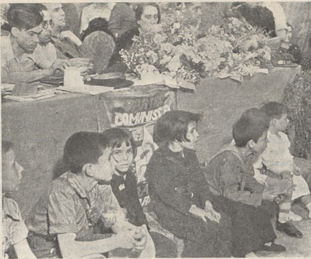
No podían faltar tampoco los pioneros; con gran atención escuchan el informe general que es el arma política para vencer al fascismo

Nosotros tenemos que crear una Agricultura fuerte y una potente industria de guerra. Nuestra Agricultura, el trabajo de los campesinos, es un trabajo de guerra y el Gobierno está dispuesto a que se respete la voluntad de los trabajadores en el campo, a que en el campo se produzca cuanto sea posible para que en nuestros frentes haya pan y en nuestra retaguardia también. A un Gobierno, compañeros, apoyado por el sentir del pueblo que va plasmando en realidad todo cuanto el pueblo quiere, hay que defenderle. Mucha atención, compañeros, al Gobierno. Y aquellos que tratan de poner obstáculos, frente a esos obstáculos, frente a esos embates, vosotros, miembros de nues-