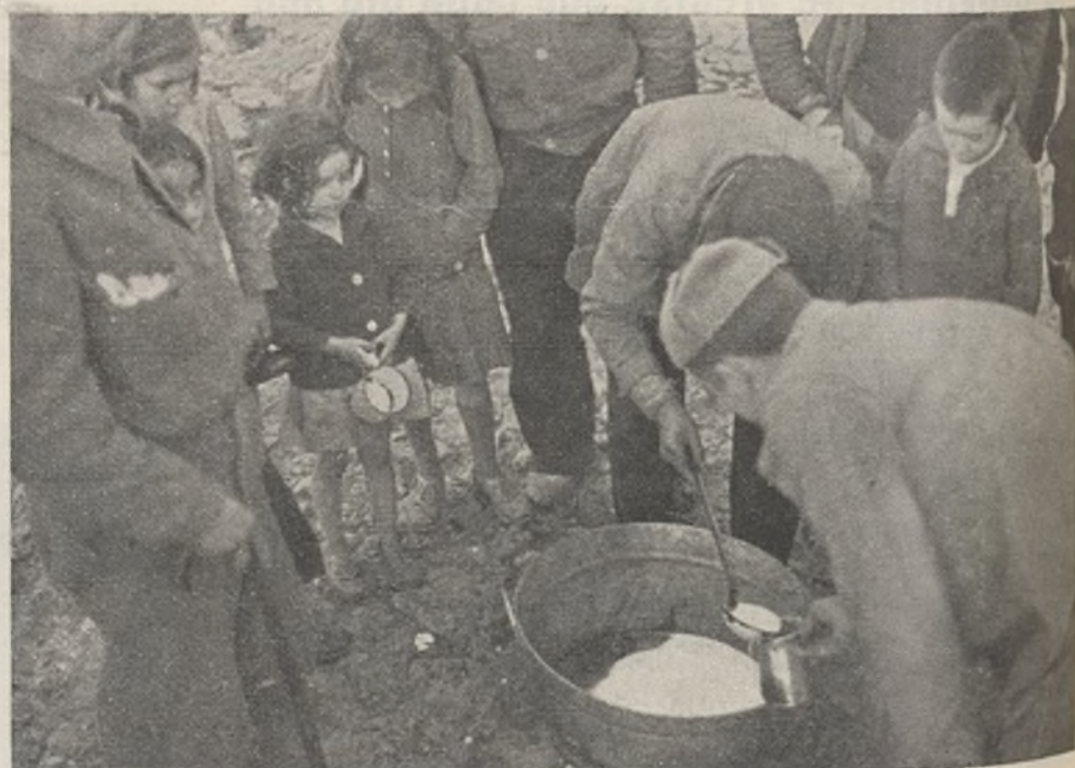
Tan pronto como las fuerzas del Ejército Popular ocupan un pueblo, dan leche a los niños hambrientos