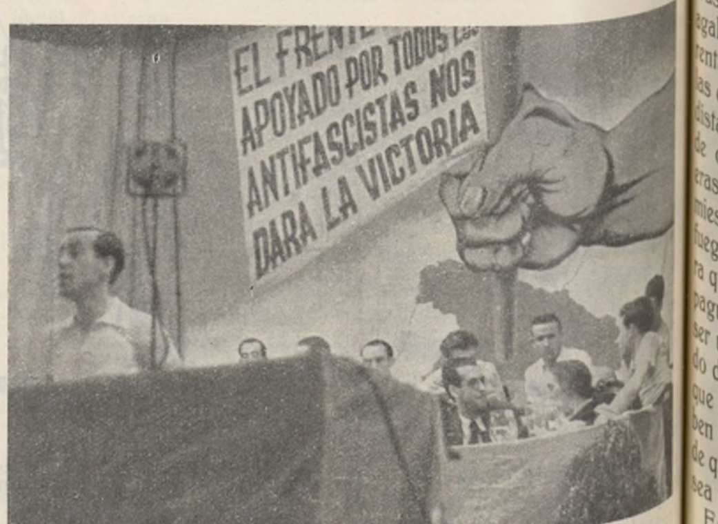
El camarada Pérez marca la línea que nuestro Partido ha de seguir de ayuda a la juventud