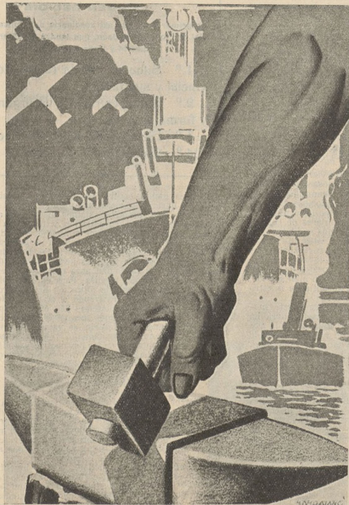
Por una potente industria de guerra, para que nuestros combatientes no carezcan de material bélico

Los periódicos han publicado una nota oficiosa de las autoridades tratando de explicar el suceso presentándolo como una simple descomposición a causa del calor reinante de una carga de cilindros de ácido carbónico, aire comprimido y carburo. Pero lo cierto es que las verdaderas causas han sido el que la consignación de municiones destinadas a Franco fueron conducidas a la estación como mercancías generales completamente inofensivas y como tales fueron tratadas al verificarse la carga originándose entonces la tremenda catástrofe.