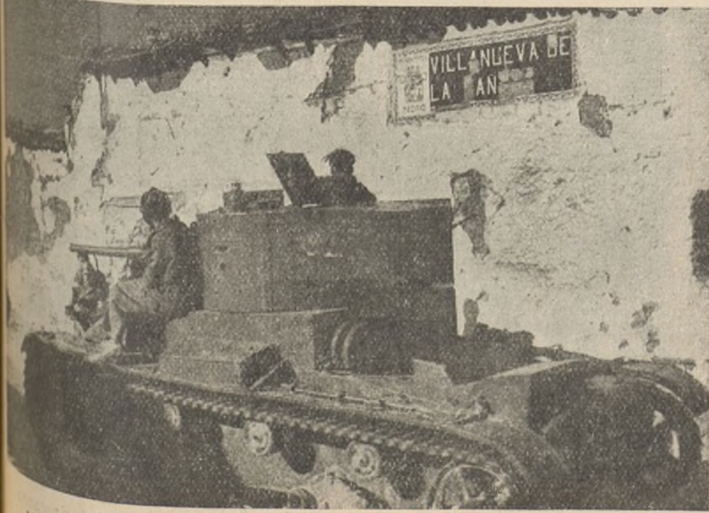
Nuestros tanques cooperan en la toma de Villanueva de la Cañada

La voz del Gobierno y del pueblo español debe llegar a todos los rincones de los frentes y de las ciudades fascistas. Tenemos que acercar ese instante en que toda la España nazi reproduzca sucesos como los de Toledo, Motril y Granada. El instante en que los millones de hombres vigilados por la "Gestapo", los hermanos de los asesinados por el fascismo, tiendan sus manos vigorosas hacia la bandera de la República.