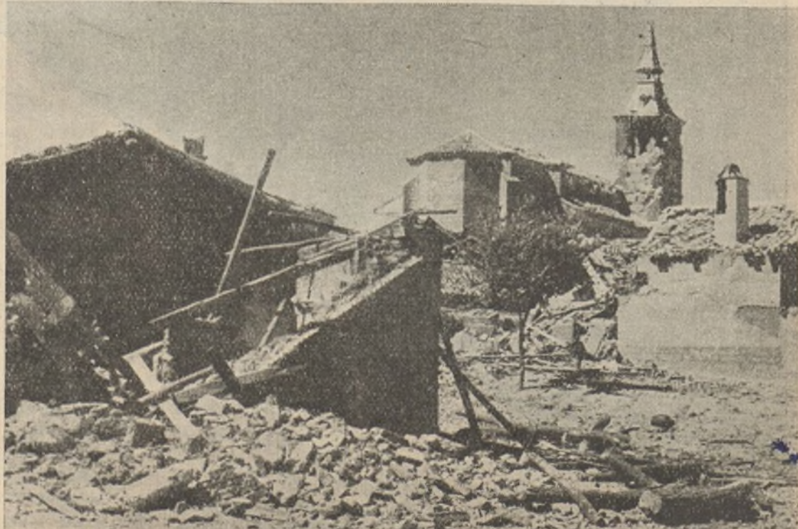
Quijorna después de liberada por nuestro ejército