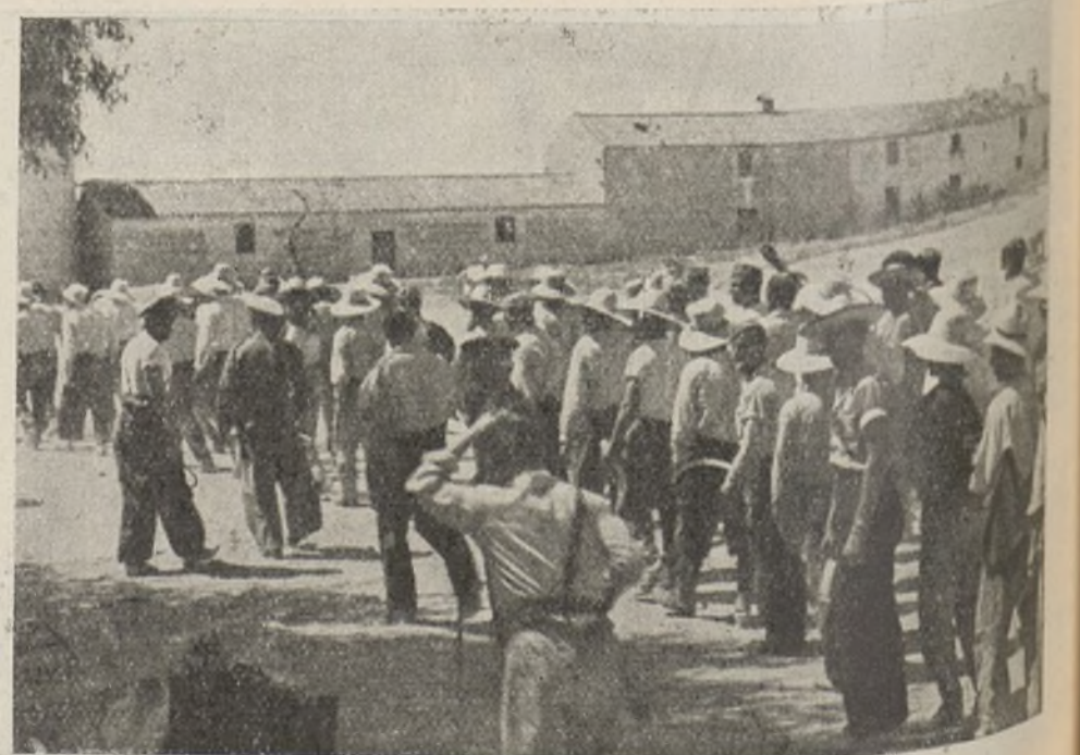
Soldados de la 106 Brigada, salen del pueblo desistiendo del descanso que le pertenece para recoger el cereal de las líneas de fuego