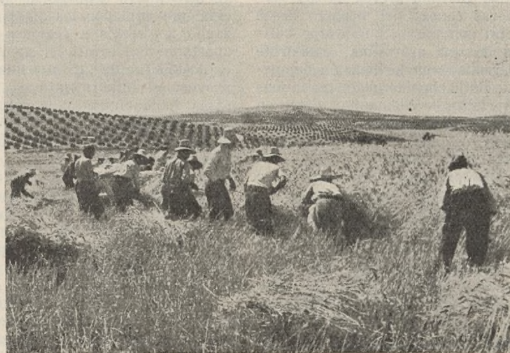
Soldados de la 106, ayudan a los campesinos y colectividades a hacer la recolección de cereales