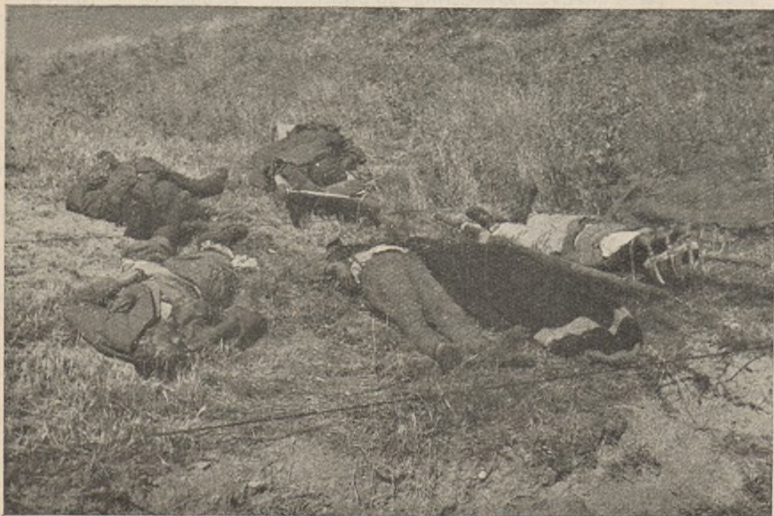
Nuestras fuerzas infligieron al enemigo un duro castigo en Lopera. He aquí algunos soldados facciosos, abandonados por los traidores en su huida.

NOTA.—Según me indican no son los primeros casos que comete este individuo.