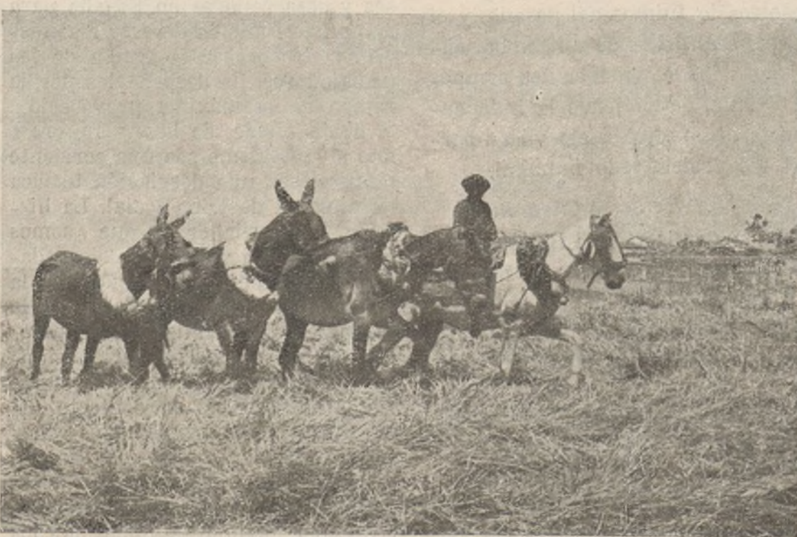
....Y en la retaguardia también se lucha por la victoria

Su nombre figurará con letras de oro en el libro sagrado de la Historia y miles y miles de españoles tratarán de imitarle.