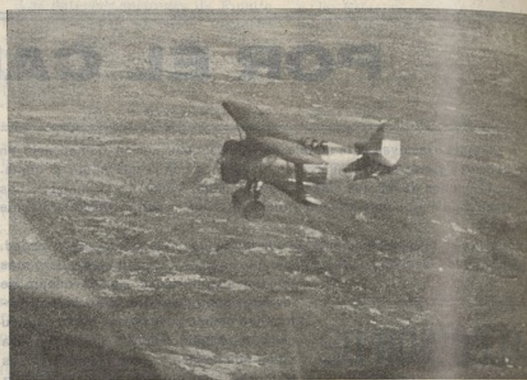
Un «Chato», distinto a esos otros que tanto le hacen hablar a la hiena de Sevilla