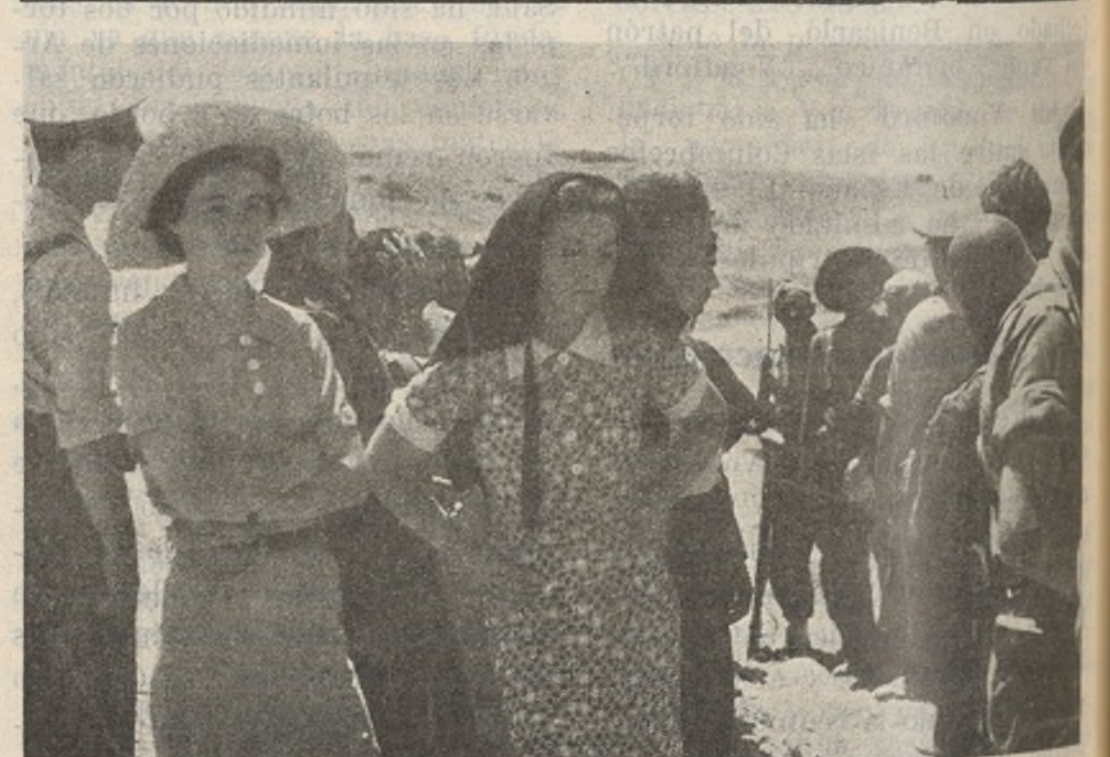
He aquí a la hija del Marqués de Larios, flor y nata de la más podrida aristocracia, capturada por nuestras fuerzas al entrar en Brunete y hoy magníficamente atendida en Valencia por el Gobierno de la República. La misma diferencia existe entre nuestra conducta y la de los militares sublevados, que entre la lealtad y la traición

«Jaén-Morata Tajuña.—Comisario 15 División a Frente Popular.—Soldados y población civil de Morata Tajuña acuerda en acto Frente Popular enviar calurosos saludos a Comité de Enlace Partidos Comunista y Socialista por labor desarrollada en pro unidad.»