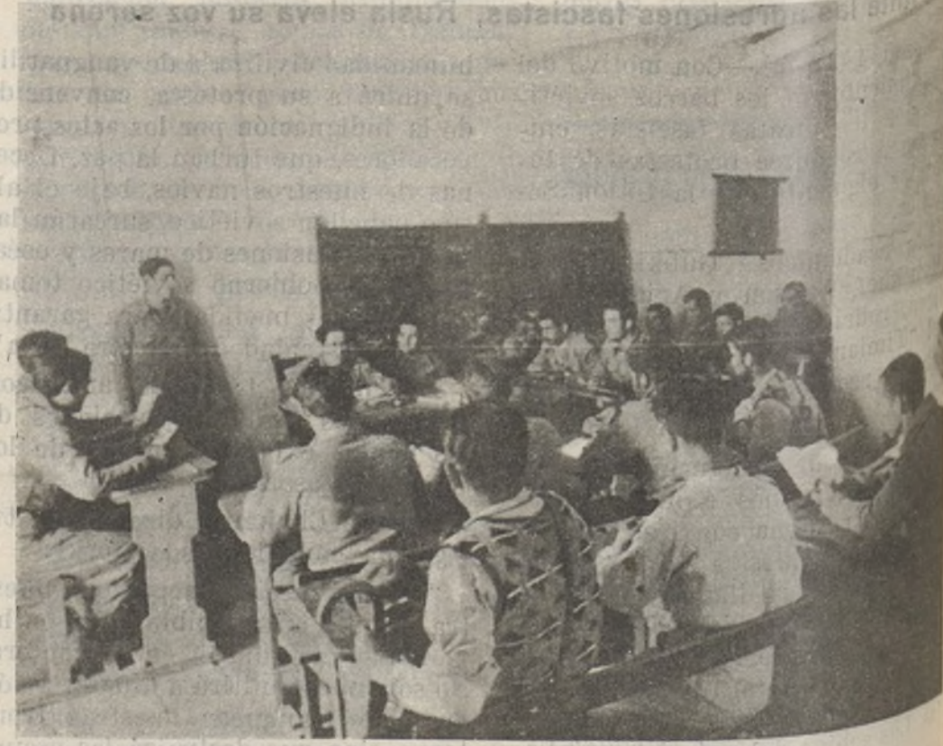
Escuela instalada en un cortijo a corta distancia del frente, donde a los soldados de nuestro Ejército Popular se instruye y capacita para que mañana puedan rendir, por su mejor cultura, más fruto a nuestra Patria