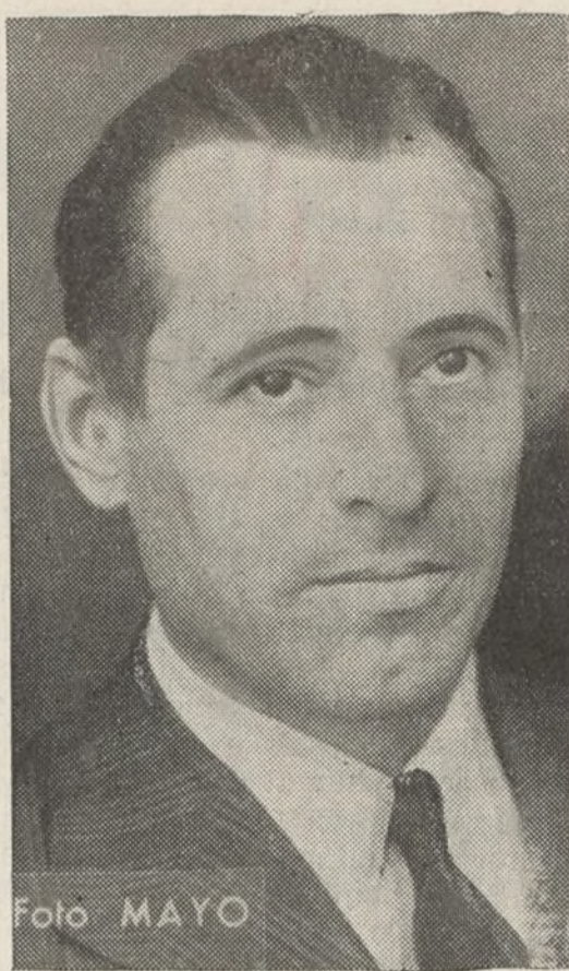
VICENTE URIBE Ministro de Agricultura a quien los campesinos quieren y admiran.

¡Delegados a la Conferencia Provincial Campesina: No faltar ninguno!