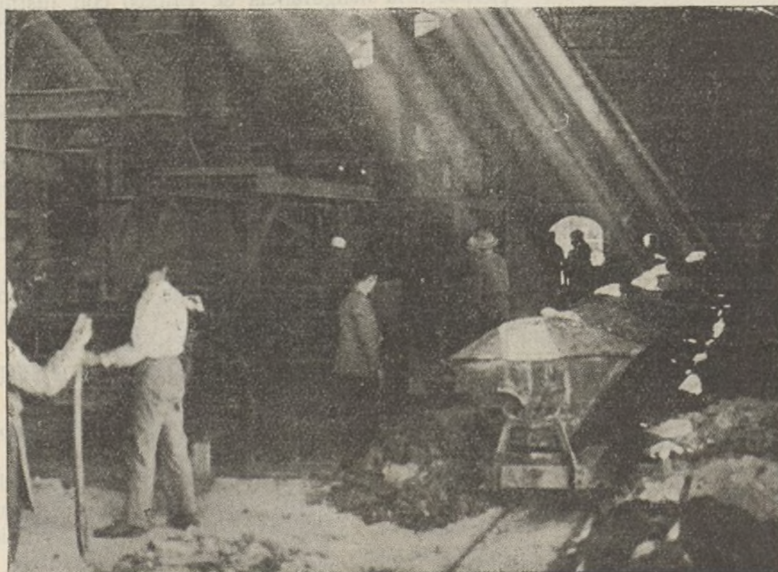
Como los de Asturias, estos mineros de la provincia de Jaén, también han sido expulsados por la C. E. de la U. G. T.

Ginebra.—Durante las últimas horas Agentes italianos en Ginebra, París y Londres han estado realizando una briosa campaña encaminada a atemorizar a Francia e Inglaterra, para ver si con ello consiguen alterar, debilitar o al menos modificar los acuerdos de Nyon. A pesar de todos los fallos de esos acuerdos se considera en Ginebra que la campaña italiana es prueba muy evidente del temor que inspiran a Italia para su campaña de piratería. Esta acción fascista italiana se realiza tanto en los pasillos de la Sociedad de Naciones como en el famoso Café Bavaria de Ginebra y en los despachos de los agentes comerciales y banqueros de Londres y París.