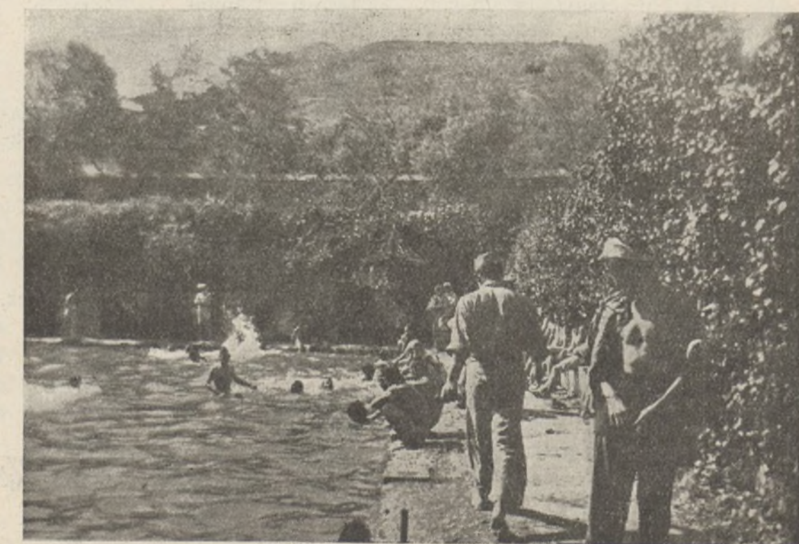
Soldados del 2.º Batallón de la X Brigada Mixta, tomando baños en una gran piscina a dos kilómetros del frente