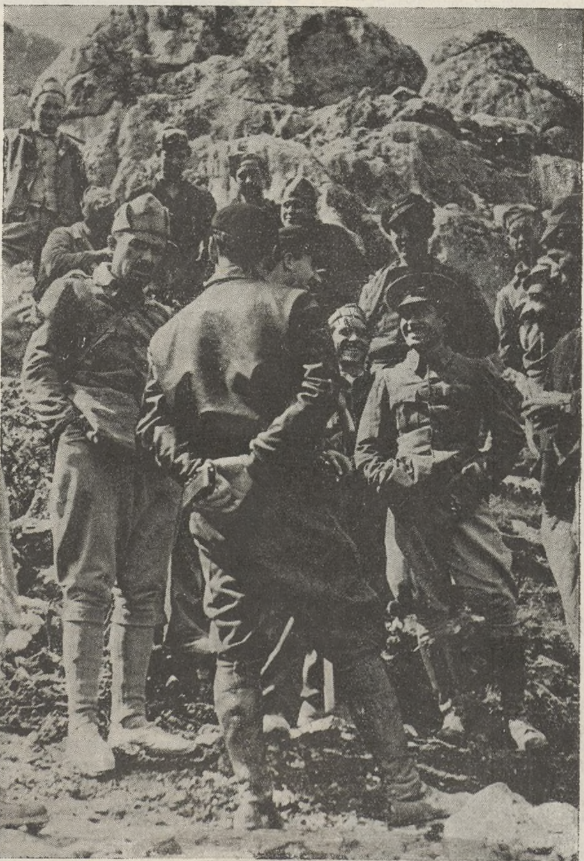
Soldados, Jefes y Comisarios de nuestro Glorioso Ejército Popular, hablando con un redactor de FRENTE SUR