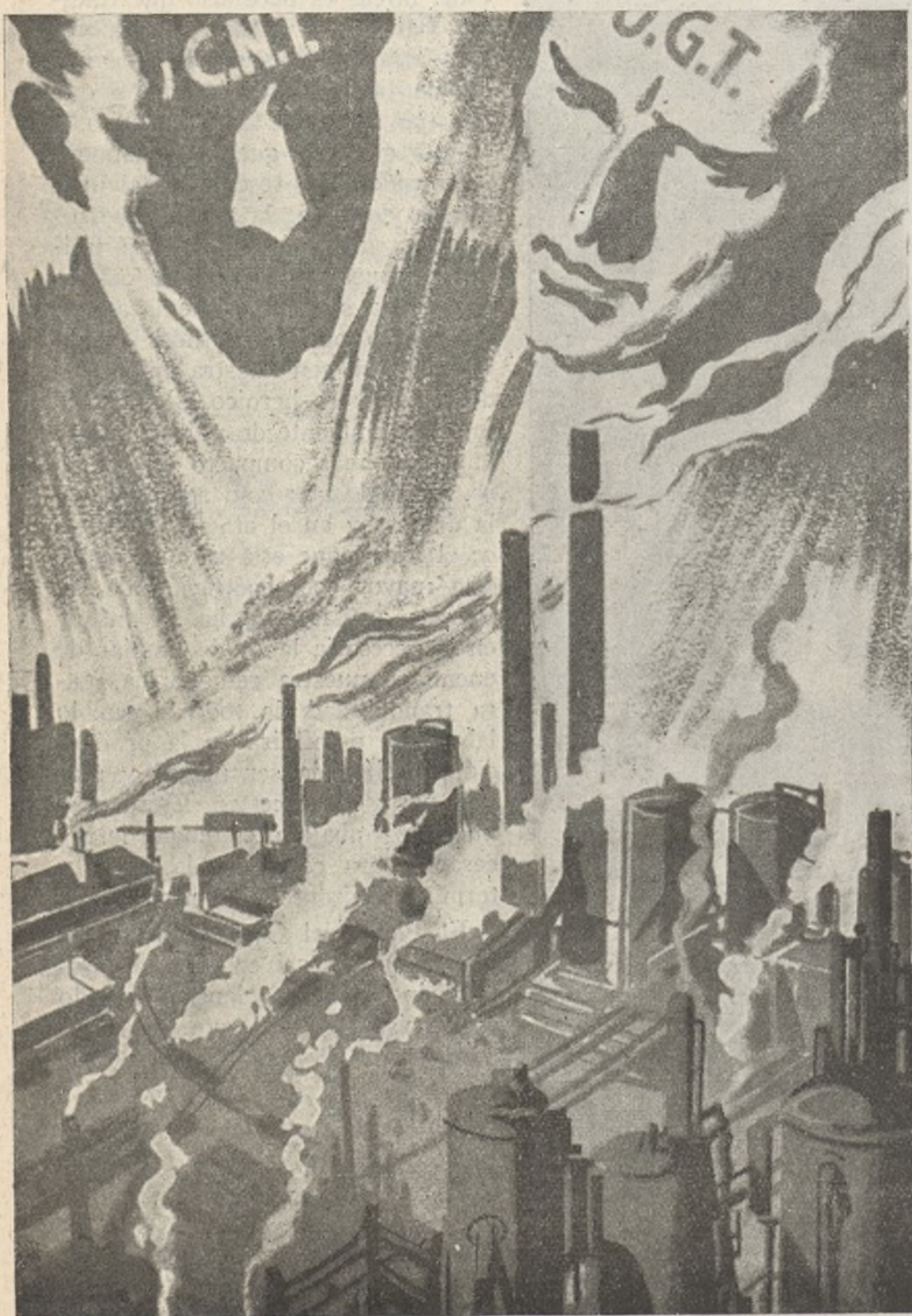
La unificación sindical y política fortalecerá el deseo de vencer de nuestros soldados, obreros y campesinos

LEVANTE. — Tiro de hostigamiento sobre los relevos enemigos de las cercanías de Sincla. La artillería propia cañoneó las posiciones y baterías enemigas del Puerto Escandón, logrando que éstas interrumpieran su fuego.