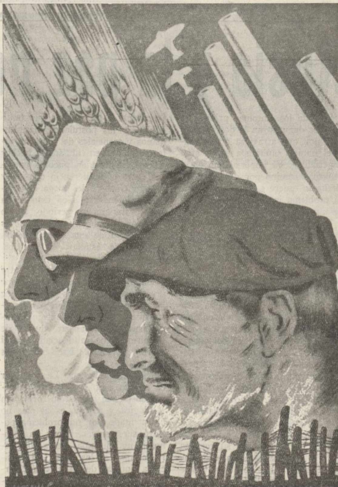
Con camiones, aviones, espigas, alambradas, hombres, muchos hombres y en ellos una gran voluntad de vencer, el triunfo será siempre de la causa de la República