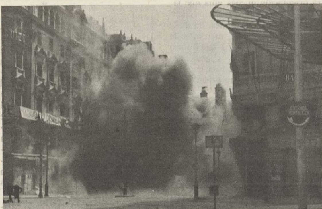
LA EXPLOSION DE UN OBUS