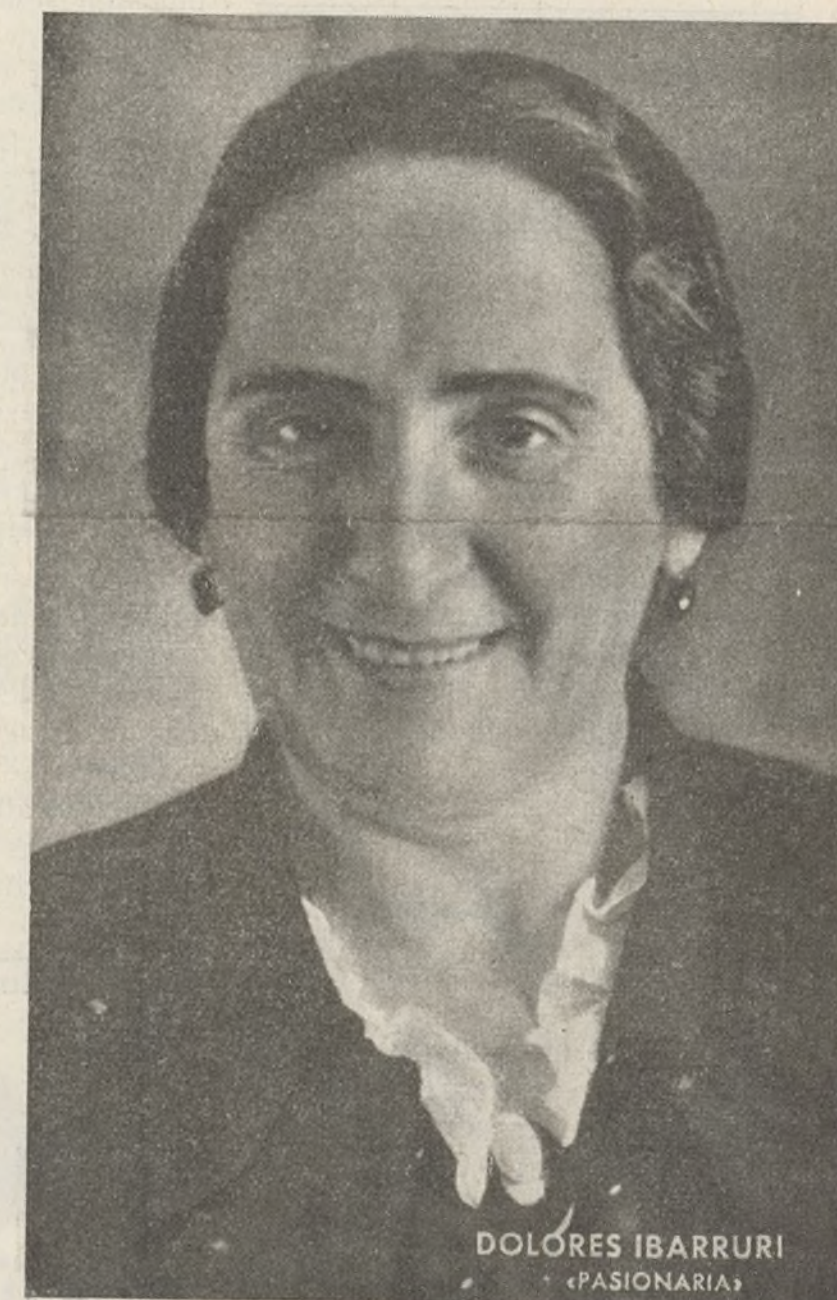
DOLORES IBARRURI «PASIONARIA»

Prototipo de la mujer antifascista, que en todo momento ha sabido imprimir decisión y coraje a nuestros combatientes alentando en sus pechos la consigna de: Mas vale morir de pie que vivir de rodillas