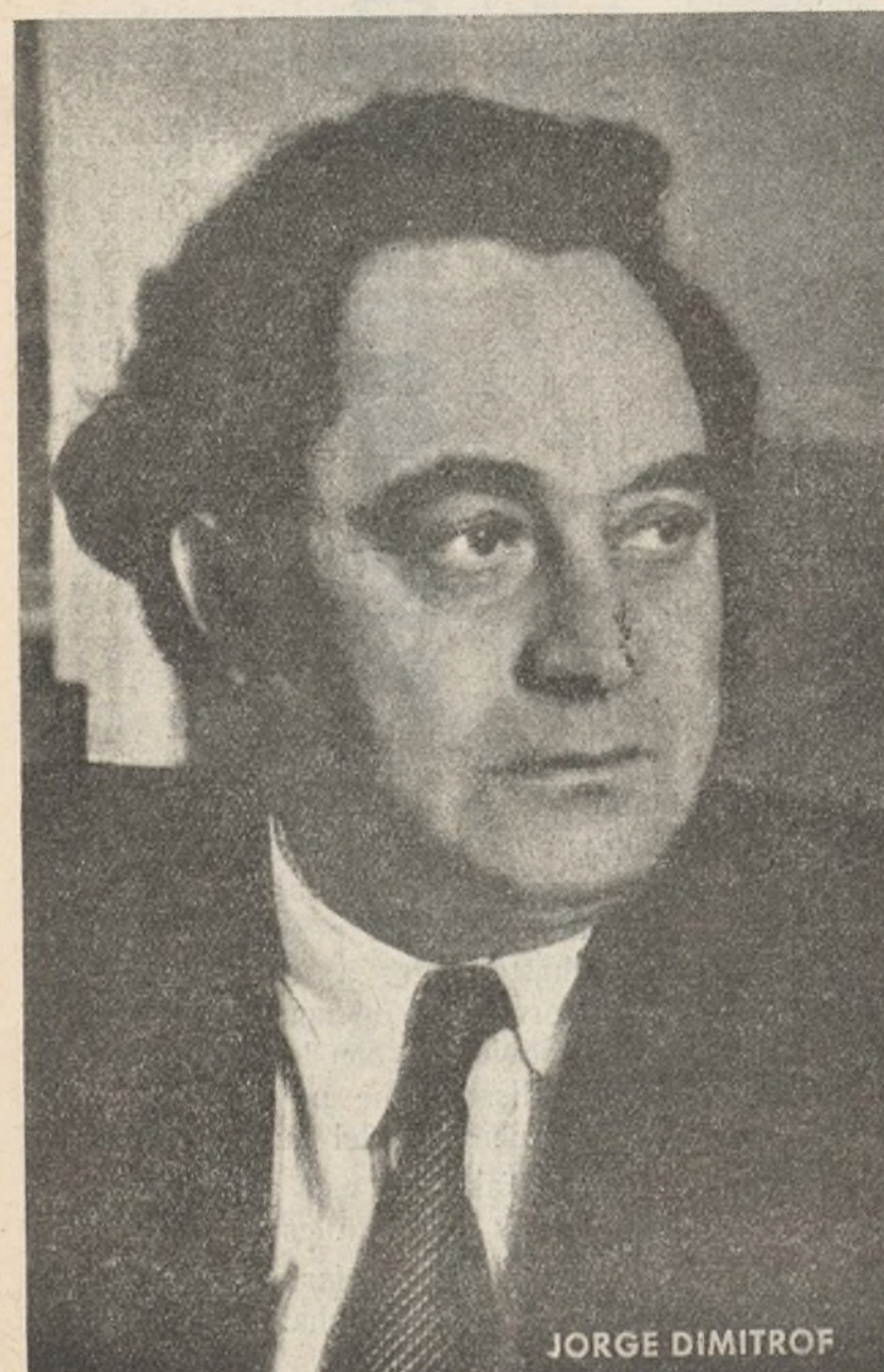
DIMITROFF Secretario General de la 3.ª Internacional que de acusado pasó a acusador poniendo de relieve ante el mundo entero los turbios manejos del fascismo y respondiendo a ellos con la feliz creación del Frente Popular Universal