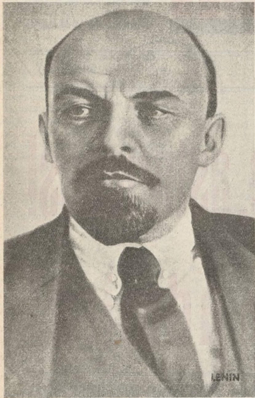
LENIN Al cumplirse el XX aniversario de la U. R. S. S. la figura de Lenin se agiganta juntamente con su imperecedera obra. "La Humanidad entera te dará el dictado de Padre de la Libertad"