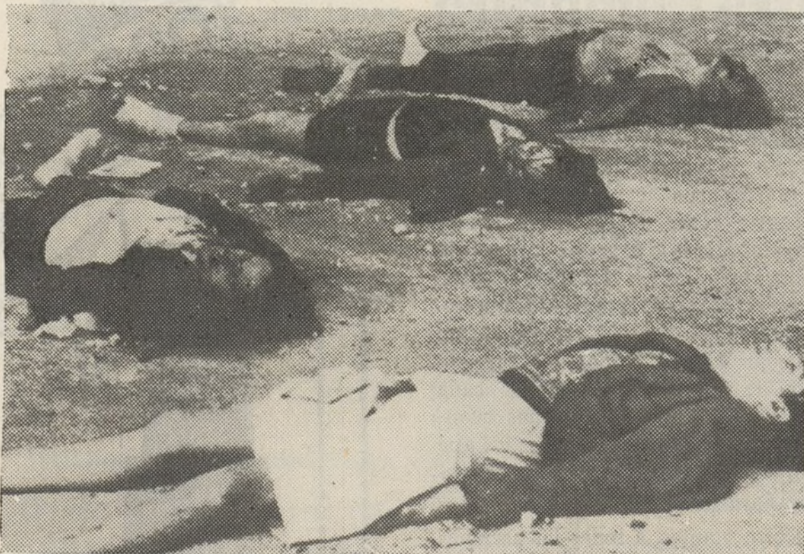
Ha pasado la horda invasora, dejando huella imperecedera de su espíritu sanguinario, cometiendo crímenes a mansalva, masacrando cadáveres, destruyendo, aniquilando. No respetan infancia ni vejez. Su odio destructor lo abarca todo: hombre, mujer, niño, enfermo, templo, museo... ¿La humanidad contemplará impasible esta vesanía destructora?