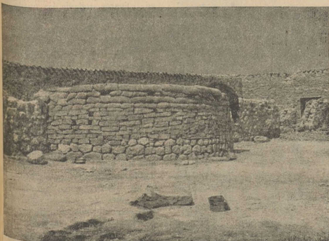
Fuerza y resistencia dan las fortificaciones. Vidas se ahorran con las fortificaciones. Elevan la moral de nuestros soldados las fortificaciones.

Esta es la línea de conducta de todo nuestro Partido.