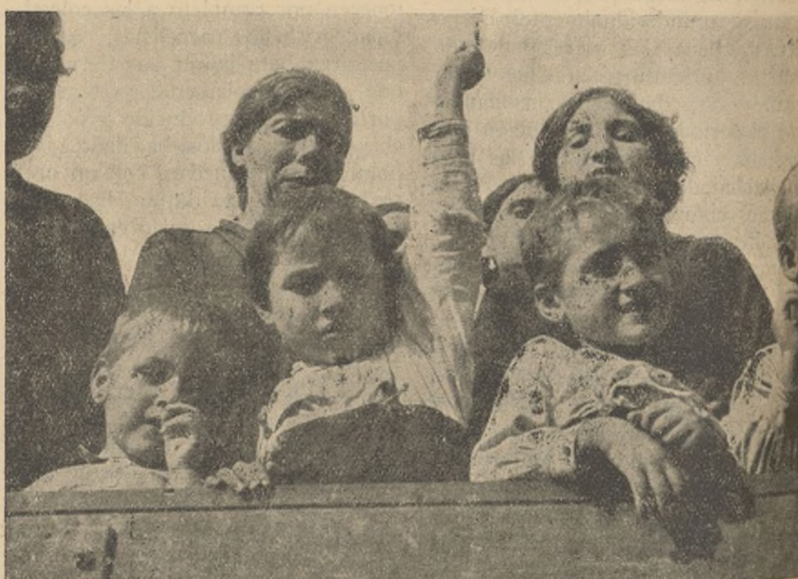
Los niños evacuados de las provincias del Norte, saludan a sus hermanos de la España leal

Nuestras Conferencias Comarcales han de ser verdaderos comicios de trabajadores de choque por línea de organización, para que al salir de éstas entremos de lleno en la rápida y justa realización inmediata de la organización del trabajo, haciendo que nuestro gran Partido en la provincia tenga la gran organización que le corresponde.