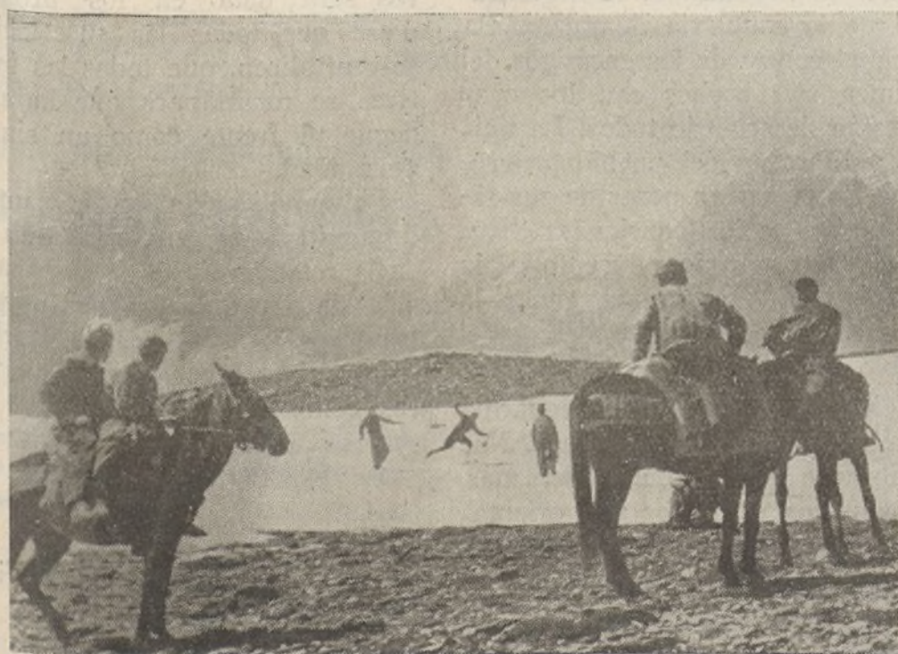
El ejercicio en la nieve, desentumeca los miembros. Así lo entienden nuestros soldados del sector de Granada

Se trata de que marchen y trabajen éstas, estrechamente unidas, con un único interés, con la misma responsabilidad, con el mismo entusiasmo y con el mismo fin: "GANAR LA GUERRA Y CONSOLIDAR LAS CONQUISTAS REVOLUCIONARIAS DEL PUEBLO".