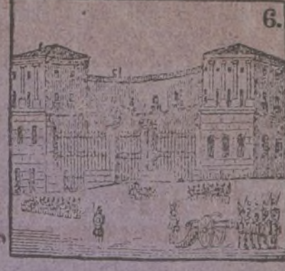
6 Defender se determina el palacio de Cristina.