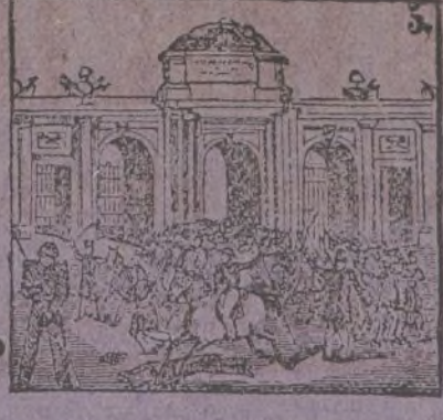
5 A Madrid la guarnición vuelve después de la acción.