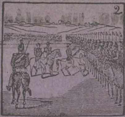
2 O'Donnell se pone al frente del ejército valiente.