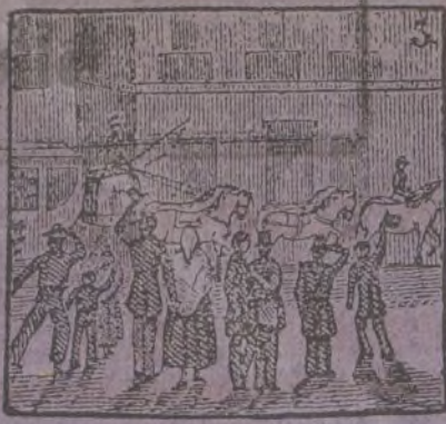
3 Por lo que al Gobierno importe vuelve la Reina a la corte.