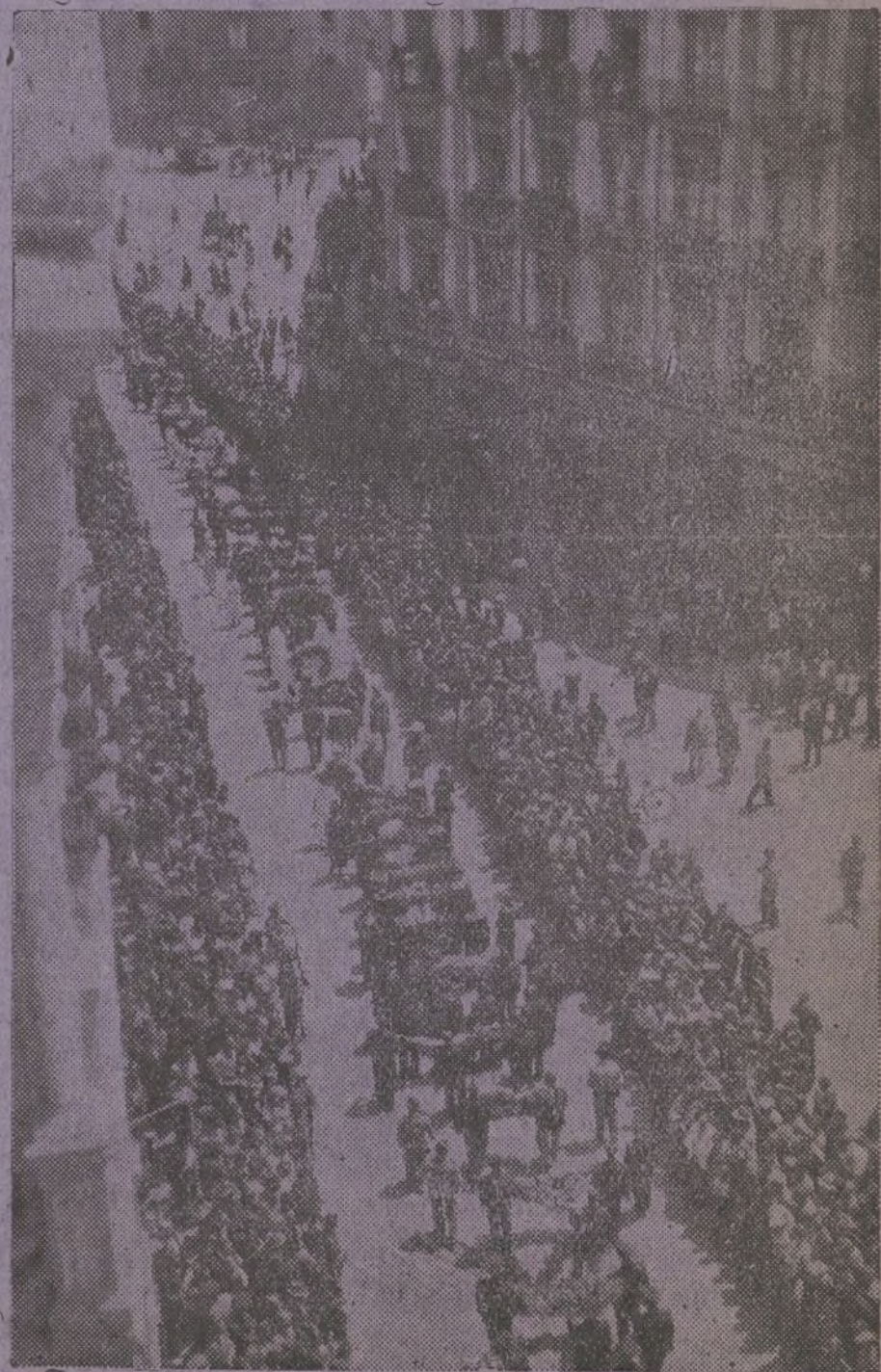
Un aspecto del entierro, en Almería, de los marinos del «Jaime» muertos por la metralla facciosa.

España no está sola. Si mira a los gobiernos de otras naciones y sólo ve enemigos, o salvo alguna honrosa excepción, amigos en exceso tímidos y cautos, sabe en cambio que el pueblo trabajador de todo el mundo está con ella. Esperando con ella. Y la conciencia de este apoyo, como los propios anhelos quijotescos, es el motivo que endurece a nuestros hombres en la pelea y es la mejor garantía de una victoria.