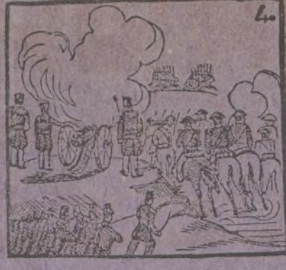
4 De Vicalvaro en los prados se baten los pronunciados.