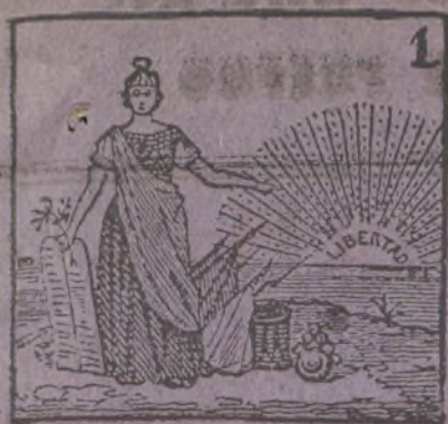
1 Santa empresa es en verdad morir por la libertad.