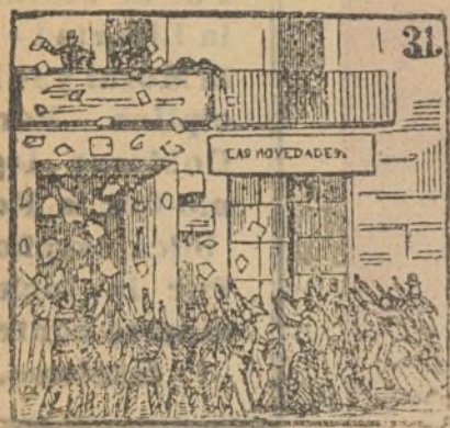
Se entusiasman los leales con proclamas liberales.