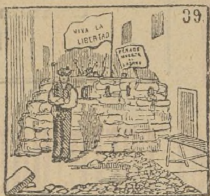
Guardan su puesto valientes los suitridos combatientes.