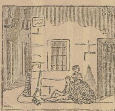
Son los paisanos heridos por mujeres socorridos.