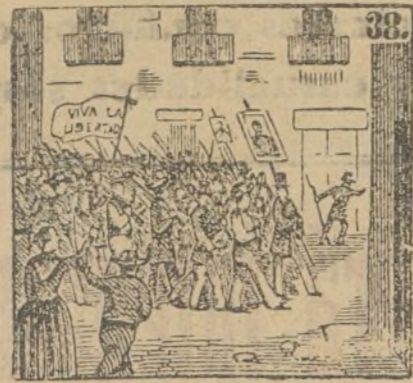
Tiene a O'Donnell y Espartero el pueblo amor verdadero.