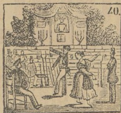
El pueblo lleno de gloria, saborea la victoria.