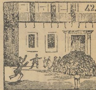
Presurosos los paisanos se alistan de milicianos.