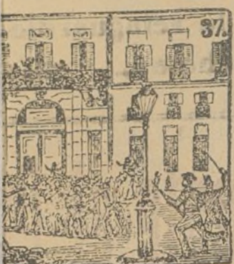
Sitiada la guarnición, se da a capitulación.