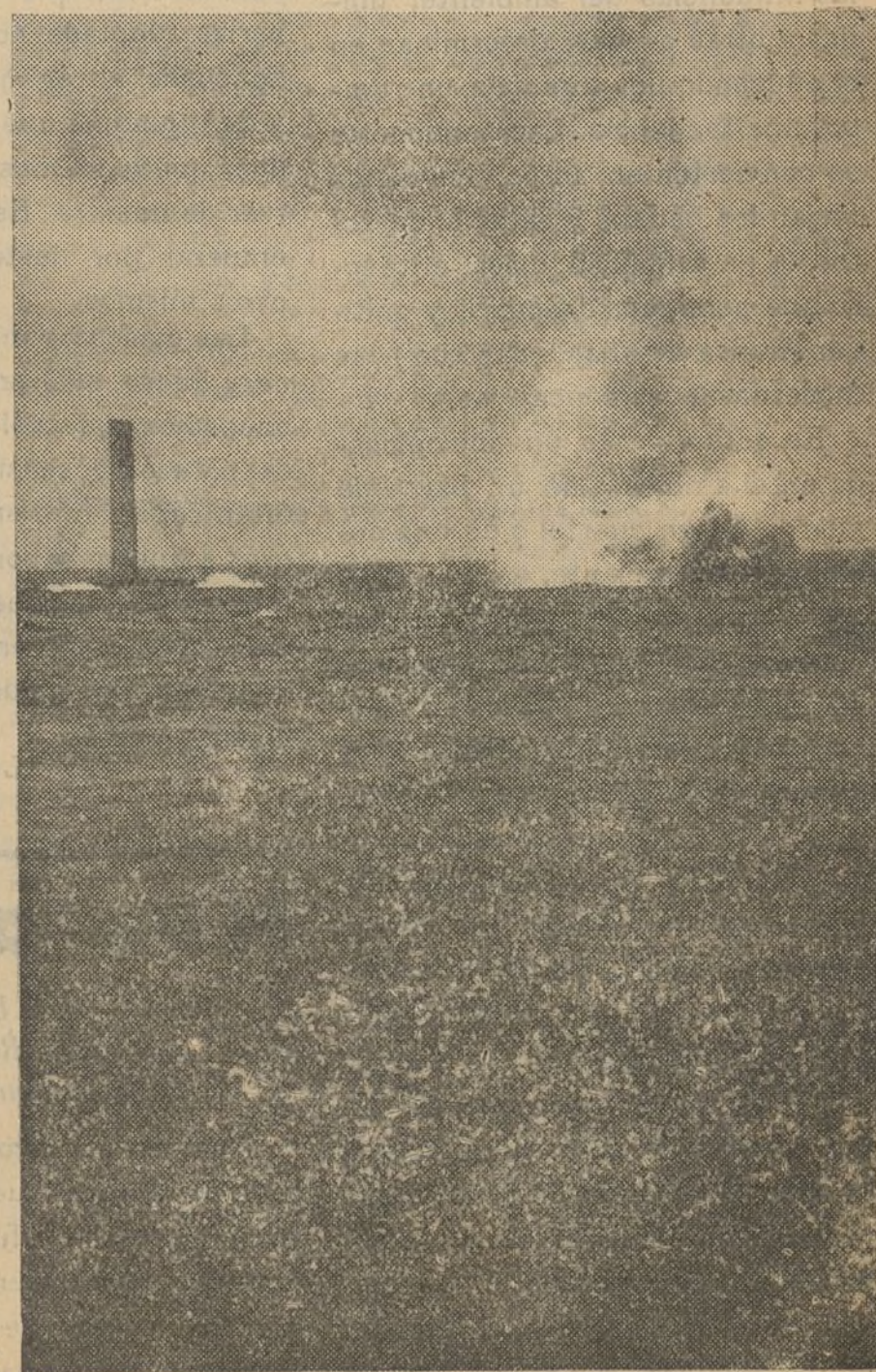
Ejercicios de tiro por nuestra Flota