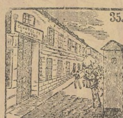
Quieren los paisanos luego dar a los cuarteles fuego.