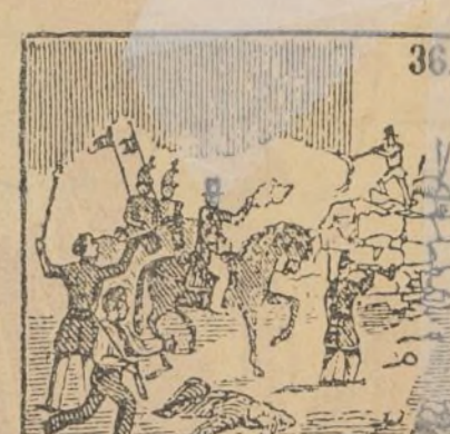
Cesa el combate sangriento por medio de un parlamento