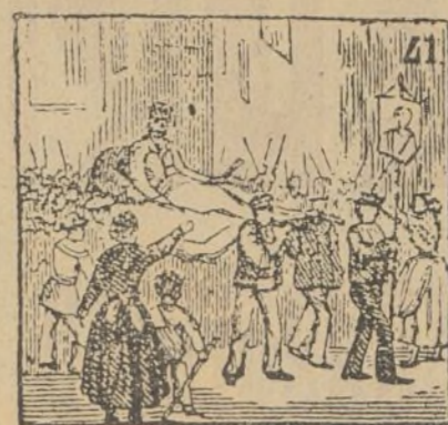
Siendo Chico fusilado, el pueblo queda vengado.