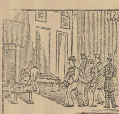
Se organizan hospitales de sangre provisionales.