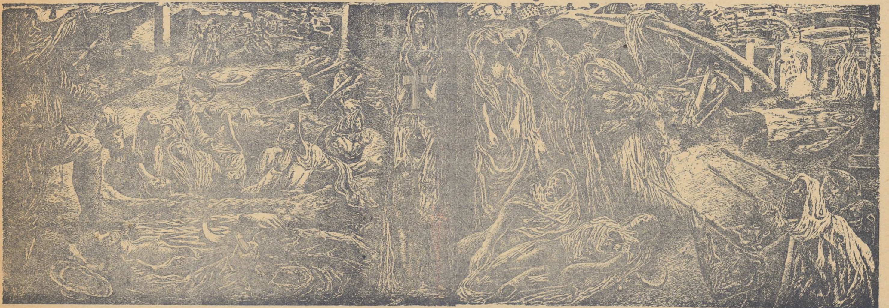
ELLOS TAMBIEN DAN TIERRA A LOS CAMPESINOS