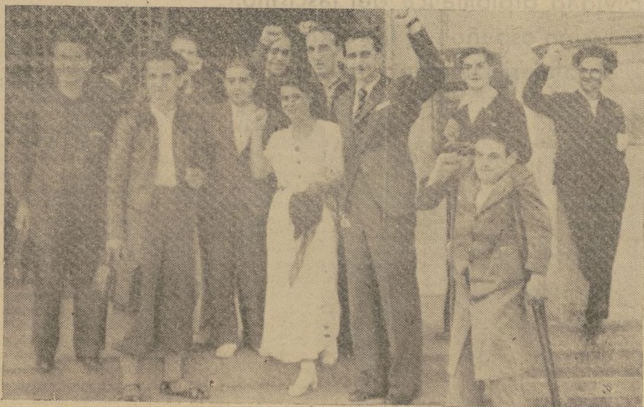
LA DELEGACION JUVENIL LIBERTARIA