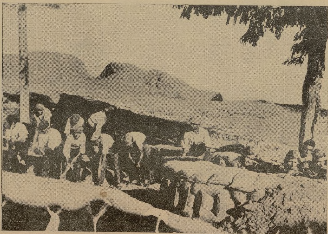
Un grupo de campesinos, en el Frente de Talavera, fortificando la retaguardia, mientras los bravos milicianos avanzan en vanguardia.

EN BREVE APARECERA "RUTA", SEMANARIO DE LAS JUVENTUDES LIBERTARIAS DE CATALUÑA.