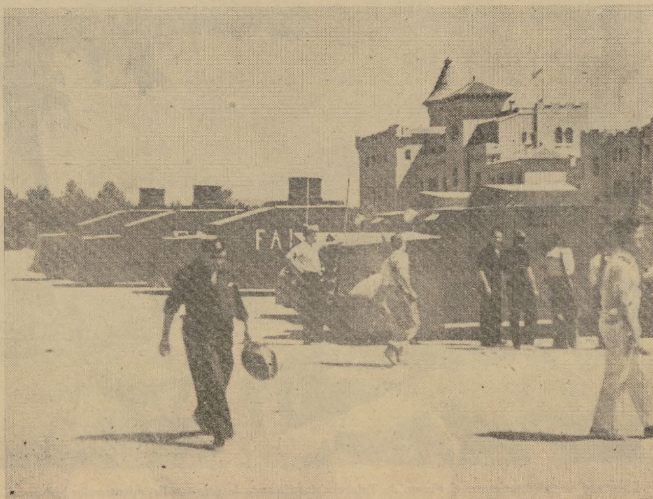
Tanques blindados de los compañeros anarquistas de Barcelona, esperan en el Cuartel de Miguel Ba- Ayuntamiento de Madrid