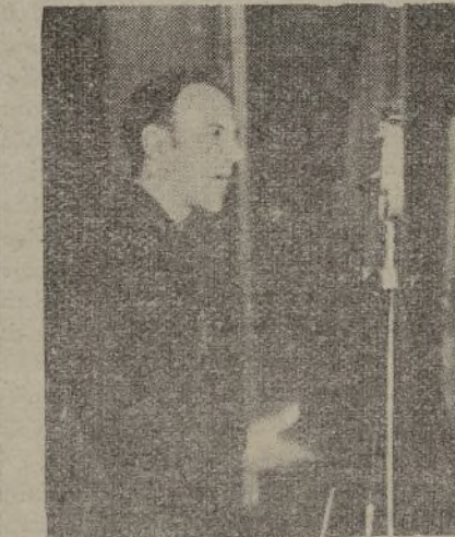
El compañero Cuenca hablando a los trabajadores madrileños

Habría necesidad de hacer algo de historia a fin de refrescar la memoria de todos los trabajadores, para que la experiencia pasada, pueda servirnos de norma para el futuro.