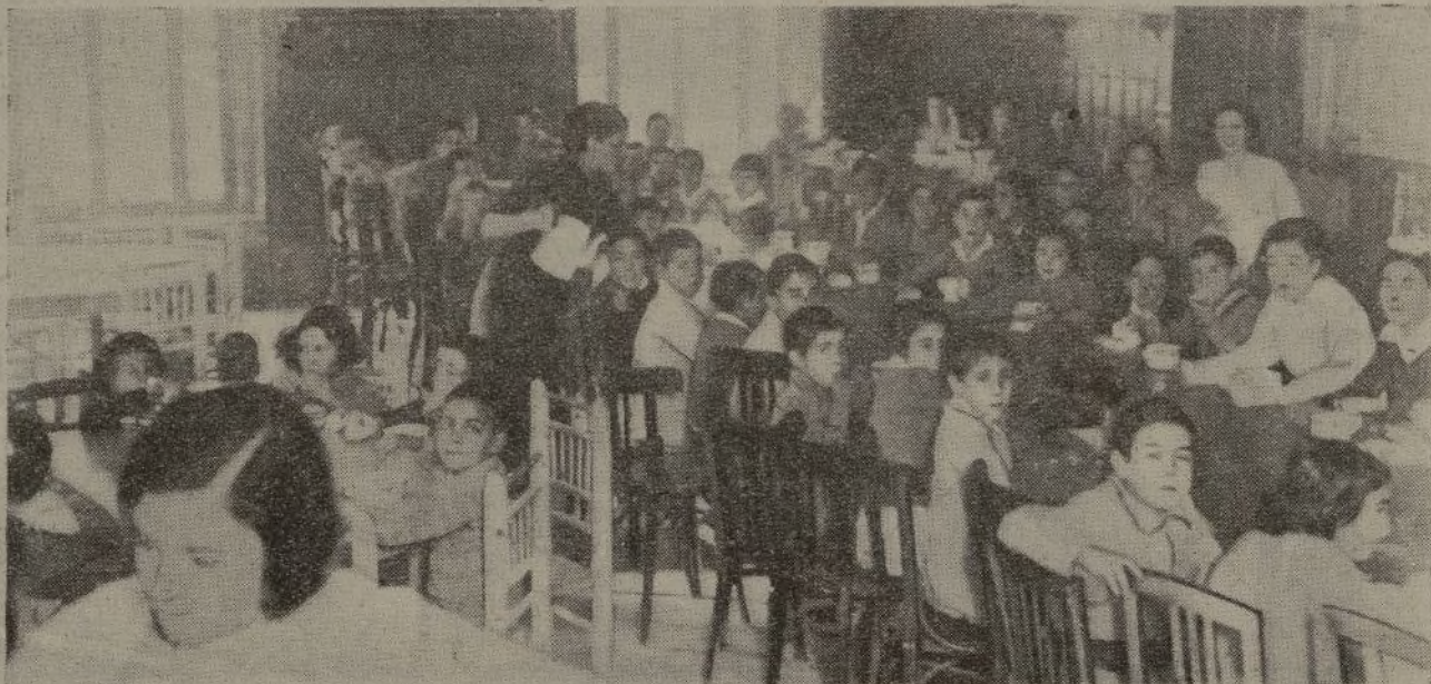
El almuerzo es abundante y limpio. El cuidado y cariño para todos, emocionante.

Llega la hora del desayuno. Todos corren como gamos a la finca que antes fué propiedad de los condes de Maudes. Bullicio, risas, infancia. Pronto, el café cargado de leche para evitar los efectos excitantes.