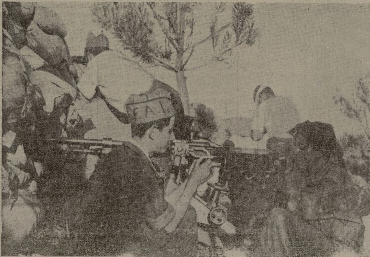
Jóvenes libertarios, haciendo fuego sobre el enemigo.

El Gobierno ya lo sabe. Que medite, y reflexione y cargue con la responsabilidad, si no quiere echar la lógica más elemental, aconseja no se provoquen las consecuencias.