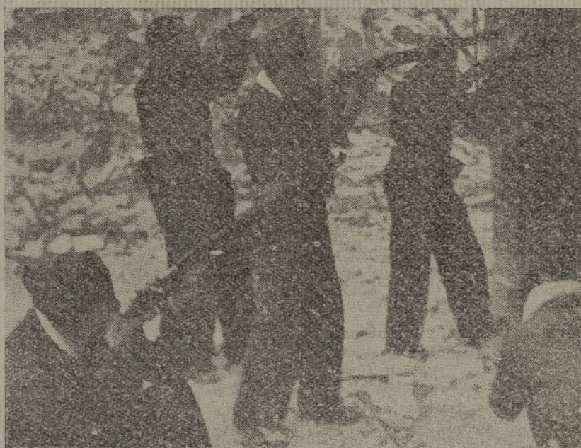
Compañeros vigilando una peligrosa salida en Toledo.

¡Juventud marxista y republicana! ¡Exigid la creación del Consejo Nacional de Defensa! El Consejo Nacional de Defensa, integrado por todos los partidos políticos y organizaciones obreras antifas- cistas en lucha, llevará a los traba- jadores a la victoria