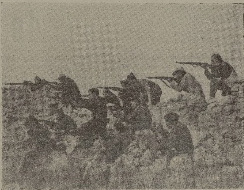
Los dinamiteros asturianos en un ataque a Bargas