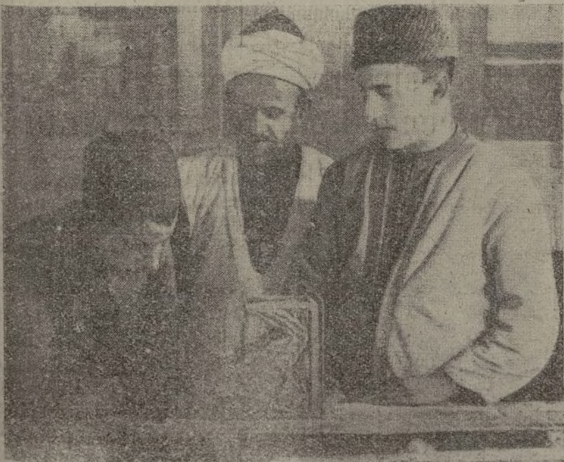
Compañeros marroquíes trabajando en un taller de carpintería de Tetuán.

Para el Presidente del Consejo de Ministro, para el Ministro de la Gobernación y Director general de Seguridad