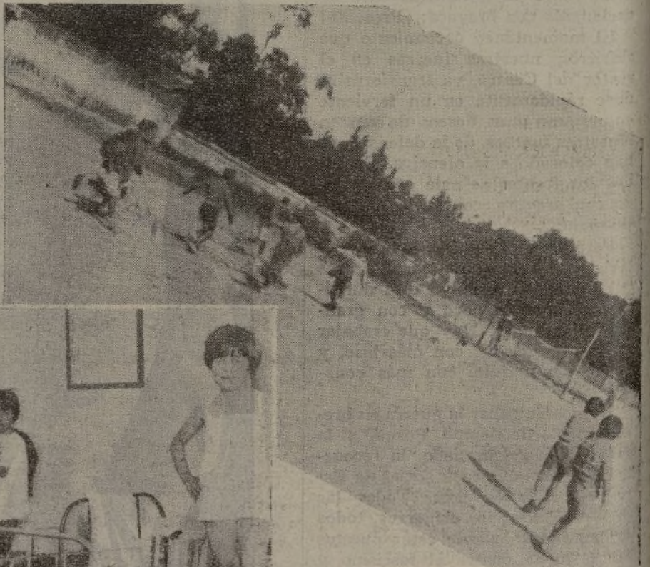
de salud y alegría a estas guarderías-escuelas infantiles.

Seguimos visitando los locales. Nos acercamos a los dormitorios. Camitas individuales, en donde la comodidad y la estética se hermanan admirablemente. No son dormitorios de internados ni de hospi-