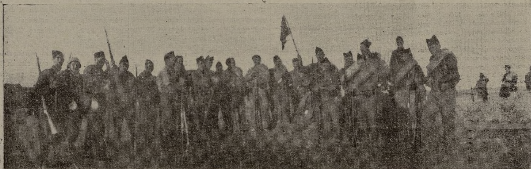
Un grupo de valientes milicianos, momentos antes de salir para las avanzadillas.

Ningún trabajador sinceramente revolucionario y antifascista pue- de negarse a la creación de este organismo. ¡Negarse a la creación del Consejo Nacional de Defensa es favorecer inconscientemente al fascismo!