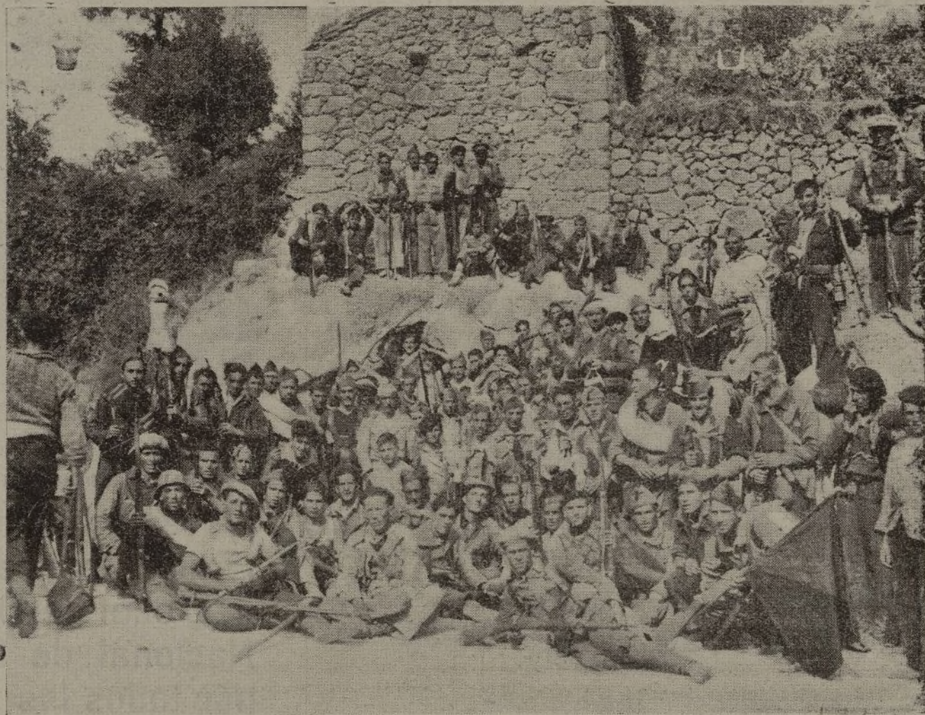
La Tercera Compañía del Batallón "Juvenil Libertario", en un descanso en Mijares (Avila).