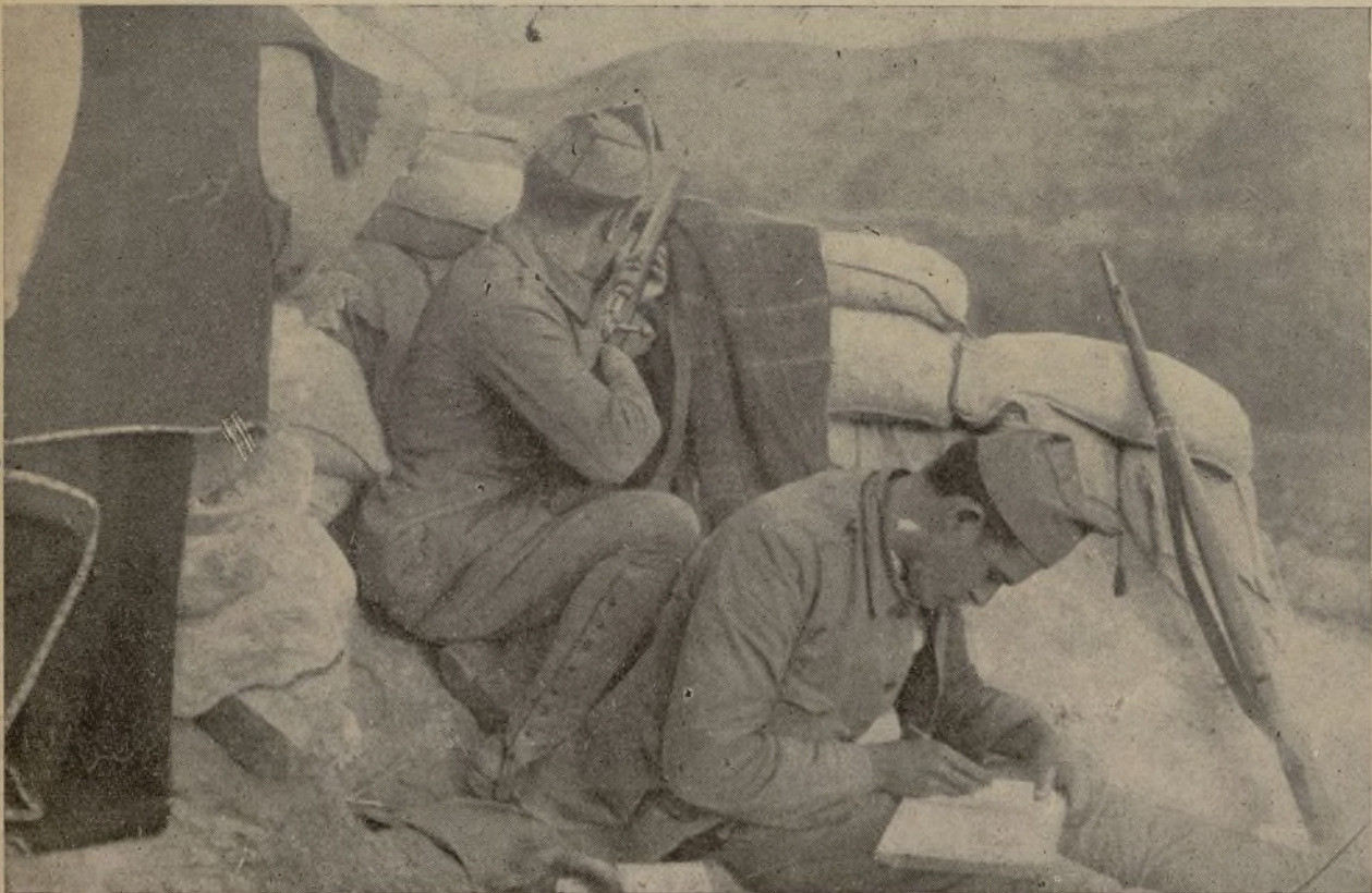
PUESTOS DE VIGILANCIA EN LAS AVANZADILLAS