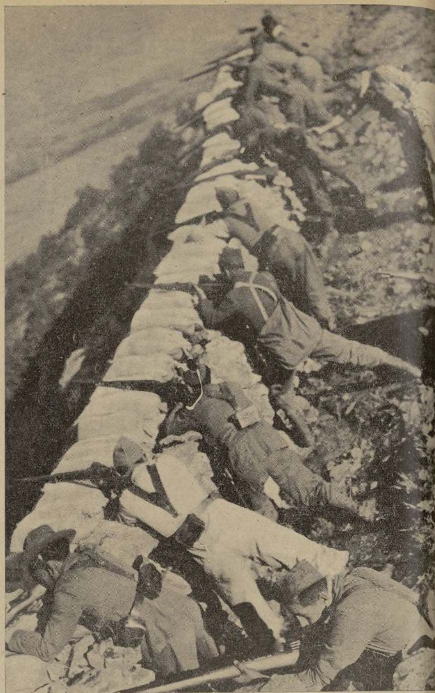
NUESTRAS MILICIAS, COMBATIENDO BRAVAMENTE CONTRA LAS FUERZAS FACCIOSAS QUE INTENTAN TOMAR MADRID