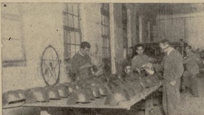
EN LOS TALLERES, LOS TRABAJADORES CONSTRUYEN CASCOS PARA RESGUARDAR A LOS MILICIANOS DE LAS BALAS ENEMIGAS