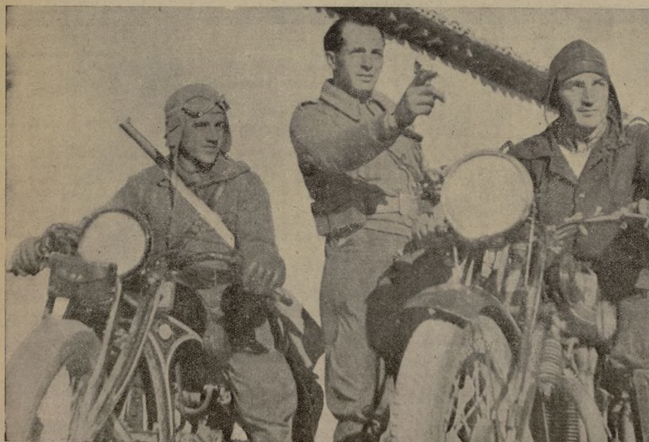
En el frente de Madrid, los milicianos del servicio motorizado de enlace observan las maniobras del enemigo.